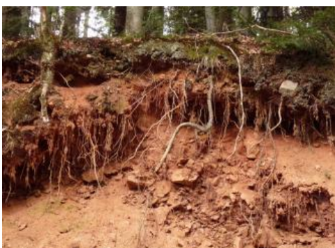
Rötlich gefärbte Braunerde aus Gneis-Schutt südlich von St. Peter (a3)

Gelegentlich treten an den Hängen, v. a. im Verbreitungsgebiet der Kartiereinheiten a3 und a30 , Braunerden auf, deren Solummaterial eine leuchtend rotbraune Farbe besitzt. Als Ursache wird eine geringe Beimengung des rotfärbenden Eisenoxids Hämatit angenommen, das aus sogenannten Ruschelzonen stammt und mit verlagert wurde (Garcia-Gonzalez & Wimmenauer, 1975; Stahr, 1979, S. 38). Ruschelzonen sind die Bereiche an tektonischen Störungen, in denen das Gestein stark zerrüttet ist. Über geologische Zeiträume hinweg konnte dort das Wasser tief ins Gebirge eindringen und rötliche Verwitterungsprodukte erzeugen. Örtlich, z. B. in der Gegend um St. Peter bei Freiburg, kann auch eine Beimengung umgelagerter Reste von Rotliegendensedimenten die Ursache für die Rotfärbung sein.