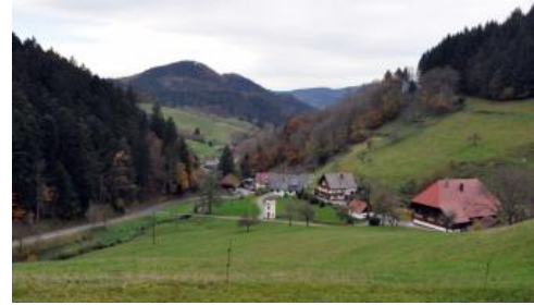
Kirnbachtal südlich von Wolfach im Mittleren Schwarzwald

Für die unteren Hangbereiche im Mittleren Schwarzwald, die durch die landwirtschaftliche Nutzung in historischer Zeit eine starke anthropogene Überprägung erfahren haben, wurde insbesondere im Kinzigtal und seinen Nebentälern eine eigene Kartiereinheit a132 vergeben. Die Hänge in Höhenlagen zwischen 250 und 800 m ü. NHN werden heute überwiegend als Grünland oder Wald und nur in den tieferen Lagen örtlich durch Obst- und Ackerbau genutzt. Über Jahrhunderte, z. T. bis in die Mitte des 20. Jh. hinein, fand dort jedoch eine Feld-Gras- oder Feld-Wald-Wirtschaft statt, die sog. Reutbergwirtschaft (vgl. Übersichtskapitel). Folgen dieser Wirtschaftsweise sind Wald- und Grünlandböden, die durch die frühere Bodenbearbeitung bis in den Unterboden humos sind (Braunerde, rigolte Braunerde). Daneben finden sich durch die Bodenerosion verkürzte Bodenprofile wie flach entwickelte Braunerden und Braunerde-Ranker sowie die zugehörigen Kolluvien am Unterhang und in Hangmulden. Mancherorts sind Ackerterrassen und Lesesteinhaufen als Zeugen der vergangenen Nutzungsformen erhalten.