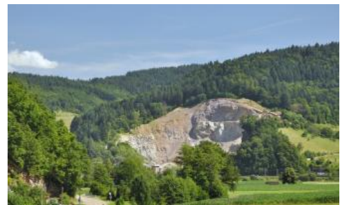
Flasergneis-Steinbruch bei Hausach-Hechtsberg im Kinzigtal

Die Braunerden aus Schuttdecken der im Mittleren Schwarzwald weit verbreiteten basenärmeren Flasergneise sind unter Wald oft podsolig ( a206 ). Die Schuttdecken aus dem harten, oft felsbildenden Gestein sind im Vergleich zu KE a3 skelettreicher und sandiger ausgebildet und die Böden weisen tendenziell eine geringere Entwicklungstiefe auf.