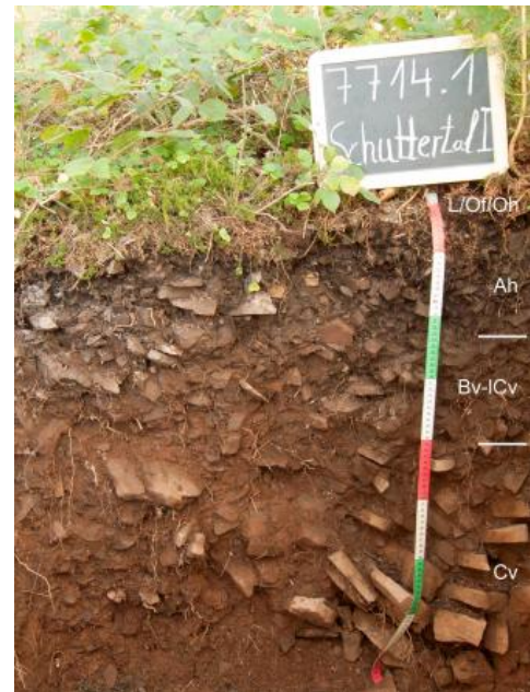
Braunerde-Regosol aus einer Schuttdecke aus Brandeck-Quarzporphyr (Begleitboden in a212)

In den ebenen bis schwach geneigten Scheitelbereichen auf den zwischen den Tälern gelegenen Bergrücken sind mittel und mäßig tiefe, unter Wald podsolige Braunerden verbreitet ( a213 ). In 3–7 dm Tiefe folgt oft schon der angewitterte Granit, örtlich auch Quarzporphyr (Rotliegend-Magmatite) oder Ganggesteine. Begleitend können auch stärker podsolierte Böden vorkommen und in Mulden und Sattellagen treten örtlich geringmächtige Kolluvien sowie Gley-Braunerden auf. Während Kartiereinheit a213 ihr Hauptverbreitungsgebiet im Nordschwarzwald und Mittleren Schwarzwald hat, ist die auf den schmalen Bergkämmen und Hangrücken ausgewiesene Kartiereinheit a212 in den Granitgebieten des gesamten zertalten westlichen Grundgebirgs-Schwarzwalds verbreitet. Neben flach und mittel tief entwickelten, stein- und blockführenden podsoligen Braunerden sind dort z. T. auch nur flachgründige Braunerde-Ranker und Ranker entwickelt.