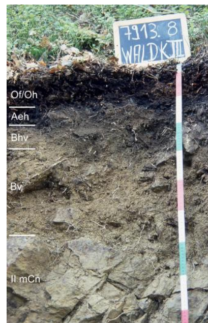
Mittel tief entwickelte podsolige Braunerde aus Hangschutt über anstehendem Paragneis (a120)