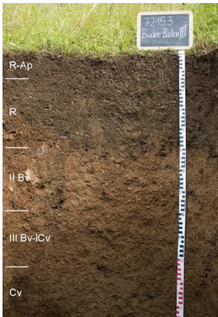
Mäßig tiefer Braunerde-Rigosol aus oberflächennah umgelagerter Granit-Fließerde auf Granitzersatz (a201)

Der heute an den Grundgebirgshängen am Fuß des Schwarzwalds v. a. zwischen Offenburg und Bühl betriebene Weinanbau hatte in früheren Zeiten noch eine größere Ausbreitung. So wurde im 19. Jh. noch im Kinzigtal hinauf bis Wolfach an den Südhängen Wein angebaut. Die Weinbergsböden der aktuellen und früheren Weinberge wurden in Kartiereinheit a201 zusammengefasst. Durch den Tiefumbruch (Rigolen) besitzen die ehemaligen Braunerden bis in den Unterboden einen geringen bis mittleren Humusgehalt. Mit abnehmender Höhenlage erfolgt eine zunehmende Beimengung von Lössmaterial in den Fließerden. Die Bodenarten der Rigosole schwanken daher stark zwischen lehmig-sandigen und schluffreichen Körnungen. Vielfach sind die Rigosole auch aus ehemaligen Parabraunerden in lösslehmreichen Fließerden hervorgegangen. In rebflurbereinigten und durch Terrassenbau geprägten Rebanlagen sind die ursprünglichen Böden sehr stark verändert und mit Auftragsböden vergesellschaftet.