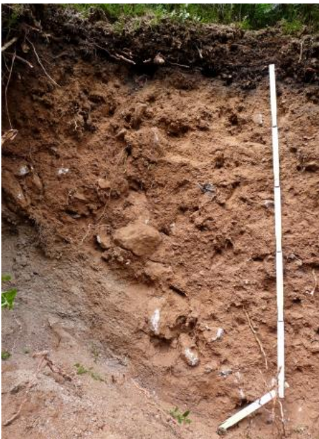
Tief entwickelte podsolige Braunerde aus Fließerden über Granitzersatz (a209)

An mehreren Stellen wurden an Unterhängen, in flachen Hangfußlagen und Mulden am westlichen Schwarzwaldrand Böden mit deutlichen Staunässemerkmalen kartiert ( a89 , Pseudogley-Braunerde bis Pseudogley). Beim Ausgangsmaterial handelt es sich um Abfolgen verschiedener Fließerden, örtlich auch um Verschwemmungssedimente. Als dichtgelagerte Stauhorizonte wirken hier meist lösslehmhaltige Fließerden (Mittellage) oder tonig-lehmige Basislagen.