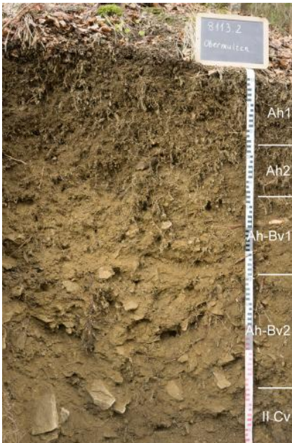
Humose Braunerde aus pleistozäner Fließerde (Basislage) über Hangschutt aus Gneis (a25)

Für die hoch gelegenen steileren Hangbereiche im Granitgebiet zwischen Feldberg und St. Blasien wurde eine eigene Kartiereinheit a53 vergeben (Bärhalde- und Schluchsee-Granit). Podsolige Braunerden und humose Braunerden aus Hangschutt und Fließerden sind hier die Leitbodenformen, begleitend können aber auch stärker podsolierte Böden auftreten. Die Humusformen wechseln vom moderartigen Mull bis zum Rohhumus.