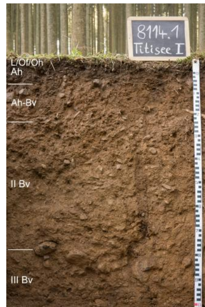
Tief entwickelte humose Braunerde aus geringmächtiger schutführender Fließerde über schuttreichen Fließerden (a23)