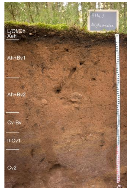
Mäßig tief entwickelte humose podsolige Braunerde aus pleistozäner Fließerde (Basislage) über Granitporphyr (a52)

Nach Osten hin, zwischen Schluchsee und Lenzkirch, werden die grobkörnigen Granite von mittelkörnigen Graniten, wie dem St. Blasien-Granit abgelöst. Auf den Berggrücken oberhalb 1000 m ü. NHN dominieren dort in KE a29 podsolige Braunerden und Braunerden. Da in diesem Bereich das Areal von Lumbricus badensis seine östliche Grenze findet, treten humose Braunerden nur noch vereinzelt auf und als Humusformen sind Moder und Rohhumus vorherrschend. Häufig ist festzustellen, dass die Podsolierung auf den Rücken und an Oberhängen am stärksten ausgeprägt ist und hangabwärts abnimmt (Stahr, K. in Wimmenauer & Schreiner, 1990).