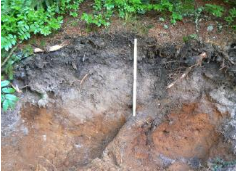
Podsol aus Glazialsediment

Ein noch kleinräumiger Bodenwechsel findet sich in den breiten glazialen Talmulden, Wannen und Trogtälern. Die dort anzutreffende Bodengesellschaft wird in Kartiereinheit a22 beschrieben. Es handelt sich oft um ein bewegtes, von Tälchen durchzogenes flachkuppiges Relief mit Verebnungen und angrenzenden stark gegliederten schwach bis stark geneigten Unterhanglagen. Als terrestrische Böden wechseln Braunerden, podsolige Braunerden und humose Braunerden aus lehmig-sandigem und sandig-lehmigem Material mit Braunerde Podsolen und Podsolen auf sandig-grusigen, oft blockreichen Gletscherablagerungen. Auf exponierten Kuppen sowie auf stein- und blockreichem Sediment treten Regosole und Ranker hinzu. In Flachlagen haben sich über der dichtgelagerten Grundmoräne vielfach Stagnogleye entwickelt, während in Hohlformen unterschiedlichste