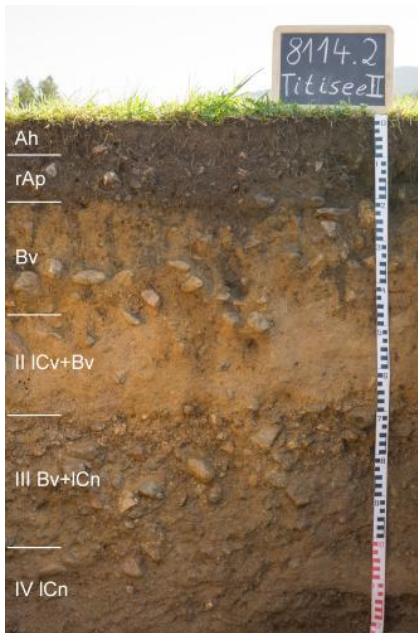
Mäßig tief entwickelte Braunerde aus Fließerde über glazifluvialen Ablagerungen (a17)

Weitere Niederterrassenflächen in den Schwarzwaldtälern wurden in Kartiereinheit a17 zusammengefasst. Sie sind besonders im Südschwarzwald im Bereich von Schmelzwasserablagerungen bei Titisee-Neustadt sowie im Albtal oder im Wiesetal verbreitet. Kartiereinheit a17 kommt auch am obersten Talabschnitt der Wutach und an ihren Zuflüssen vor, liegt dort aber aufgrund der jungen starken Taleintiefung rund 20–70 m über der heutigen Talsohle.