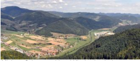
Mittlerer Schwarzwald und Kinzigtal zwischen Haslach und Hausach

In mehreren Tälern treten an den Hängen Verflachungen mit älteren, präwürmzeitlichen Schotterablagerungen auf. Im Murgtal bei Bayersbronn-Huzenbach sind in solchen Bereichen Kies und Geröll führende Braunerden mit flachgründigen Regosolen vergesellschaftet ( a72 ), während andernorts eher sandig-lehmige Braunerden dominieren ( a74 , a71 ), die am Hangfuß im Elztal auch geringmächtig kolluvial überdeckt sein können ( a75 ). Im Kinzigtal bei Haslach, im Schuttertal bei Seelbach-Wittelbach und im Murgtal (Nordschwarzwald) sind die älteren Terrassenschotter z. T. auch von lösslehmhaltigen Fließerden (Deck- über Mittellage) bedeckt oder in diesen