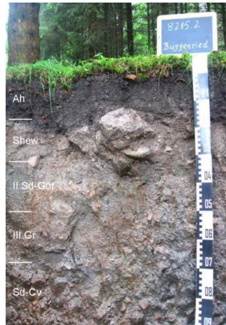
Stagnogley-Gley aus Fließerden (Decklage über periglaziär umgelagertem permzeitlichem Verwitterungsmaterial), Begleitboden in a41; Musterprofil 8215.2

Wo in den feuchten bis nassen und z. T. vermoorten Gebieten keine Entwässerungsmaßnahmen durchgeführt wurden, sind sie für die land- und forstwirtschaftliche Nutzung problematische Standorte. Der ganzjährige Sauerstoffmangel im Boden macht die Bewirtschaftung schwierig. Für naturnahe, an Feuchtigkeit angepasste Vegetation sind sie dagegen von besonderer Bedeutung.