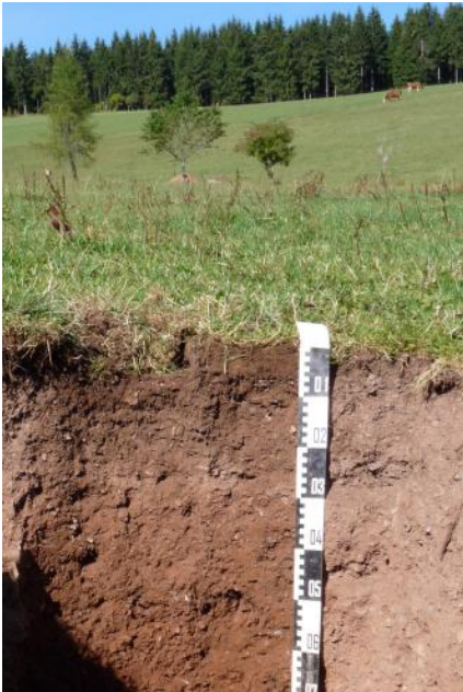
Kolluvium über Braunerde in der Talanfangsmulde oberhalb der Brigachquelle (a81)

Die mittel tief- bis tiefgründigen Auenböden der Täler mit mäßigem Grundwassereinfluss ( a6 , a82 , a83 ) sind gut zu bewirtschaftende, produktive Grünlandstandorte. Wo Dämme vor Überschwemmungen schützen, wie im Kinzigtal zwischen Hausach und Offenburg, oder wo ältere Auensedimente auf hochwasserfreien Auenterrassen liegen ( a63 , a129 , a130 ), werden die Böden auch ackerbaulich genutzt. Die stärker vernässten Talsohlen mit Auengleyen ( a7 , a8 , a224 ) sind dagegen meist Wiesen vorbehalten. Durch Drainagemaßnahmen oder Bodenauftrag wurden diese Bereiche z. T. auch stark verändert (z. B. a128 ).