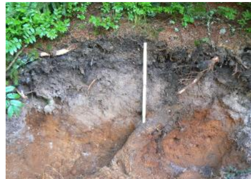
Podsol aus Glazialsediment

Der Bereich der Glazialablagerungen im Südschwarzwald ist durch einen kleinräumigen Wechsel der Böden und ihrer Eigenschaften gekennzeichnet. In Abhängigkeit von der Nutzung und dem Ausgangsmaterial, das sehr grob und sandig sein kann, finden sich alle Übergänge von der z. T. humosen Braunerde bis zum Podsol. Sie sind mit Grund- und Stauwasserböden sowie kleinen Mooren in den Hohlformen vergesellschaftet ( a22 ). Wo die Moränen lückenhaft und geringmächtig sind und/oder an Hängen in Hangschuttdecken aufgearbeitet wurden, dominieren wiederum Braunerden, podsolige Braunerden und humose Braunerden ( a23 , a52 , a53 ). Am ungünstigsten für die waldbauliche Nutzung sind dabei die stärker podsolierten Böden im Verbreitungsgebiet mittel- bis grobkörniger Granite in der weiteren Umgebung des Schluchsees. Es handelt sich dabei um Podsol-Braunerden, Braunerde-Podsole und untergeordnet auch um Podsole aus verlagertem Verwitterungsmaterial des Bärhalde- und Schluchsee-Granits ( a27 ).