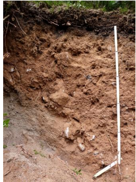
Tief entwickelte podsolige Braunerde aus Fließerden über Granitzersatz ( a209 )

In vielen Granitgebieten dominieren dagegen podsolige Braunerden, die örtlich mit stärker podsolierten Böden vergesellschaftet sind (Podsol-Braunerde, Braunerde-Podsol; a209 , a5 , a12 , a212 , a213 ). Besonders grobkörnige und quarzreiche Granite wie der Eisenbach-Granit zwischen Titisee-Neustadt und Villingen neigen zu sandig-grusiger Verwitterung und starker Versauerung. In diesem Raum können auch im mittleren Grundgebirgs-Schwarzwald voll entwickelte Podsole vorkommen ( a14 ), wie sie sonst nur für den Buntsandstein-Schwarzwald typisch sind. Sie besitzen einen hellen gebleichten Oberboden, Anreicherung von Humus und Eisenoxiden im Unterboden und eine meist mit Heidelbeeren bewachsene Auflage aus schwarzem Rohhumus. Es handelt sich um sehr stark versauerte Böden mit wenig Bodenleben und schlechten Nährstoffverhältnissen. Stärker podsolierte Böden mit den Waldhumusformen Moder oder Rohhumus kommen auch dort vor, wo den Deckschichten Gesteinsschutt aus dem hangaufwärts anstehenden Buntsandstein beigemischt ist ( a203 , a204 ).