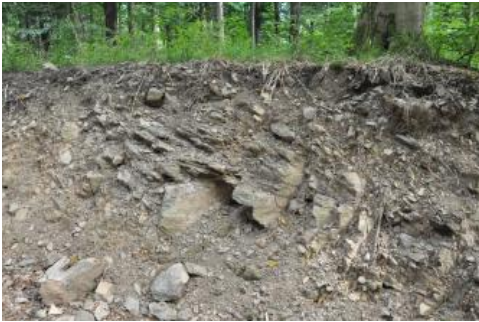
Ranker aus Gneiszersatz am Urenkopf bei Haslach (a122)

Problematischer ist die Wasser- und Nährstoffversorgung an flachgründigen Standorten auf schmalen Berg- und Hangrücken oder in Kammlagen, wo die Braunerden z. T. nur flach entwickelt und mit Rankern vergesellschaftet sind ( a212 , a120 , a122 ). Die nFK ist dort nur sehr gering bis gering (20–90 mm) und die Bäume sind in Trockenperioden darauf angewiesen, sich zusätzlich mit dem Wasser aus Felsspalten und Klüften zu versorgen. Noch extremere Standorte, was Durchwurzelbarkeit, Wasser- und Nährstoffversorgung angeht, finden sich im Verbreitungsgebiet der Kartiereinheiten a207 und a1 . Dort tritt der anstehende Fels oft an die Oberfläche und es treten Block- oder Steinschutthalden auf, die fast keinen Feinboden enthalten. In den Kartiereinheiten a212 und a1 wurden neben den flachgründigen Böden aus Granit auch die Standorte auf hartem, schwer verwitterbarem und