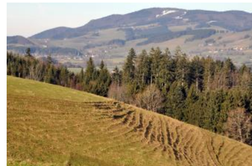
Blick nach Nordwesten über die Hochmulde von St. Peter zum Kandel (1241 m ü. NHN)

Die Erosionsanfälligkeit der Braunerden ist wegen ihres guten Infiltrationsvermögens und dem damit verbundenen geringen Oberflächenabfluss als gering anzusehen. Die in Hohlformen und Hangfußlagen vorkommenden Kolluvien zeigen aber, dass es in der Vergangenheit nach Kahlschlägen und infolge von Ackerbau in Hanglage zu Bodenerosion gekommen ist. Auf beweideten Flächen können Trittschäden an viel begangenen Stellen in Hofnähe oder um Viehtränken die Grasnarbe verletzen und so Ansatzstellen für die linienhafte Erosion schaffen. Ein ähnliches Problem gibt es heute in den beliebten Gipfelregionen des Feldbergs und Belchens, wo Touristen die ausgeschilderten Wege verlassen.