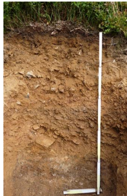
Podsolige Braunerde aus Gneisschutt führenden Fließerden über Gneiszersatz (a50)

Durch Verwitterung, Verbraunung und Verlehmung wurden die Minerale der Kristallingesteine aus ihrem Verband gelöst. Neben Quarzsand entstanden aus den Feldspäten und Glimmern Tonminerale und braun färbende Eisenoxide. In den Deckschichten aus silikatischem Gesteinsmaterial entwickelten sich so im Laufe des Holozäns überwiegend mittel tief bis tief entwickelte Braunerden. Da die Kartiereinheiten mit Braunerden als Leitböden im Grundgebirgs-Schwarzwald über 84 % der Fläche einnehmen, ist die Bodenvielfalt in der Bodengroßlandschaft nicht besonders groß. Nur in den lössbeeinflussten, tiefgelegenen Randzonen gehen die Braunerden kleinräumig in Parabraunerden über und in Talsohlen ergänzen Auenböden das Bodenmuster. Eine wesentliche weitere Differenzierung ergibt sich aufgrund des stark vom Relief abhängigen Bodenwasserhaushalts. Ein großer Teil der hohen Niederschlagsmengen sickert in die durchlässigen Deckschichten ein und bewegt sich oberflächenparallel über dichter gelagerten Schuttdecken und dem anstehenden Grundgebirge abwärts. In Hangnischen, Mulden und Tälern tritt das Grundwasser wieder nahe an die Oberfläche, sodass dort verbreitet Gleye und Anmoorgleye bis hin zu Mooren auftreten.