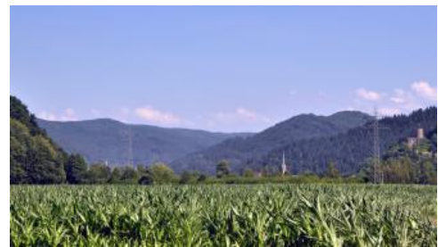
Kinzigtal bei Hausach

Die mittel tief- bis tiefgründigen Auenböden der Täler mit mäßigem Grundwassereinfluss ( a6 , a82 , a83 ) sind gut zu bewirtschaftende, produktive Grünlandstandorte. Wo Dämme vor Überschwemmungen schützen, wie im Kinzigtal zwischen Hausach und Offenburg, oder wo ältere Auensedimente auf hochwasserfreien Auenterrassen liegen ( a63 , a129 , a130 ), werden die Böden auch ackerbaulich genutzt. Die stärker vernässten Talsohlen mit Auengleyen ( a7 , a8 , a224 ) sind dagegen meist Wiesen vorbehalten. Durch Drainagemaßnahmen oder Bodenauftrag wurden diese Bereiche z. T. auch stark verändert (z. B. a128 ).