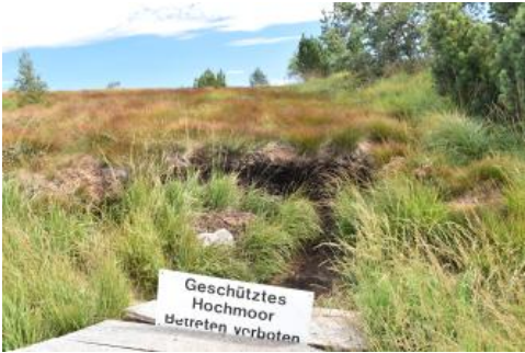
Hochmoor auf der Hornisgrinde (b200)

Bei vielen kleinen Mooren mit geringmächtigen Torflagen nimmt man an, dass sie ihre heutige Ausdehnung erst durch die Rodungen und das Eingreifen des Menschen erreicht haben (Radke, 1973; Frenzel 1978b). Die Entwicklung der großen Moorkomplexe auf den Enzhöhen, im Wasserscheidenbereich zwischen Enz und Murg, hat dagegen bereits nach dem Ende der letzten Kaltzeit begonnen. Die Hochmoore sind dort auf Versumpfungsmooren angewachsen, die sich in flachen Senken und Firneismulden gebildet haben. Der ausgedehnte Hochmoorschield des bekannten Wildseemoors bei Gernsbach-Kaltenbronn besitzt Torfmächtigkeiten von bis zu 7,9 m (Radke, 1973; Moorkataster). Er ist von großen Flächen mit geringmächtigerem Niedermoor und Übergangsmoor umgeben (Wolf, A., 2000c). Im