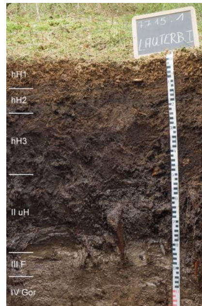
Hochmoor über Übergangsmoorortorf auf Mude und pleistozäner Buntsandstein-Fließerde auf anstehendem Buntsandstein – Hangmoor unterhalb des Mooswaldkopfs bei Lauterbach-Fohrenbühl (Begleitboden in b51)

Moore sind im bodenkundlichen Sinne Böden aus Torf mit einer Mächtigkeit von über 30 cm. Der Torf besitzt einen Gehalt an organischer Substanz von über 30 Masse-%. Naturgemäß bilden sich Moore durch den unvollständigen Abbau von Pflanzenresten an Standorten mit Wasserüberschuss. Der Nordschwarzwald mit seinen niederschlagsreichen, kühlen Hochlagen bildet daher insgesamt günstige Voraussetzungen für das Moorwachstum. Die Bodenlandschaft der Moore nimmt im Buntsandstein-Schwarzwald eine Fläche von 6,7 km 2 ein. Die meisten Moore sind als Versumpfungsmoore in Mulden und auf Hochflächen, häufig im Bereich von Wasserscheiden entstanden. Hinzu kommen die Hang- und Quellmoore in Hanglage unterhalb von Quellaustritten sowie die aus ehemaligen Karseen entstandenen Verlandungsmoore. In der Bodenkarte wurden diese Niedermoores mit stark schwankender Torfmächtigkeit in Kartiereinheit b51 zusammengefasst. In einigen Bereichen der regenreichen Hochlagen ist über dem Niedermoor oder direkt auf den nassen Hochflächen ein Hochmoor aufgewachsen, dessen Torfkörper hauptsächlich aus mehr oder weniger stark zersetztem Torfmoos besteht ( b200 ). Da der Niedermoorortorf vom Grundwasser gespeist wird oder Anschluss an den Mineralboden hat, besitzt er einen geringen Nährstoffgehalt. Die nur vom Regenwasser gespeisten Hochmoore sind dagegen äußerst nährstoffarm.