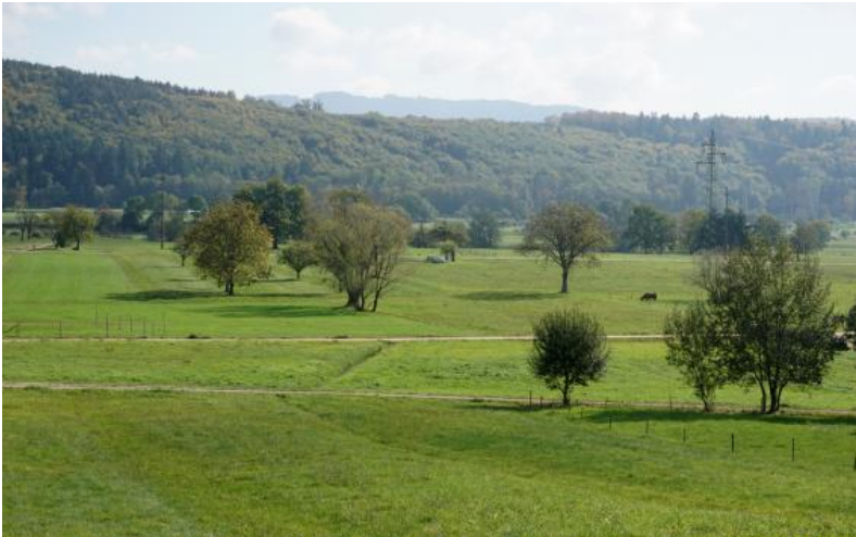
Blick über das Wiesental unterhalb von Hausen i. W. zum Nordostrand des Dinkelbergs und zum Hotzenwald – Vorne Grünland auf Grundwasserböden auf der kolluvial überdeckten Niederterrasse (Gley-Kolluvium bis Gley, b122 , b123 )

Am Ostrand des Weitenauer Berglands ist im Wiesental bei Hausen eine ca. 500 m breite Niederterrasse ausgebildet. Die Terrassensedimente sind großflächig von schluffig-lehmigen holozänen Abschwemmmassen überdeckt. Vorherrschende Böden sind Gley-Kolluvien und Kolluvien ( b122 ). In einigen Bereichen ließen sich auch noch stärker vom Grundwasser beeinflusste Böden auskartieren (Kolluvium-Gley und Gley, b123 ). Im südlichen Abschnitt der Terrasse, bei Schopfheim-Fahrnau, wurden die Böden durch die Anlage eines Golfplatzes verändert ( b122a , b123a ).