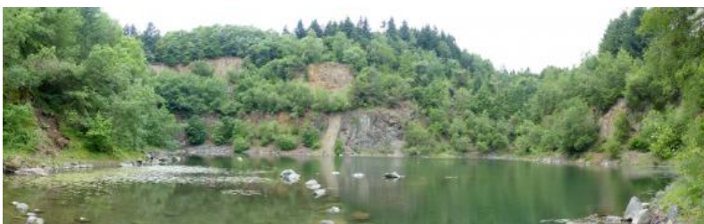
Aufgelassener Steinbruch am Michelsberg am Südosthang des Katzenbuckels

Nach neueren radioisotopischen Datierungen haben die Vulkanite in dem über 900 m breiten Vulkanschlot des Katzenbuckels bei Waldbrunn ein kreidezeitliches Alter. Es handelt sich um subvulkanisch entstandene ultrabasische Magmatite und Tuffbrekzien (Katzenbuckel-Magmatite, Ultrabasit, Shonkinit). Sedimenteinschlüsse von Gestein aus dem unteren Mitteljura lassen am Ende der Kreidezeit auf eine noch ca. 600 m mächtige Deckgebirgsüberdeckung zur Zeit der Eruption schließen, die im Laufe des Tertiärs größtenteils abgetragen wurde.