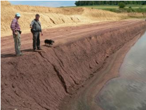
Lösslehm über Röttonen - Ziegeleigrube nordöstlich von Walldürn

Wo die Mittellagen mächtig werden, keine Beimengung von Buntsandsteinmaterial mehr aufweisen und somit keinerlei Hinweise auf solifluidale Umlagerung zeigen, sind sie nicht mehr von in situ verwittertem Löss zu unterscheiden und wurden bei der Kartierung somit als Lösslehm angesprochen. Großflächig sind Lösslehmdecken am Ostrand des Hinteren Odenwalds, im Main-Tauber-Gebiet und im Kleinen Odenwald verbreitet. Bei dem karbonatfreien Substrat handelt es sich im Hinteren Odenwald überwiegend um durchverwitterten Würmlöss, der eine deutliche Lokalkomponente enthält und oft durch Staunässe stark überprägt ist (Wittmann, 2000, S. 132 ff.). Bei mächtigen Lösslehmen in den tieferen Lagen des Kleinen Odenwalds und im Neckartal spielen sicher auch präwürmzeitliche Ablagerungen eine Rolle. Ab ca. 1,5–2 dm u. Fl. wurde dort örtlich in Hangfußlagen kalkhaltiger Schwemmlöss erbohrt. Bei Wiesenbach, am Südrand des