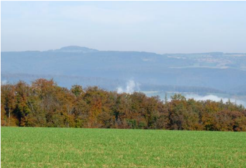
Über die Neckartalschlingen zwischen Mosbach und Neckargerach hinweg geht der Blick zum Buntsandstein-Odenwald, der im Hintergrund links vom Vulkanberg Katzenbuckel überragt wird.

Durch den Hinteren Odenwald verläuft eine Wasserscheide, von der einerseits über Erfa und Mud zum Main und auf der anderen Seite über die Elz zum Neckar entwässert wird. Ein kleines Gebiet bei Bödigheim ist über die Seckach an die Jagst angeschlossen.