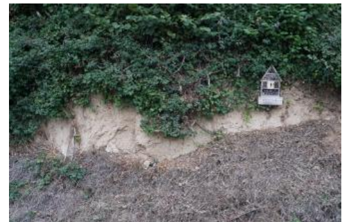
Lössaufschluss in den Weinbergen an der Bergstraße südlich von Heidelberg

Auf Terrassen und in alten Flussschlingen im Neckartal sowie besonders im Übergangsbereich zum Kraichgau und zum Oberrheingraben, wo in trocken-kalten Phasen der Würmkaltzeit große Mengen an Löss sedimentiert wurden, gehen die Decken aus Lösslehm und lösslehmreichen Fließerden häufig in Löss über. Wo dieser mächtig genug ist, dass er im Holozän nicht vollständig entkalkt und durch die Bodenbildung überprägt wurde, bildet der kalkhaltige schluffreiche Rohlöss den C-Horizont der dort verbreiteten Böden. Auf der sog. Gaisberg-Scholle zwischen Heidelberg und Nußloch (südliche Bergstraße) sind der Löss bzw. dessen Umlagerungsprodukte viele Meter mächtig und überlagern blockreiche Schuttmassen aus Buntsandstein-Material (Eichler, 1974; Zöller, 1996). Zum Teil sind Paläoböden aus verschiedenen Warmzeiten in die Deckschichten eingeschaltet.