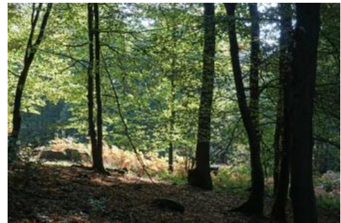
Laubwald auf einer Hangverflachung im Mittleren Buntsandstein südöstlich von Eberbach

Unter den gegebenen klimatischen und bodenkundlichen Bedingungen wären im Odenwald natürlicherweise fast überall Laubwälder mit Dominanz der Buche vorhanden (Knapp, 1963). Durch das Eingreifen des Menschen, v. a. seit dem Mittelalter, hat sich das Landschaftsbild jedoch stark gewandelt. Auch heute ist das Mittelgebirge zum größten Teil bewaldet. Es überwiegen Mischwälder, die oft einen hohen Nadelholzanteil (Fichte, Kiefer) aufweisen, der mit Aufforstungen seit dem 19. Jh. eingebracht wurde. Eine weite Verbreitung von Nadelwäldern zeigt die Landnutzungskarte v. a. in den höheren Lagen des Hinteren Odenwalds zwischen Waldbrunn und Mudau.