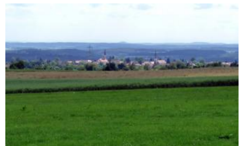
Landschaft im Kleinen Odenwald bei Neunkirchen

Im Bereich der hügeligen Buntsandsteinflächen südlich des Neckartals erstreckt sich der Kleine Odenwald . Dieses in Teilen schon mit Löss bedeckte Gebiet leitet zum südlich angrenzenden Kraichgau über. Bei Wiesenbach, am Südrand des Kleinen Odenwalds, befindet sich unter den Löss- und Lösslehmdecken z. T. bereits Unterer Muschelkalk. Zur Abgrenzung vom Kraichgau wurde dort das Ost–West-verlaufende Biddersbachtal herangezogen. Im Nordwesten ist der Kleine Odenwald am stärksten herausgehoben, dort erhebt sich über Heidelberg der Aussichtsberg Königstuhl mit 568 m ü. NHN. Ansonsten liegen die meisten Erhebungen im Norden des Kleinen Odenwalds zwischen 300 und 500 m ü. NHN und im Grenzbereich zum Kraichgau nur noch bei 200–300 m ü. NHN. Am südlichsten Abschnitt der Bergstraße zwischen Nußloch und Heidelberg fällt der Kleine Odenwald entlang tektonischer Bruchlinien nach Westen zur Oberrheinebene ab. Auf den morphologisch deutlich in Erscheinung tretenden Bruchschollen ist dort z. T. Muschelkalk erhalten, der aber meist von Löss oder Schuttdecken aus Buntsandsteinmaterial überdeckt ist. Die Elsenz mit ihren Nebenbächen sowie weitere kleine Bäche entwässern den Kleinen Odenwald zum Neckar hin. Kleinere Gerinne an der Bergstraße sind direkt zur Oberrheinebene bzw. zum Leimbach gerichtet.