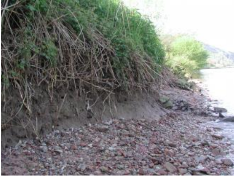
Auensehle über Kies am Neckarufer bei Eberbach

Von Fließgewässern weiter transportiertes Bodenmaterial wurde bei Überschwemmungen, die auch heute noch regelmäßig auftreten, in den Talsohlen als Auensehle oder Auensand wieder abgelagert. Bei größeren, katastrophentypischen Hochwässern, wie etwa beim Jahrhunderthochwasser 1993, sind immer wieder auch Schäden in den in der Neckarauen gelegenen Siedlungsbereichen zu verzeichnen (Röckel, 1995). Die Substratzusammensetzung der Auensedimente hängt stark vom Einzugsgebiet ab. Während die Odenwaldbäche karbonatfreie Sedimente abgelagerten, haben die größeren Gewässer (Neckar, Main, Tauber, Elsenz) karbonathaltiges Substrat in das Gebiet eingebracht.