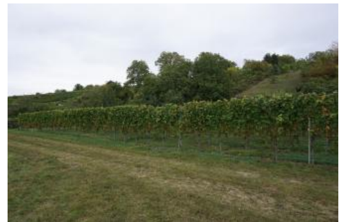
Hangfuß an der Bergstraße nördlich von Leimen mit Kolluvien aus holozänen Abschwemmassen

Die jahrhundertelange landwirtschaftliche Nutzung im Bereich der Rodungsinseln im Hinteren und Kleinen Odenwald sowie an der Bergstraße hat zu einer teilweisen Erosion der ursprünglichen Böden geführt. Das Abtragungsprodukt, die lehmigen, oft schluffreichen, mehr oder weniger stark Buntsandsteinmaterial führenden holozänen Abschwemmassen haben sich im Laufe der Zeit in Talmulden und am Hangfuß angesammelt. Ihre Verbreitung und Mächtigkeit nimmt an den Rändern der Bodengroßlandschaft zu, da dort die Landnutzungsgeschichte am weitesten zurückreicht und die erosionsanfälligen Lösssedimente die größte Verbreitung haben.