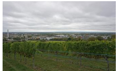
Blick von der Bergstraße bei Heidelberg-Emmertsgrund nach Westen in die Oberrheinebene zwischen Sandhausen und Eppelheim

Politisch gehört der größte Teil des baden-württembergischen Zentralen Sandstein-Odenwalds und des Kleinen Odenwalds zum Rhein-Neckar-Kreis und zum Stadtkreis Heidelberg. Der Hintere Odenwald befindet sich hauptsächlich im Neckar-Odenwald-Kreis und das zum Sandstein-Spessart gehörende Gebiet im Nordosten liegt im Main-Tauber-Kreis. Die relativ dünn besiedelte Region gehört überwiegend zum ländlichen Raum. Lediglich im Westen grenzt sie an den sich nach Osten bis Neckargemünd erstreckenden Verdichtungsraum Rhein-Neckar mit dem Oberzentrum Heidelberg und der dicht besiedelten südlichen Bergstraße. Neckaraufwärts folgt das Mittelzentrum Eberbach. Die anderen Mittelzentren Mosbach, Buchen und Wertheim liegen alle am Rand der Bodengroßlandschaft.