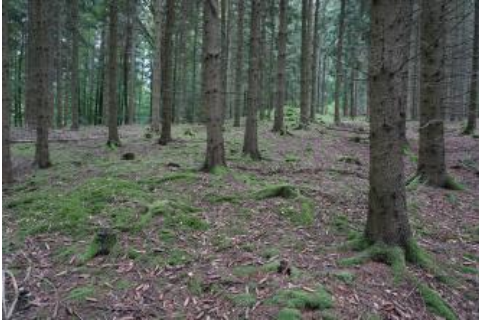
Alte Steinriegel im Wald, im Bereich von einer von Rotliegend-Sedimenten gebildeten Hangverflachung bei Heiligkreuzsteinach

Deutliche Auswirkungen auf die Böden hatten die in historischer Zeit vielfältigen Nutzungen der Wälder etwa durch Streuentnahme, Waldweide und die im Odenwald früher übliche Hackwaldwirtschaft, bei der die Flächen, insbesondere auch die Hanglagen, im Wechsel als Niederwald und Acker genutzt wurden (Hausrath, 1903; Staatl. Forstamt Eberbach, 1999; Tichy 1958). Besonders im Raum Eberbach wurden die Niederwälder vielfach als Eichenschälwälder genutzt. Darüber hinaus führten auch Kahlschläge aufgrund des hohen Bedarfs an Bau- und Brennholz (u. a. für Bergbau, Köhlerei und Glashütten) zu Erosion, Umlagerungsbildungen und Nährstoffentzug. Erst seit der Einführung einer geregelten Forstwirtschaft im 19. Jh. erfolgten Wiederaufforstungen und ein schonenderer Umgang mit den Waldflächen. Nördlich von Waldbrunn wurden in jener Zeit, nicht zuletzt wegen der schlechten Böden, die zwei kleinen Weiler Ober- und