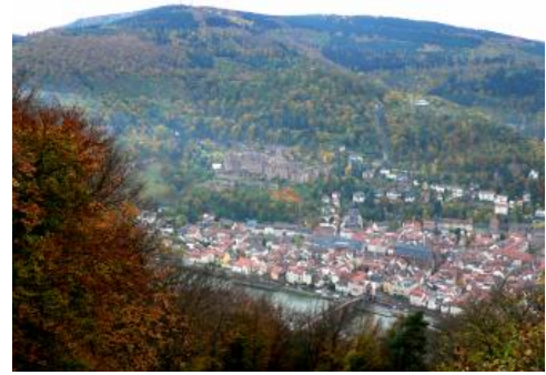
Neckartal bei Heidelberg

Die zentrale Entwässerungsader im südlichen Odenwald ist das schmale Neckartal zwischen Neckargerach und Heidelberg, in das sich auch die Verkehrswege und zahlreiche Siedlungen drängen. Die Unterhänge zwischen Heidelberg und Ziegelhausen, an denen der Heidelberg-Granit zutage tritt, werden bereits der Bodengroßlandschaft Grundgebirgs-Odenwald (Vorderer Odenwald) zugerechnet. Bei Heidelberg und Eberbach schließt sich nördlich ans Neckartal eine zertalte Berglandschaft mit steilen Hängen und schmalen 400 bis über 550 m ü. NHN hohen Bergrücken aus Gesteinen des Unteren und Mittleren Buntsandsteins an, die zum Zentralen Sandstein-Odenwald gehört, der auch als Mittlerer Odenwald bezeichnet wird. Die größten nördlichen Zuflüsse des Neckars sind dort die Itter, der aus dem Zusammenfluss von Ulfenbach und Finkenbach gebildete Laxbach sowie die Steinach. Zwischen Eberbach-Pleutersbach und Neckargemünd bildet der Neckar die Grenze zu Hessen. Nur im Norden, bei Mudau-Waldleiningen wird das Gebiet zum Main hin entwässert.