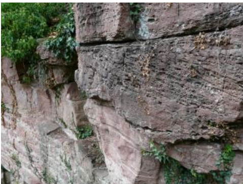
Mittlerer Buntsandstein im Ringgraben der Burg Wertheim

Der Mittlere Buntsandstein lässt sich im Main-Tauber-Gebiet und im Odenwald ungefähr nördlich von Mudau in Volpriehausen-, Detfurth-, Hardeggen- und Solling-Formation gliedern. Es handelt sich dabei um wiederholte Abfolgen von Grobsandsteinen mit örtlich wechselnder Geröllführung und Wechselfolgen aus Sandsteinbänken und Schluff-/Tonstein-Zwischenlagen. Im oberen Bereich tritt der meist kieselig gebundene, mittel- bis grobkörnige wechselnd geröllführende Felsandstein auf, der unter der Traufkante der Buntsandstein-Schichtstufe Felswände und Blockhalden bildet.