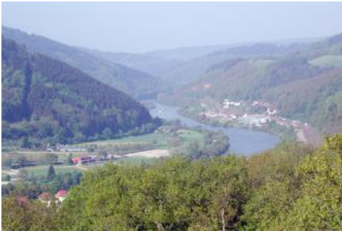
Neckartal unterhalb von Eberbach

Ausgehend von einer alttertiären Flachlandschaft erhielt das Gebiet mit dem fortschreitenden Einsinken des Oberrheingrabens und der kräftigen Heraushebung der Grabenränder im Pliozän allmählich seine heutige Gestalt. Neckar und Main, die im Untermiozän noch relativ kleine Rheinnebenflüsse waren, mussten sich in das aufsteigende Gebirge einschneiden. Dies gelang ihnen v. a. deshalb, weil sie durch rückschreitende Erosion im Laufe des Jungtertiärs große Teile des Donau-Flusssysteme anzapfen und umlenken konnten, wodurch sich die Abflussmenge stark erhöhte (Villinger, 1998; Simon, 2010; Eberle et al., 2017). Am Ende des Tertiärs waren die Lage der Muschelkalk-Schichtstufe am Rand des Odenwalds und der Verlauf der Durchbruchstäler von Neckar und Main weitgehend festgelegt.