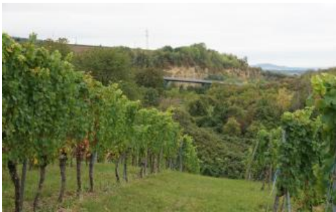
Ehemaliger Muschelkalksteinbruch an der südlichen Bergstraße bei Leimen

Kleine Vorkommen von Karbonat- und Mergelgestein des Unteren Muschelkalks entlang einer Störungslinie südlich von Wertheim-Nassig sowie örtlich am Südrand des Kleinen Odenwalds bei Wiesenbach wurden der BGL Buntsandstein-Odenwald und Spessart zugeordnet. An der Bergstraße südöstlich von Heidelberg-Rohrbach macht sich der Untere und Mittlere Muschelkalk durch Erdfälle und Dolinen bemerkbar (Engesser & Leiber, 1991). Als Ausgangsmaterial für die Bodenbildung tritt der Muschelkalk aufgrund der Lössbedeckung dort nur an wenigen Stellen in Erscheinung.