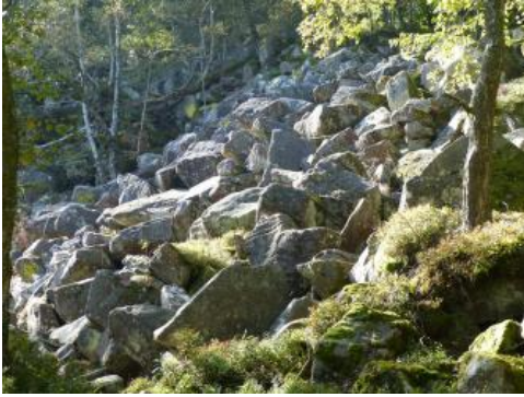
Blockstrom („Felsenmeer“) auf der Nordseite des Königstuhls bei Heidelberg

Eine weitere Periglazialbildung sind die für den Odenwald typischen, z. B. am Königstuhl auftretenden Blockströme („Felsenmeere“) (Geiger, 1973; 1974; Graul, 1977). Es handelt sich dabei um hangabwärts gerichtete längliche Ansammlungen von grobem Gesteinsschutt, an dessen Bildung verschiedene Prozesse im periglazialen Milieu beteiligt waren. Der durch Frostsprengung und gravitative Massenverlagerung entstandene Blockschutt, meist aus verkieseltem Sandstein der Geröllsandstein-Subformation, wurde durch Solifluktion hangabwärts verlagert. Zwischen den Blöcken vorhandenes Feinmaterial wurde ausgespült. Nach Geiger (1974) haben sich die Blockströme im Odenwald bevorzugt an nord- bis nordostexponierten Steilhängen gebildet. Im Gegensatz zu den Blockströmen versteht man heute unter „Blockmeeren“ Residualansammlungen von Gesteinsblöcken, die keine wesentliche Eigenbewegung aufweisen