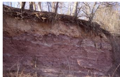
Lösslehmreiche Fließerde auf Tonstein der Röttone-Formation bei Werbach-Gamburg

Zwischen Deck- und Basislage ist als weiteres Deckschichtenglied örtlich eine Mittellage ausgebildet, die neben aufgearbeitetem Liegendmaterial einen deutlichen Lösslehmgehalt besitzt. Ihr Auftreten ist an Reliefpositionen gebunden, in denen sich während der pleistozänen Kaltzeiten Löss ablagern und erhalten konnte. Dies sind vor allem die ostexponierten Hänge und flachen Plateaulagen sowie die Unterhanglagen der Täler. Großflächig ist sie im Übergangsgebiet zu den Lösslehmgebieten des Bau- und Tauberlands sowie zur Lösslandschaft des Kraichgaus ausgebildet. In der Bodenlandschaft der Rücken und Hochflächen sind Mittellagen auf 45 % der Fläche verbreitet. Die Mittellage ist wenige dm bis über 1 m mächtig. Es kann sich um sandige bis schwach tonige Lehme handeln, in denen der Lösslehmgehalt nur schwer erkennbar ist, bis hin zu Schluff/Ton-Gemischen, die nur wenig Sand und Sandsteinskelett enthalten. Wo die lösslehmreichen Fließerden (Deck- und Mittellage) über sandig-steinigem Untergrund lagern, hat eine deutlich stärkere Vermischung mit dem Untergrund stattgefunden als über Verwitterungston der Röttone-Formation (Szabados, 1976).