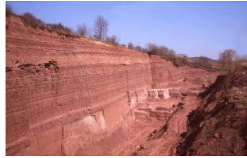
Steinbruch im Oberen Buntsandstein östlich von Wertheim-Dietenhan