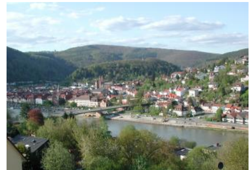
Neckartal bei Eberbach mit dem Umlaufberg einer ehemaligen Flussschlinge in der Bildmitte

Zeugnisse der sich auch im älteren und mittleren Pleistozän fortsetzenden Hebung und Einschneidung sind verlassene Flussschlingen und Terrassen über dem heutigen Niveau der Neckaraue. Die höchsten, vermutlich pliozänen bis frühpleistozänen Terrassen und Schlingen befinden sich zwischen 70 und 160 m über dem heutigen Neckarspiegel (Schweizer, 1982). Dazu gehören beispielsweise die Schlinge am Schollerbuckel bei Eberbach-Rockenau oder die Schlinge bei Neckargerach-Guttenbach. Die tiefer gelegenen Schlingen bei Eberbach sowie die Schlinge am Hollmuth bei Neckargemünd, deren westlicher Lauf heute von der Elsenz durchflossen wird, hat der Neckar im Mittleren Pleistozän verlassen. Südlich der tektonischen Hochscholle des Hollmuths erstreckte sich die Neckarschlinge infolge der anhaltenden Hebung des Odenwalds zeitweise sehr weit nach Süden bis nach Mauer (Bodengroßlandschaft Kraichgau), wo in warmzeitlichen Flussablagerungen der berühmte, ca. 600 000 Jahre alte Unterkiefer des Homo heidelbergensis gefunden wurde (Eitel & Wagner, 2007).