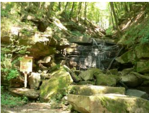
Margaretenschlucht südlich von Neckargerach

Mit dem Neckar schnitten sich auch die Zuflüsse in das aufsteigende Gebirge ein. Die zugehörigen Täler besitzen einen engen Talquerschnitt und steile Hänge. Ihre vorherrschende Nord-Süd-Richtung ist auf parallel zum Rheingraben streichende tektonische Störungen zurückzuführen. Bei näherer Betrachtung sind die steilen Hänge im Zentralen Sandstein-Odenwald oft nicht gestreckt, sondern in Abhängigkeit der Widerständigkeit der ausstreichenden Sandsteinschichten durch kleine Hangstufen gegliedert (Geiger, 1973). Stellenweise, wie an der Wolfsschlucht bei Zwingenberg oder in der Margaretenschlucht bei Neckargerach, gehen flache Hängetäler in steile Schluchten über, aus denen die Bäche direkt in den Neckar münden.