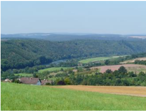
Maintal bei Wertheim-Urphar

Politisch gehört der größte Teil des baden-württembergischen Zentralen Sandstein-Odenwalds und des Kleinen Odenwalds zum Rhein-Neckar-Kreis und zum Stadtkreis Heidelberg. Der Hintere Odenwald befindet sich hauptsächlich im Neckar-Odenwald-Kreis und das zum Sandstein-Spessart gehörende Gebiet im Nordosten liegt im Main-Tauber-Kreis. Die relativ dünn besiedelte Region gehört überwiegend zum ländlichen Raum. Lediglich im Westen grenzt sie an den sich nach Osten bis Neckargemünd erstreckenden Verdichtungsraum Rhein-Neckar mit dem Oberzentrum Heidelberg und der dicht besiedelten südlichen Bergstraße. Neckaraufwärts folgt das Mittelzentrum Eberbach. Die anderen Mittelzentren Mosbach, Buchen und Wertheim liegen alle am Rand der Bodengroßlandschaft.