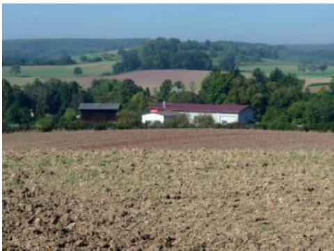
Wechsel der Bodenfarbe im Übergang vom Odenwald zum Bauland bei Buchen-Bödigeim

Die im Osten angrenzenden Hochflächen auf Oberem Buntsandstein werden als Hinterer Odenwald bezeichnet. Sie nehmen den größten Raum im baden-württembergischen Odenwald ein. Mit dem Einsetzen des Unteren Muschelkalks erfolgt der Übergang zur östlich angrenzenden Bodengroßlandschaft des Baulands. Nordöstlich von Mosbach verläuft diese Grenze ungefähr entlang des Elztals. Weiter nördlich sind an der Landschaftsgrenze die Städte Buchen, Waldürn, Hardheim und Kilsheim aufgereiht. Die Verflachungen und Talweitungen mit Quellaustritten im Übergang von den Röttonen (Oberer Buntsandstein) zum Unteren Muschelkalk boten sich dort in der Vergangenheit als günstiger Siedlungsraum an. Die Waldlandschaft des Hinteren Odenwalds ist von größeren Rodungsinseln durchsetzt, in denen u. a. die Gemeinden Mudau, Waldbrunn und Limbach liegen. Die Hochlagen am Westrand der