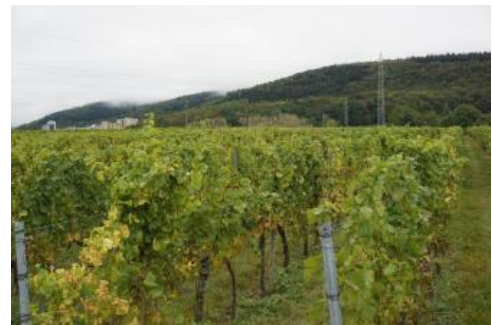
Blick über die weinbaulich genutzte, lössbedeckte Bruchscholle der südlichen Bergstraße nach Nordosten zum bewaldeten Odenwaldanstieg

Der früher ausgedehntere Weinbau beschränkt sich heute auf die klimatisch begünstigten Lagen an der Bergstraße südlich von Heidelberg und bei Leimen. Kleinfächig findet man auch noch im unteren Taubertal einzelne Rebhänge. Obstbau spielt nur vereinzelt im Main-Tauber-Gebiet oder im Süden des Kleinen Odenwalds eine Rolle.