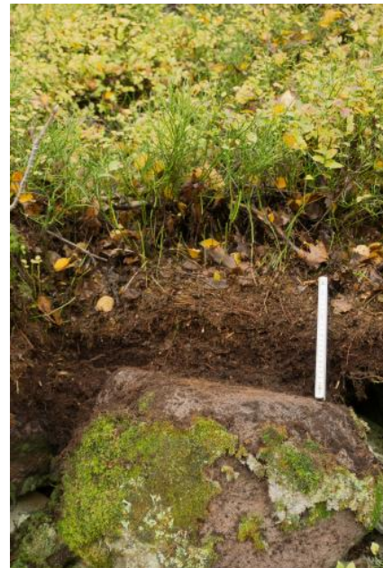
Skeletthumusboden aus Buntsandstein-Blockschutt (D2)

Die mancherorts, v. a. an den Steilhängen entlang des Neckartals auftretenden Blockströme („Felsenmeere“) aus Gesteinsblöcken des Mittleren Buntsandsteins wurden in der Bodenkarte in Kartiereinheit D2 zusammengefasst. Zwischen den eindrucksvollen Ansammlungen großer Felsblöcke findet sich oft kein mineralischer Feinboden, sondern nur schwarzer stark saurer Feinhumus (Skeletthumusböden). Weiteren Wurzelraum finden die Bäume z. T. in der unterlagernden feineren Hangschuttdecke. Begleitend treten in Bereichen mit lückenhafter Blockbedeckung A-C-Böden (Ranker, Regosole) und mehr oder weniger stark podsolierte Braunerden und Podsole auf. Im Neckartal und örtlich im Maintal und seinen Nebentälern kommen örtlich steile bis sehr steile Hangabschnitte mit Hangschuttdecken, örtlicher Blockschuttüberlagerung und Felsfreistellungen vor. Die Bodenbildung verlief an diesen Extremstandorten meist nur bis zum Ranker oder Regosol ( D1 ). Braunerden treten als Begleitböden auf.