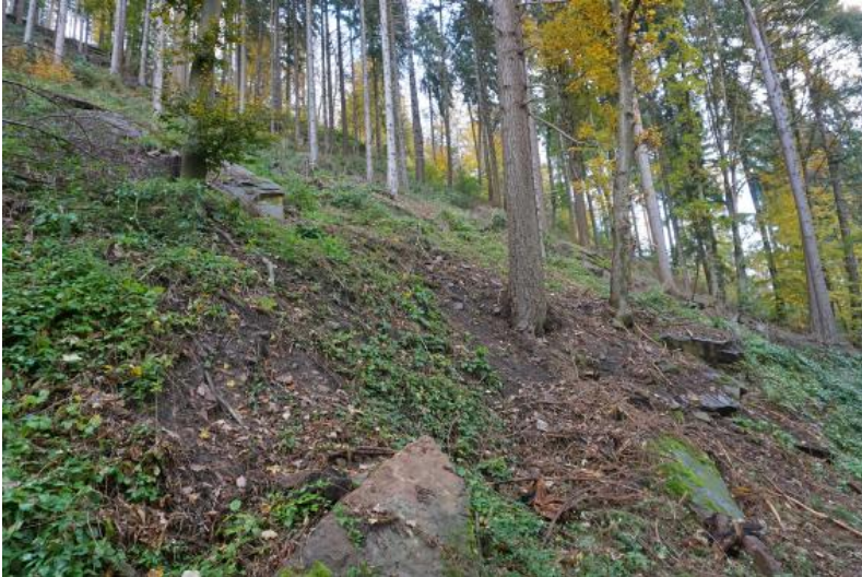
Mit Blockschutt bedeckter, sehr steiler Prallhang des Neckars am Gämsenberg zwischen Heidelberg-Schlierbach und Neckargemünd (D1)

Auf schmalen Hangrücken und in den Scheitelbereichen schmaler meist geneigter Bergsporne sind podsolige Braunerden und Podsol-Braunerden verbreitet, die meist nur flach bis mittel tief entwickelt sind ( D5 ). Die geringmächtigen Schuttdecken werden in 4–8 dm Tiefe bereits von anstehendem Sandstein unterlagert.