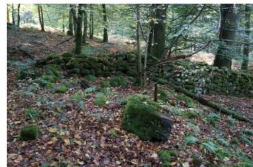
Bewaldete Hanglagen südöstlich von Eberbach mit Steinriegeln und Mauerresten, die auf eine frühere landwirtschaftliche Nutzung hinweisen

Die häufig an weniger steilen bewaldeten Hängen in Ortsnähe feststellbaren anthropogenen Bodenveränderungen konnten nicht im Einzelnen auskartiert werden. Häufig sind die in vielen Kartiereinheiten vorkommenden Oberbodenstörungen auf die historische Waldnutzung zurückzuführen (Nutzung als Hackwald, Waldweide, Streunutzung, Kahlschläge zur Nutz- und Brennholzgewinnung usw.). Sie äußern sich in podsolierten Böden, durch Bodenerosion verkürzte und an Nährstoffen verarmte Böden mit schlechten Humusformen, Humuseintrag in den Unterboden sowie in Kleinformen wie Ackerterrassen oder Reste alter Trockenmauern (z. B. Krappenäcker nordwestlich des Katzenbuckels). Auf Hangverflachungen, in Hangmulden und am Hangfuß können kleinflächig Kolluvien auftreten.