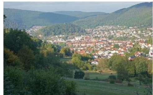
Das Neckartal bei Eberbach mit dem Umlaufberg einer ehemaligen Flusschlinge und dem dahinter einmündenden Ittertal

Im Zentralen Sandstein-Odenwald und entlang des Neckartals nehmen die meist bewaldeten Buntsandsteinhänge große Flächen ein. Der Hangschutt besteht dort überwiegend aus lehmig-sandigem, z. T. blockführendem Gesteinsschutt aus Material des Mittleren und örtlich des Unteren Buntsandsteins . Die obersten 2–7 dm sind oft etwas weniger stark steinig und lassen eine geringe äolische Beimengung erkennen (Decklage). Vorherrschende Böden sind Braunerden, die eine schwache Podsolierung erkennen lassen ( D58 , D101 , z. T. D7 ).