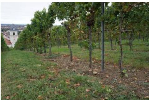
Weinbergsböden aus Muschelkalkmaterial am Südrand der Bergstraße bei Leimen

Die bis in den Mittleren Buntsandstein hinabreichenden Weinbergsböden (Rigosole) im Taubertal sowie örtlich im Maintal und seinen Nebentälern wurden als eigene Kartiereinheit abgegrenzt (D162). Durch die turnusmäßige tiefe Bodenbearbeitung (Rigolen) weisen sie deutliche Humusgehalte im Unterboden auf. Auch durch Terrassierung, Bodenauftrag usw. sind die sandig-lehmigen bis tonig-lehmigen, schwach bis mittel steinigen Böden stark anthropogen überprägt. Rigolte Böden aus eher lehmig-sandigem und steinigem Substrat sind am Umlaufberg Schollerbuck südöstlich von Eberbach verbreitet (D104). Die Weinbergsböden an der südlichen Bergstraße zwischen Heidelberg-Rohrbach und Leimen sind dagegen in mächtigen, überwiegend steinarmen lösslehmreichen Fließerden entwickelt (D49).