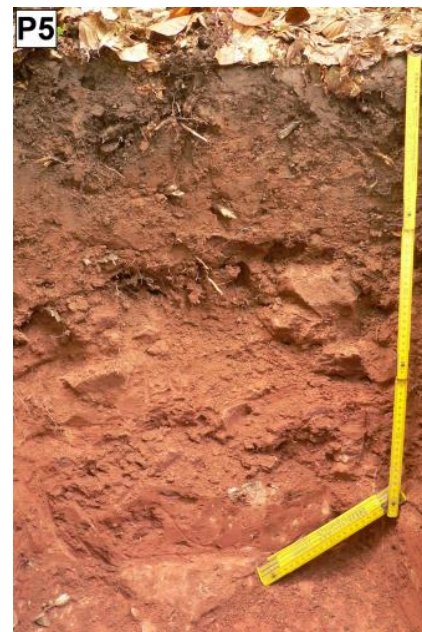
Braunerde aus Fließerden am Leichtersberg südlich von Schriesheim-Altenbach ( D21 )

An den Talhängen im Mittleren Buntsandstein nördlich von Mudau und Buchen besitzt die Decklage aufgrund äolischer Beimengungen ebenfalls hohe Schluffgehalte. Podsolige Böden treten dort nur untergeordnet auf (Braunerde, D141 ). Ähnliche Böden finden sich auch an stark geneigten bis steilen, z. T. bis in den Oberen Buntsandstein hinauf reichenden Hängen v. a. in Nord- und Ostexposition in Nebentälern des Neckars. Die Braunerden der dort kartierten KE D18 weisen ebenso wie die z. T. in Hanglage im Westen des Buntsandstein-Odenwalds verbreiteten Böden in KE D8 häufig bereits Übergänge zur Parabraunerde auf (lessivierte Braunerde und als Begleitboden Parabraunerde-Braunerde). Im Gegensatz zu den oben beschriebenen Böden ist auf diesen deutlich von Lösslehm beeinflussten Braunerden neben Moder auch die Humusform Mull verbreitet.