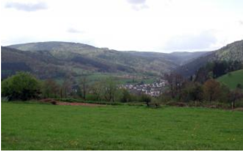
Blick über das Neckartal hinweg ins Pleutersbachtal

Die mancherorts, v. a. an den Steilhängen entlang des Neckartals auftretenden Blockströme („Felsenmeere“) aus Gesteinsblöcken des Mittleren Buntsandsteins wurden in der Bodenkarte in Kartiereinheit D2 zusammengefasst. Zwischen den eindrucksvollen Ansammlungen großer Felsblöcke findet sich oft kein mineralischer Feinboden, sondern nur schwarzer stark saurer Feinhumus (Skeletthumusböden). Weiteren Wurzelraum finden die Bäume z. T. in der unterlagernden feineren Hangschuttdecke. Begleitend treten in Bereichen mit lückenhafter Blockbedeckung A-C-Böden (Ranker, Regosole) und mehr oder weniger stark podsolierte Braunerden und Podsole auf. Im Neckartal und örtlich im Maintal und seinen Nebentälern kommen örtlich steile bis sehr steile Hangabschnitte mit Hangschuttdecken, örtlicher Blockschuttüberlagerung und Felsfreistellungen vor. Die Bodenbildung verlief an diesen Extremstandorten meist nur bis zum Ranker oder Regosol ( D1 ). Braunerden treten als Begleitböden auf.