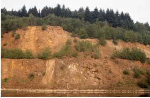
Aufgelassener Steinbruch am Michelsberg am Südosthang des Katzenbuckels

Über die Buntsandstein-Hochfläche bei Waldbrunn-Waldkatzenbach erhebt sich der aus basaltähnlichen Vulkaniten (Katzenbuckel-Magmatite, Ultrabazit, Shonkinit) aufgebaute Bergkegel des Katzenbuckels. In dem stark anthropogen überprägten Gipfelbereich sind lediglich sehr flach entwickelte Braunerden, Ranker und Felshumusböden auf Festgestein verbreitet ( D102 ). Die Böden auf den anschließenden mittel bis stark geneigten Hängen sind in lösslehmreichen Fließerden entwickelt, die von tonig-steinigen Fließerden aus Vulkanit-Verwitterungsmaterial unterlagert werden. Die ausgebildeten Braunerden ( D100 ) besitzen oft einen auffallend dunklen Unterboden, was nicht nur auf die Gesteinsfarbe, sondern auch auf einen geringen bis mittleren Humusgehalt zurückzuführen ist. Der Humus wurde in diesen nährstoffreichen, biologisch hoch aktiven