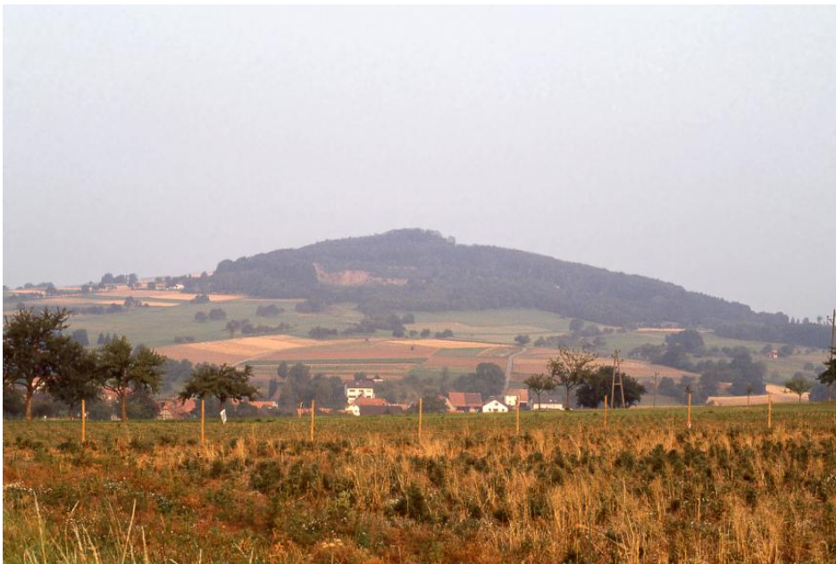
Blick über Waldkatzenbach nach Westen zum Katzenbuckel mit dem aufgelassenen Steinbruch