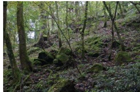
Felsen und Blöcke aus Katzenbuckel-Magmatit am Oberhang des Katzenbuckels

An den Hängen des Katzenbuckels muss davon ausgegangen werden, dass die Stein- und Blockbedeckung an der Oberfläche ursprünglich erheblich ausgeprägter war. Das Gesteinsmaterial war für die Bewohner von Waldkatzenbach früher eine zusätzliche Einnahmequelle. Es wurde eingesammelt, zerkleinert und fand u. a. beim zunehmenden Straßenbau am Ende des 19. Jh. Verwendung (Hasemann, 1930; Glaser, 2019). Am Katzenbuckel muss auch aufgrund ehemaliger, später wieder verfüllter kleiner Steinbrüche verbreitet mit gestörten Bodenverhältnissen gerechnet werden.