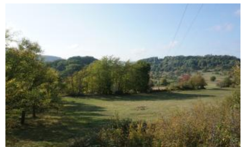
Blick von Osten auf den Schollerbuck (links), den Umlaufberg einer pleistozänen Neckarschlinge

In der über 150 m über dem Neckar gelegenen alten Flussschlinge am Schollerbuck bei Eberbach fanden sich Parabraunerden aus mehrschichtigen Fließerden, die einen geringen Anteil an Neckarkies aufweisen ( D117 ). Das Muldenzentrum, wo die Fließerden von sandig-lehmigen holozänen Abschwemmassen bedeckt sind, wird von Gley-Kolluvien eingenommen ( D158 ). Böden aus kiesführenden Fließerden finden sich auch im Bereich einer älteren Terrasse oberhalb des Ittertals bei Eberbach-Friedrichsdorf (Pseudogley-Parabraunerde, D115 ) sowie am Talausgang des Trienzbachs im Elztal bei Dallau. Dort sind sie geröllführend und lagern mit geringer Mächtigkeit über sandigem Geröll (pseudovergleyte Parabraunerde, D177 ). Auch bei Wiesenbach, am Südrand des Kleinen Odenwalds, treten kleinflächig Braunerden aus frühpleistozänen Neckarablagerungen auf ( D30 ).