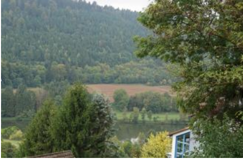
Neckartal bei Neckargerach mit lösslehmbedecktem Hangfuß, Niederterrasse und schmaler Aue

Bei Neckargerach und Zwingenberg sind auf schmalen Niederterrassenflächen sandig-tonige Hochflutsedimente verbreitet, die von einer geringmächtigen sandig-lehmigen Deckschicht überlagert werden. Die vorherrschenden tief entwickelten Parabraunerden ( D116 ) haben meist einen geringen bis mittleren Kiesgehalt und werden erst in 14–20 dm Tiefe von Terrassenkies unterlagert. Im Elztal und im Trienzbachtal nordöstlich und westlich von Limbach-Laudenberg fanden sich auf schmalen Terrassenflächen Pseudogleye aus lehmig steinigem Hochflutsediment über Buntsandsteinschutt ( D175 ). Punktuell treten dort vernässte Bereiche mit Quellengley und Anmoorgley auf.