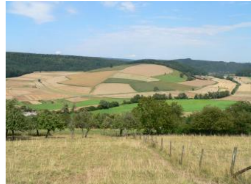
Ehemalige Neckarschlinge bei Neckargerach-Guttenbach

Braune Auenböden aus mächtigem sandig-lehmigem Auensediment, bei denen Vergleungsmerkmale erst unterhalb von 8–13 dm u. Fl. auftreten, fanden sich in den Talsohlen von Elz und Trienzbach ( D167 ) am Südostrand der Bodengroßlandschaft. In einzelnen kurzen Bachtälern oder an Bachoberläufen sind die Substrate der dort verbreiteten Braunen Auenböden deutlich sandig, z. T. auch nur geringmächtig und skeletthaltig ( D44 , D160 ).