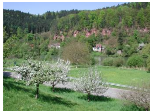
Neckartal zwischen Eberbach und Neckargemünd

Ein schmaler Talboden, der außerhalb der Siedlungen selten mehr als 100 m breit wird, begleitet das Odenwälder Neckartal zwischen Binau und Heidelberg-Schlierbach. Es sind vorherrschend kalkreiche Braune Auenböden verbreitet ( D43 ), die nur stellenweise Vergleichsmerkmale im tieferen Unterboden aufweisen. Es handelt sich um mächtigen, kiesfreien bis kiesarmen schluffigen bis sandigen Lehm, der in größerer Tiefe von sandigem Material unterlagert wird. Als Begleitböden können auf höher gelegenen Niveaus Braune Auenböden aus bereits entkalktem Auenlehm auftreten. An wenigen Stellen, bei Eberbach und Neckargemünd, hat auf ca. 1–4 m höher gelegenen Auenterrassen bereits eine deutliche terrestrische Bodenbildung eingesetzt. Vorherrschende Böden in der dort ausgewiesenen Kartiereinheit (KE) D46 sind Auenparabraunerden und lessivierte Braune Auenböden.