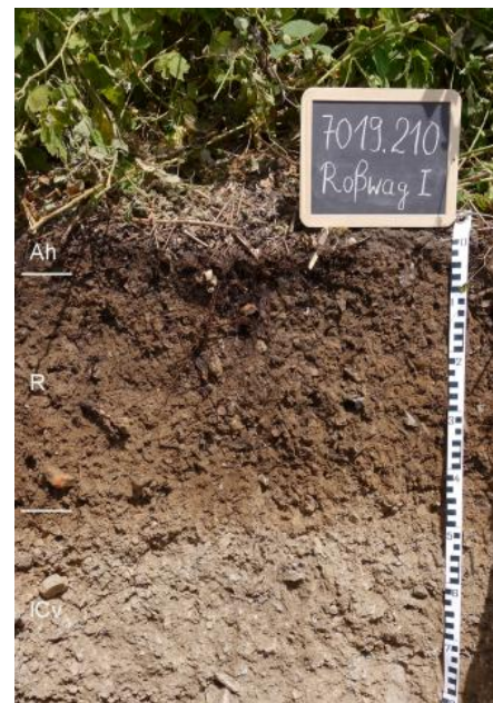
Mittel tiefer kalkreicher Rigosol aus Hangschutt aus Material des Oberen Muschelkalks

Die Rebhänge entlang der Muschelkalktäler stellen ein landschaftsprägendes Element des Neckarbeckens dar. Die ursprünglich vorhandenen Rendzinen wurden durch die Anlage von Kleinterrassen und den vor der Neupflanzung durchgeführten Umbruch (Rigolen) zu kalkhaltigen bis -reichen Rigosolen und Rendzina-Rigosolen umgeformt ( f69 ). Nicht mehr mit Reben bestockte, terrassierte und örtlich bereits wieder bewaldete Hänge wurden als Kartiereinheit f6b ausgewiesen. In einigen sehr steilen Prallhangbereichen des Neckar- und Enztals finden sich Felswände und -klippen, in den Hessigheimer Felsengärten auch frei stehende Felstürme. Auf dem Karbonatgestein sind stellenweise sehr flachgründige Rendzinen und Felshumusböden ausgebildet.