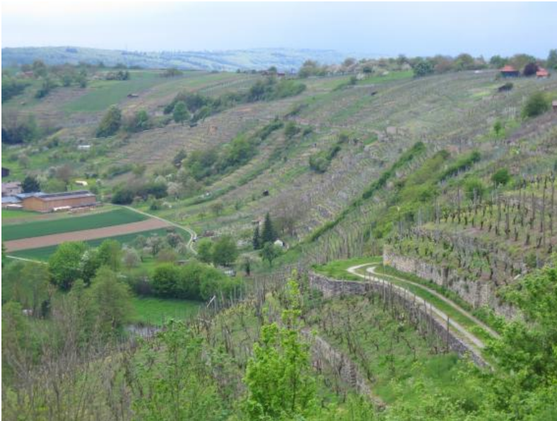
Rebhang mit Kleinterrassen bei Mühlhausen a. d. Enz