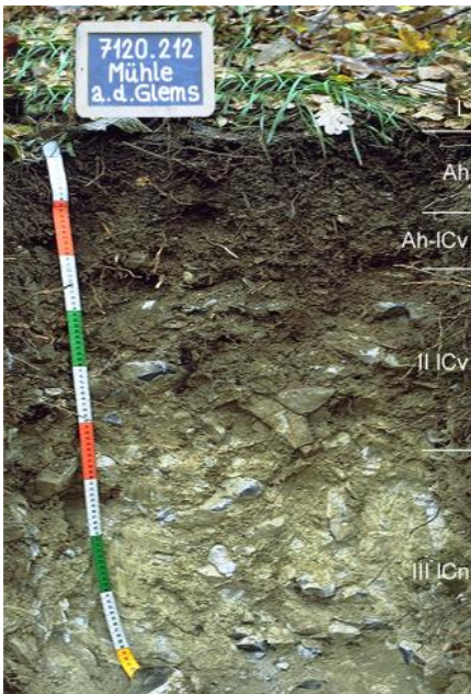
Braune Rendzina aus geringmächtiger lösshaltiger Fließerde über Hangschutt des Oberen Muschelkalk (f6)

An drei besonders steilen, westexponierten Hangabschnitten des Enztals zwischen Mühlacker und Roßwag findet sich eine Bodengesellschaft aus Syrosem und z. T. sehr flachgründigen Rendzinen (Kartiereinheit f1 ). Der Großteil der Hänge im Oberen Muschelkalk wird jedoch von weniger extremen, unter Wald nicht selten verbrauchten Rendzinen aus verbreitet tiefgründigem Hangschutt eingenommen ( f6 ). Nur in wenigen Abschnitten des Neckar-, Enz-, und Murrtals entwickelten sich Rendzina-Braunerden ( f20 ). Auf Hangspornen an den Talschultern und den anschließenden Rändern der Gäuflächen liegen dagegen Rendzinen aus geringmächtigen lösshaltigen Fließerden auf anstehendem Kalk- oder Dolomitstein vor ( f5 ).