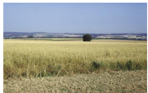
Getreideanbau auf Lössböden im Korngäu östlich von Eutingen im Gäu

Die Oberen Gäue erstrecken sich in Süd-Nord-Richtung vom jungen Neckar nördlich von Schwenningen bis an die Enz bei Mühlacker. An ihrem Südwestrand schließen sie sich zwischen Schramberg-Sulgen und Loßburg an die Schwarzwald-Ostabdachung an. Bei Freudenstadt ragt das Gäu aufgrund der tektonischen Absenkung der Muschelkalkschichten im Freudenstädter Graben weit nach Westen in den Schwarzwald hinein. Weiter nördlich bildet das Nagoldtal mit den Städten Nagold und Calw die Grenze zum Schwarzwald. An ihrem Ostrand, wo die Oberen Gäue vom Kleinen Heuberg, Rammert, Schönbuch und Glemswald begrenzt werden, befinden sich die Städte Rottweil, Rottenburg, Herrenberg, Böblingen, Sindelfingen und Leonberg. Die Bodengroßlandschaft (BGL) Obere Gäue nimmt große Teile der Landkreise Rottweil, Freudenstadt, Tübingen, Böblingen, Calw und des Enzkreises ein. Ein geringerer Flächenanteil entfällt auf den Schwarzwald-Baar-Kreis, den Zollernalbkreis und den Landkreis Ludwigsburg.