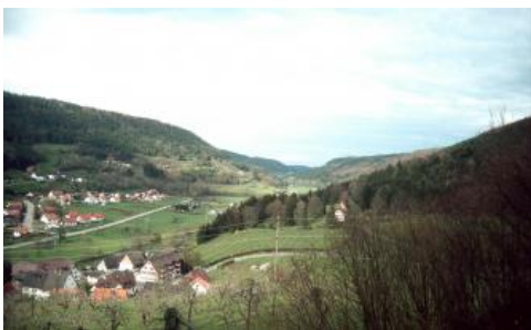
Blick nach Nordosten ins Glatttal bei Sulz-Hopfau

Das Dominieren flach entwickelter kalkhaltiger Böden und das häufige Fehlen der Decklage sind Hinweise auf Bodenerosion zu Zeiten früherer Entwaldung der Talhänge. So ist z. B. für die Gegend um Sulz am Neckar und Glatt belegt, dass dort vom Mittelalter bis in die Mitte des 17. Jahrhunderts Weinbau betrieben wurde (Königliches statistisch-topographisches Bureau, 1863, S. 110; Sebald, 1966, S. 34). Andererseits ist auffällig, dass viele nord- und ostexponierte Hänge vermutlich immer bewaldet waren. Die Hangschuttdecken sind dort weniger erodiert und besitzen noch eine geringmächtige lösslehmhaltige Deckschicht (Decklage, entspr. Hauptlage in Ad-hoc-AG Boden, 2005a, S. 180 f.). Vorherrschende Böden sind