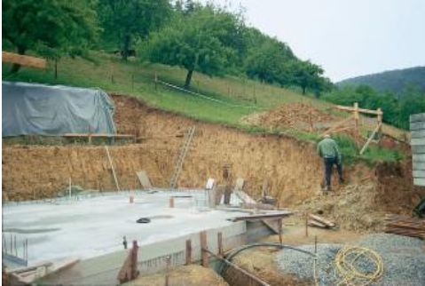
Baugrube an einem südost-exponierten Unterhang im Neckartal bei Horb-Dettingen

An weniger steilen Mittel- und Unterhängen, wie v. a. im Neckartal zwischen Horb-Mühlen und Rottenburg am Neckar treten immer wieder auch Pararendzinen aus feinerdreichem Hangschutt und Fließerden auf ( g14 ). Das Material besteht dort aus einem Gemisch aus Löss und Kalksteinschutt. In einigen Hangabschnitten der Täler und am Muschelkalk-Stufenrand tritt geringmächtiger Hangschutt v. a. aus Material des Mittleren und Unteren Muschelkalks und anstehender Dolomit- und Mergelstein bodenbildend in Erscheinung. Vorherrschende Böden sind Rendzinen ( g8 ). Auch an z. T. landwirtschaftlich genutzten, mittel bis stark geneigten Unterhängen und auf Hangverflachungen im Niveau des Unteren und Mittleren Muschelkalks geht der Steingehalt mancherorts zugunsten von lehmig-tonigem Feinmaterial zurück. Leitbodentyp ist auch dort eher die