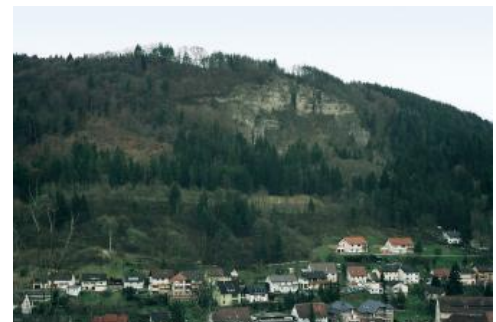
Blick über das obere Neckartal bei Oberndorf-Aistaig auf das ehem. Felssturzesgebiet am Bollersfels und die unterhalb angrenzenden Schutthalden mit Rohböden (Syroseme, Lockersyroseme) und sehr flach entwickelten Rendzinen (g7)

Die Böden der steilen Talhänge des Muschelkalkgebiets wurden hauptsächlich in Kartiereinheit (KE) g9 zusammengefasst. Es handelt sich dabei vorwiegend um flachgründige, steinige Böden (Rendzina) aus Kalkstein-Hangschutt. In den obersten Hangbereichen, wo der Hangschutt fehlt, sind sie auf anstehendem Karbonatgestein des Oberen Muschelkalks entwickelt. Wo noch Reste der feinerdereichen, kalkarmen bis kalkfreien Decklage vorhanden sind, gehören Braune Rendzinen und Braunerde-Rendzinen zur Bodengesellschaft dazu. Im Unterhangbereich sind vereinzelt Pararendzinen zu finden, die in Fließerden aus Material des Unteren und Mittleren Muschelkalks entwickelt sind. Rohböden (Syroseme) und sehr flach entwickelte Rendzinen treten gelegentlich im Bereich von Felsbildungen und Schutthalden an den Oberhängen auf. Wo diese, wie am oberen Neckar und im Eyachtal, größere Areale einnehmen, wurden sie in KE g7 zusammengefasst.