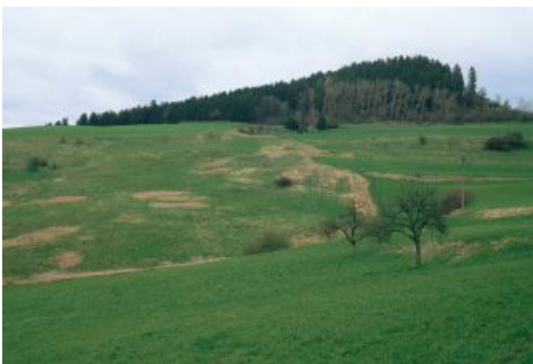
Ausgedehntes Kalktuffpolster an einem Hangabschnitt im Glatttal NO von Glatten-Neuneck im Übergang vom Unteren Muschelkalk zum Buntsandstein

Pararendzina ( g20 ). Wo der Hangschutt aus dem Oberen Muschelkalk so gut wie ganz aussetzt und an mittel bis stark geneigten Unterhängen das umgelagerte lehmig-tonige Verwitterungsmaterial des Unteren und Mittleren Muschelkalks für die Bodenbildung bestimmend ist, wurde in der Bodenkarte die KE g17 ausgewiesen. Es kommen dort Pararendzinen mit Übergängen zum Pelosol vor, wie sie in der Bodenlandschaft „Hügelland im Unteren und Mittleren Muschelkalk“ beschrieben werden.