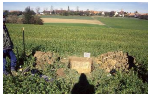
Profilgrube eines Pelosols auf einem Hügellücken im Lettenkeuper südlich von Horb-Nordstetten ( g24 )