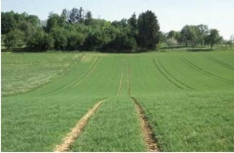
Muldentälchen im Korngau bei Magstadt

Im altbesiedelten Korngau haben sich durch die Bodenerosion im Laufe der Jahrhunderte große Mengen an Abschwemmmassen in den Talmulden angesammelt. Verbreitet treten tiefgründige Kolluvien auf ( g60 ). Es handelt sich dabei um die Böden mit der höchsten Bewertung hinsichtlich der Bodenfunktion „natürliche Bodenfruchtbarkeit“ im Lettenkeupergebiet. Da es sich überwiegend um abgeschwemmtes Oberbodenmaterial der ehemaligen Parabraunerden aus Löss handelt, sind es sehr schluffreiche Substrate. Die Kolluvien in KE g61 sind dagegen tendenziell etwas lehmiger bzw. tonreicher und etwas humoser. Sie sind eher im Süden, auf den Gäuflächen am oberen Neckar, verbreitet. Dort sind die Abschwemmmassen in Bereichen mit lückenhafter Lösslehmbedeckung meist auch weniger mächtig (ca. 6–