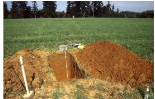
Tief entwickelte erodierte Terra fusca-Parabraunerde aus lösslehmreichen Fließerden über periglazial umgelagertem Höhenschotter-Verwitterungston

Böden auf pleistozänen Flussterrassen finden sich vor allem im Raum Rottweil. Zusammen mit den Talrichtungen und Talformen belegen sie dort eine komplizierte Flussgeschichte. Im Jungtertiär und noch im älteren Pleistozän wurde der äußerste Süden der Oberen Gäue und Teile des Mittleren Schwarzwalds von der Ur-Eschach durch das heutige Primtal über die Spaichinger Pforte zur Donau hin entwässert. Durch den von Norden her sich einschneidenden Neckar wurde dieses Flusssystem schließlich angezapft und umgelenkt. Es wird angenommen, dass die Anzapfung der Ur-Eschach durch den Neckar im Frühen Pleistozän stattgefunden hat (Münzing, 1974, S. 66; Rähle & Bibus, 1992; Stemmer, 1961; Wagner, 1961b). Die höchsten Schottervorkommen oberhalb 685 m ü. NHN werden für pleistozän umgelagerte pliozäne Höhenschotter gehalten (Keisenberg, 1975, S. 75 ff., Münzing in Schmidt, 1982, S. 118). Diese treten aber abgesehen von einem kleinflächigen Vorkommen nur als Streuschotter oder in Füllungen von Karstspalten auf. Periglaziale Umlagerung und Verstellung der Schotter durch Gipsauslaugung im Untergrund erschweren eine zeitliche Einordnung der in verschiedenen Höhenlagen verbreiteten Flussablagerungen.