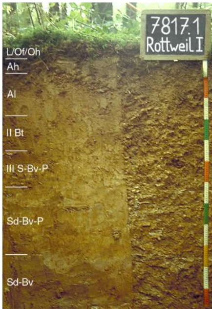
Tief entwickelte pseudovergleyte Pelosol-Parabraunerde aus kiesführenden, lösslehmreichen Fließberden (Deck- über Mittellage bis 4,5 dm u. Fl.) über verwitterten und umgelagerten, tonreichen pleistozänen Flussablagerungen