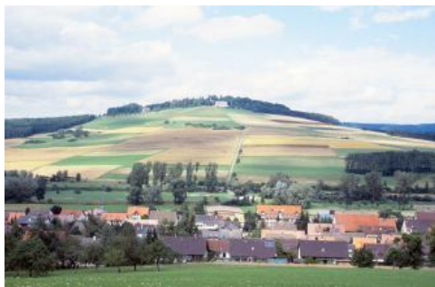
Blick nach Norden über Geisingen-Gutmadingen und das Donautal auf den Wartenberg

Auf dem Bohl südöstlich von Wutöschingen treten sehr kleinflächig Ablagerungen der Tertiärzeit auf. Es handelt sich um Mergel und Kalksteingerölle eines isoliert gelegenen Vorkommens der Jüngeren Juranagelfluh. In das Tertiär sind auch die Vulkanite des Wartenbergs bei Geisingen zu stellen. Sie gehören zu der nördlichsten Erscheinung des miozänen Hegau-Vulkanismus. Seine heutige kegelförmige Gestalt verdankt der größtenteils von morphologisch weichen Ton- und Mergelgesteinen des Mitteljuras aufgebaute Wartenberg der Abtragungsresistenz der im Gipfelbereich an die Oberfläche tretenden Basaltschlote. Krause & Weiskirchner (1981, S. 11) beschreiben den Wartenbergbasalt als Olivinnephelinit. An einzelnen Stellen treten lockere oder verfestigte Basalttuffe mit kalzitischem Bindemittel auf.