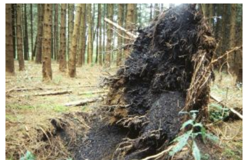
Windwurf im Bereich humoser Gleye aus tonreichen Altwassersedimenten (Sumpftorf) in der Umgebung des Schuraer Moores

Eine der Ursachen für die holozäne Moorbildung auf der Baar ist das danubische Relief mit seinen vor den Schichtstufen gelegenen gefällearmen Tälern und Niederungen, deren Untergrund von wasserundurchlässigem Ton gebildet wird. Hoher Grundwasserstand, Sackungerscheinungen durch Gipsauslaugung, mäandrierende Fließgewässer, Laufverlegungen und Verlandung von Altwässern sind als weitere Faktoren zu nennen. Das Zollhausried bei Blumberg und das Dürbheimer Ried liegen auf Talwasserscheiden, die in Folge von Flussanzapfungen im Pleistozän entstanden sind. Im Einzelnen sind bei jedem der von Göttlich (1968b, 1978) detailliert beschriebenen Moore etwas andere Entstehungsbedingungen gegeben. Auch die Mächtigkeit der Torfe schwankt sehr stark. An den tiefsten Stellen sind sie 4–5 m mächtig. Beim Zentralbereich des Schwenninger Moores handelte es sich ursprünglich um ein Hochmoor. Durch Abtorfungen zwischen 1748 und 1948 wurde das Hochmoorschild jedoch praktisch vollständig beseitigt. In seinem gegenwärtigen Zustand muss das Schwenninger Moos daher als Niedermoor eingestuft werden (Göttlich, 1978, S. 20). Als Hochmoor ist hingegen das nördlich von VS-Tannheim gelegene Plattenmoos zu bezeichnen. Der Hochmoortorf ist über einem Verlandungsmoor aufgewachsen, das sich in einer Senke im Übergang zwischen der nach Osten einfallenden Buntsandsteintafel und dem im Osten ansteigenden Unteren Muschelkalk gebildet hat.