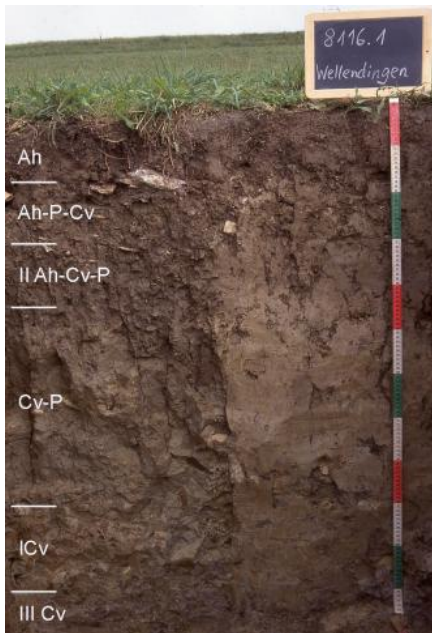
Pelosoil-Pararendzina aus tonigen Fließerden aus Material des Unteren Muschelkalks (h9)

Unter der Decklage folgt häufig eine aus liegendem oder hangaufwärts anstehendem Gesteinsmaterial bestehende, z. T. mehrschichtige Solifluktuationsdecke, die frei ist von äolischen Bestandteilen und als Basislage bezeichnet wird. Vor allem aus dem Verwitterungsmaterial der im Blattgebiet weit verbreiteten Ton- und Mergelsteine des Keupers, Unter- und Mitteljuras sind im Pleistozän durch kryogene Prozesse tonreiche Basislagen entstanden, deren Mächtigkeit stark vom Relief abhängt. Je nach ihrer Lage im Gelände enthalten sie einen mehr oder weniger hohen Anteil aus größeren Gesteinskomponenten, die den hangaufwärts anstehenden härteren Schichten entstammen. Zwischen Deck- und Basislage ist als weiteres Deckschichtenglied örtlich eine Mittellage ausgebildet, die neben aufgearbeitetem Liegendmaterial einen hohen Lösslehmgehalt besitzt. Ihr Auftreten ist an Reliefpositionen gebunden, in denen sich während der pleistozänen Kaltzeiten Löss ablagern und erhalten konnte. Dies sind vor allem die schwach nach Osten geneigten Stufenflächen im Unterkeuper und Unterjura, ostexponierte Flachhänge im Unterjura- und Opalinuston-Hügelland (Mitteljura) sowie die pleistozänen Schotterterrassen. Die Mittellagen stehen mit den geringmächtigen Lösslehmvorkommen in Verbindung und sind dort, wo sie wenig Material aus dem Liegenden enthalten, bei der Kartierung kaum von diesen zu unterscheiden.