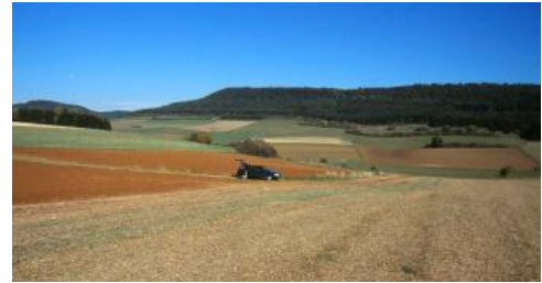
Rötliche Böden auf eisenreichen oolithischen Mergelkalcken der Oostreenkalk-Formation im Mitteljura südlich von Bad Dürkheim-Öfingen (h69, h55)

Auf der Baar bildet die über 100 m mächtige, einförmige Schichtenfolge aus dunklen Tonsteinen der Opalinuston-Formation (unterer Mitteljura) ein der Baar-Alb vorgelagertes, von Wald und Wiesen eingenommenes Hügelland. Über dem Opalinuston folgen an den Hängen im Anstieg zum Albrauf die etwa 100 bis 130 m mächtigen Gesteine des mittleren und höheren Mitteljuras. Es handelt sich um eine Abfolge von häufig feinsandigen Ton- und Tonmergelsteinen, die durch zahlreiche Lagen von härteren Kalkstein-, Sandstein- und Oolithbänken unterbrochen werden. Vor allem die eisenoolithischen Mergelkalke der Gosheim-Formation treten als Stufenbildner hervor. Sie bilden beispielsweise die Plateaus bei Bad Dürkheim-Öfingen sowie unterhalb des Lupfens und des Hohenkarpfens. Mächtiger Opalinuston findet sich auch im Süden des Gebietes auf dem zwischen unterem Wutachtal und Klettgauer Tal gelegenen Hallauer Rücken. Überlagert wird er dort z. T. noch von Kalksteinen der Achdorf-Formation. Auch auf dem westlichen Ausläufer des Kleinen Randen (Berchenwald) bei Küssaberg sind Mitteljuragesteine verbreitet. Im Gegensatz zur Baar sind die Mitteljurahänge im Klettgau und im Übergang zum Hochrheintal einer stärkeren Reliefenergie ausgesetzt. Das oft bucklige Oberflächenrelief und der Säbelwuchs der Bäume an den Opalinuston-Hängen weist auf deren Rutschungsneigung hin. Im Jahr 1983 lösten starke Regenfälle westlich von Erzingen eine Rutschung mit einer Ausdehnung von 3 ha aus (Bausch & Schober, 1997, S. 61).