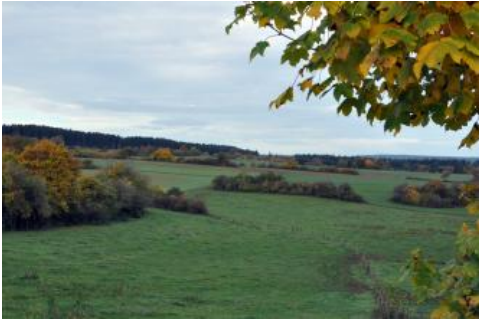
Muschelkalklandschaft südlich von Bräunlingen

In der Landnutzungskarte von Baden-Württemberg zeichnet sich die Baar und das Alb-Wutach-Gebiet deutlich als offene, überwiegend agrarisch genutzte Region ab, die im Westen vom Schwarzwald und im Osten von der dort größtenteils bewaldeten Baar-Alb begrenzt wird. Die Baar ist eine vielgestaltige, durch einen Wechsel von Äckern und Wiesen bestimmte Landschaft, die mit Waldinseln unterschiedlichster Größe durchsetzt ist. Auch im Alb-Wutach-Gebiet gibt es auf den meist schlechteren Böden der Muschelkalkhochflächen kleinere Wälder. Es sind dort v. a. aber auch die steilen Talhänge, die dem Wald überlassen sind. Während im Alb-Wutach-Gebiet auf den landwirtschaftlich genutzten Flächen der Ackerbau meist deutlich dominiert, gibt es nach den Daten des Statistischen Landesamts auf der Baar Gemeinden, in