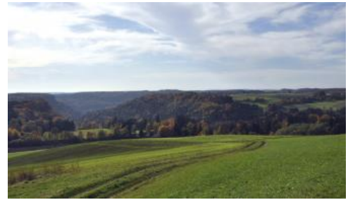
Blick vom Bühl bei Blumberg-Fützen nach Südwesten in die Wutachflühen

Am Ende der Würmkaltzeit kam es dann zum Überlaufen der Feldbergdonau in die Ur-Wutach, die ihr Tal damals durch rückschreitende Erosion vom Hochrhein bis in die Gegend bei Achdorf erweitert hatte. Die Folge dieser Anzapfung und Umlenkung war das Trockenfallen der Talpforte zwischen Eichberg und Buchberg bei Blumberg. Das breite, im Oberlauf vermoorte ehemalige Tal der Feldbergdonau zwischen Blumberg und Geisingen-Kirchen-Hausen wird heute nur noch von der kleinen Aitrach durchflossen. Die Wutach und ihre Nebenbäche haben sich in der Folgezeit in geologisch sehr kurzem Zeitraum als schmale Schluchten tief in die Landschaft eingeschnitten. Bei Achdorf beträgt der Eintiefungsbetrag ca. 170 m. Die Talhänge sind sehr steil und v. a. im Bereich der tonigen Keuper- und Mitteljuragesteine stark von jungen Massenverlagerungen überprägt. Südlich von Stühlingen-Grimmelshofen ist die Talsohle der Wutach breiter, wird aber immer noch von steilen Muschelkalkhängen begleitet. Erst unterhalb von Wutöschingen nehmen die Talflanken sanftere Formen an. Die Wutach schneidet dort den Keuper an und durchfließt eine Landschaft, die von der rißzeitlichen alpinen Vereisung und pleistozänen Schotterablagerungen überprägt wurde. Die eindrucksvolle Landschaftsgeschichte des Wutachgebiets wurde zuletzt von Simon (2014) beschrieben.