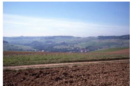
Steinatal bei Ühlingen-Birkendorf-Untermettingen

Neben Wutach und Alb mit ihren Nebenbächen sind es auch Schwarza, Schlücht und Steina sowie kleinere Nebenbäche des Rheins, die zur Zertalung der Landschaft beigetragen haben. Oft haben sie sich durch den geringmächtigen Buntsandstein schluchtartig bis in das Grundgebirge eingeschnitten. Die dort vorkommenden Böden werden in den Legenden der Bodengroßlandschaften Grundgebirgs-Schwarzwald bzw. Buntsandstein-Schwarzwald beschrieben. Das Alb-Wutach-Gebiet ist durch große Höhenunterschiede zwischen Norden und Süden gekennzeichnet. Bei Bonndorf liegen die Muschelkalkhöhen fast 900 m ü. NHN hoch. Die Muschelkalkhänge am Hochrhein bei Dogern reichen dagegen bis 330 m ü. NHN herunter.