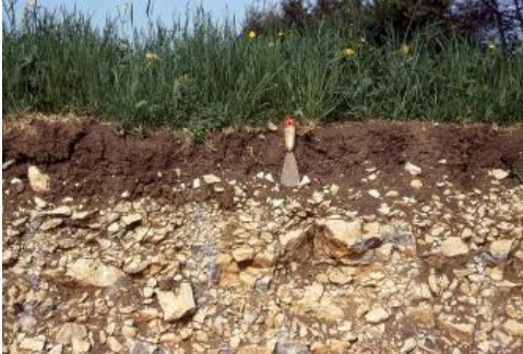
Flachgründiger Boden (Rendzina) auf Kalkstein des Oberen Muschelkalks

Auf den verbreitet vorkommenden Ton- und Mergelgesteinen (Unterer Muschelkalk, Keuper, Jura) schreitet die Verwitterung relativ rasch voran, sodass sich bereits im Pleistozän Decken aus tonigem Lockermaterial bilden konnten. Bei der sehr langsam ablaufenden Lösungsverwitterung auf den Karbonatgesteinen des Oberen Muschelkalks bleibt jedoch nur sehr wenig Feinmaterial zurück. Wo der meist gelblichbraune Rückstandston in größerer Mächtigkeit vorliegt, hat er sich vermutlich während mehrerer Warmzeiten im Pleistozän gebildet. In den Kaltzeiten überwog dagegen die Abtragung und Umlagerung. Die Folge ist, dass man den Rückstandston in nennenswerter Mächtigkeit heute nur noch in erosionsgeschützten Reliefpositionen und als ein von jüngeren Sedimenten überdecktes Umlagerungsprodukt in Mulden und Trockentälern findet. Daraus