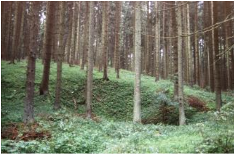
Doline im Oberen Muschelkalk nordwestlich von Donaueschingen

Im Westen der Baar bildet das Muschelkalkgebiet (Baar-Gäuplatten) den Anschluss an die nördlich angrenzenden Oberen Gäue. Südlich der Wutachschlucht setzt sich diese Landschaft bis zum Hochrhein fort und macht dort den größten Teil des Alb-Wutach-Gebiets aus. Bei den Karbonatgesteinen des Oberen Muschelkalks handelt es sich um Kalksteine (Trochitenkalk- und Meißner-Formation), die im oberen Bereich von Dolomitsteinen überlagert werden (Rottweil-Formation, Trigonodusdolomit). Das flachhügelige bis wellige Relief der verkarsteten Muschelkalk-Hochflächen wird größtenteils von einem hauptsächlich im Pleistozän entstandenen und heute trockenen Muldentalsystem bestimmt. Auf dem Höhenrücken zwischen Brigach und Breg bei Donaueschingen und stellenweise oberhalb des Gauchachtals ist dagegen die Morphologie durch intensive Verkarstung