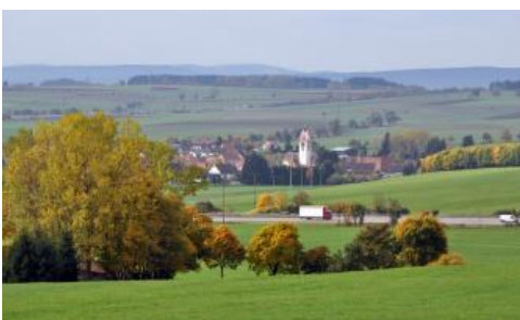
Blick über das Baar-Albvorland bei Bad Dürrenheim-Sunthausen bis zum Südschwarzwald

Die Kante im obersten Hangabschnitt der Unterjura-Schichtstufe wird, wie auch die nach Osten geneigte Stufenfläche, von den harten Kalksteinen der Arietenkalk-Formation gebildet. Weiter östlich schließt sich auf der Baar ein vielerorts als Grünland genutztes Hügelland im mittleren Unterjura an, das von Ton- und Mergelgesteinen aufgebaut wird. Durch eine deutliche Hangkante machen sich örtlich die karbonatischen Bänke der Numismalmmergel-Formation bemerkbar. Nach oben schließt der Unterjura mit einem weiteren Verebnungsniveau im Bereich der bituminösen Mergelschiefer und Mergelkalke der Posidonienschiefer-Formation (Ölschiefer) und mit Tonmergelsteinen und Kalksteinen der Jurensismergel-Formation ab. Diese Abfolge im Unterjura nimmt im Norden bei Trossingen noch