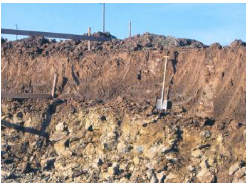
Geringmächtige Lösslehmdecke über Kalksteinen der Arietenkalk-Formation auf der Unterjura-Stufenfläche nördlich von Donaueschingen-Pföhren

erklärt sich auch, warum auf den Karbonatgesteinen heute flachgründige und steinige Böden dominieren.