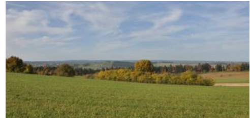
Wutachgebiet bei Bonndorf

Neben Wutach und Alb mit ihren Nebenbächen sind es auch Schwarza, Schlücht und Steina sowie kleinere Nebenbäche des Rheins, die zur Zertalung der Landschaft beigetragen haben. Oft haben sie sich durch den geringmächtigen Buntsandstein schluchtartig bis in das Grundgebirge eingeschnitten. Die dort vorkommenden Böden werden in den Legenden der Bodengroßlandschaften Grundgebirgs-Schwarzwald bzw. Buntsandstein-Schwarzwald beschrieben. Das Alb-Wutach-Gebiet ist durch große Höhenunterschiede zwischen Norden und Süden gekennzeichnet. Bei Bonndorf liegen die Muschelkalkhöhen fast 900 m ü. NHN hoch. Die Muschelkalkhänge am Hochrhein bei Dogern reichen dagegen bis 330 m ü. NHN herunter.