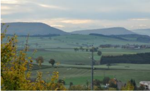
Blick von den Muschelkalkhöhen bei Bräunlingen-Döggingen nach Südwesten ins Wutachgebiet

Während im Bereich der Baar noch eine deutliche Schichtstufenlandschaft ausgebildet ist, wird dieser Charakter im Süden zunehmend undeutlicher. Der Grund dafür liegt in der starken Zerschneidung der Landschaft sowie in der abnehmenden Mächtigkeit oder dem Fehlen einzelner Schichtglieder. Eine Modifizierung der Schichtstufenlandschaft ergibt sich auch aufgrund der Bonndorfer Grabenzone. Durch die tektonische Absenkung bedingt, springen Muschelkalk-, Keuper- und Juraschichten im Raum Bonndorf/Löffingen weit nach Westen vor. In dieser Schwächezone floss im Pleistozän die Feldbergdonau, die in dieser Zeit die Schmelzwässer des vergletscherten Schwarzwaldes aufnahm. Zeugen dieser Vorgänge sind beispielsweise die mächtigen Kiesablagerungen, die in der