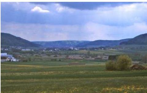
Blick durch die Spaichinger Pforte ins Faulenbachtal nach Süden

Auch die anderen zwischen Alb und Wutach gelegenen rechtsrheinischen Zuflüsse wie Steina und Schlücht besitzen schmale Talsohlen und lange steile Hänge. Wo sie über weite Strecken richtige Schluchten bilden, sind sie allerdings meist bis in das Grundgebirge eingeschnitten und ihre Böden dann in den Legenden zu den Bodengroßlandschaften Grundgebirgsschwarzwald und Buntsandsteinschwarzwald beschrieben.