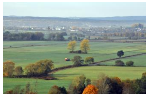
Aussicht nach Südwesten über die große Ebene des Donaueschinger Rieds bei Pfohren

Ein Charakteristikum der Baar ist das weitgehende Fehlen markanter Talformen. Die auf die hoch liegende Erosionsbasis der Donau eingestellte Landschaft wird nur randlich durch die junge rheinische Erosion angegriffen. Einerseits vom Neckar ausgehend, andererseits über die auf die Wutach ausgerichtete Gauchach haben sich dort die Täler teilweise tief in das Gesteinspaket eingeschnitten. Im Zentrum der Baar befindet sich die sog. Riedbaar. Es handelt sich dabei um Flussauen und vernässte Stufenrandsenken, die sich zwischen der nach Osten einfallenden Muschelkalk-Unterkeuper-Stufenfläche und dem Anstieg zur Keuper-Unterjura-Schichtstufe gebildet haben. Eine wichtige Rolle bei ihrer Entstehung spielten wohl die Auslaugung der Gipslager im Gipskeuper (Münzing, 1978) und der Salz- und Gipsgesteine im Mittleren Muschelkalk (Paul, 1958). Das Kerngebiet