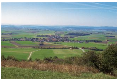
Blick nach Westen auf Bad Dürkheim-Oberbaldingen und die Stufenlandschaft der Baar

Das relativ starke Einfallen der Gesteinsschichten und die geringe Mächtigkeit mancher Schichtglieder sind die Ursache für die im Vergleich zu nördlichen Landesteilen geringen Stufenhöhen und für das enge Zusammenrücken der einzelnen Schichtstufen. Die Baar mit ihrem danubischen Relief unterscheidet sich deutlich von der durch die junge Eintiefung des Hochrheins bedingten, stark zerschnittenen Landschaft des Alb-Wutach-Gebiets. Die Donauaue bei Donaueschingen liegt 355 m höher als der nur 40 km südwestlich gelegene Unterlauf der Wutach bei Waldshut-Tiengen. Die Baar nimmt den Osten des Schwarzwald-Baar-Kreises ein. Kleinere Gebiete im Osten und im Südwesten der Baar gehören zu den Landkreisen Tuttlingen bzw. Breisgau-Hochschwarzwald. Das Alb-Wutach-Gebiet liegt dagegen nahezu vollständig im Landkreis Waldshut.