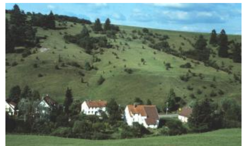
Naturschutzgebiet Mühlschulden östlich von VS-Schwenningen

Von den Gesteinen des Mittelkeupers treten v. a. die grüngrauen und violettroten Mergel- und Tonsteine des Gipskeupers (Grabfeld-Formation) in Erscheinung. Die Auslaugung von Gipsgestein im unteren Gipskeuper und die leichte Ausräumbarkeit des weichen Gesteins hat auf der Baar zu zahlreichen teils breiten Senken und einem flachen Hügelland geführt, das der Unterjura-Schichtstufe vorgelagert ist. Geringmächtige Lagen aus Sandsteinen (Engelhofen-Horizont) können lokal für die Bodenbildung von Bedeutung sein. Der höhere Gipskeuper bildet zusammen mit den darüber folgenden Ton- und Mergelsteinen der Bunten Mergel (Steigerwald- bis Mainhardt-Formation) und der Knollenmergel (Trossingen-Formation) den Anstieg zur Unterjura-Schichtstufe. Die zwischengeschalteten, geringmächtigen Sandsteine des Schilfsandsteins (Stuttgart-Formation) und des Stubensandsteins (Löwenstein-Formation, örtlich auch Stubensandsteindolomit) bilden nur gelegentlich schmale Hangverflachungen oder kleine Bergsporne. Die Schichten des Mittelkeupers werden nach Süden hin immer geringmächtiger oder setzen ganz aus. Entsprechend erniedrigt ist damit im Süden der Stufenhang der Unterjura-Schichtstufe.