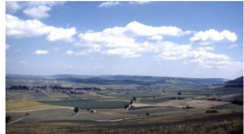
Blick vom Fürstenberg nach Norden über die Hochmulde der Baar

Mit der Baar und dem Alb-Wutach-Gebiet wurden zwei benachbarte relativ kleine Naturräume Baden-Württembergs zusammengefasst, in denen gleiche geologische Formationen vorkommen, die aber sehr unterschiedliche Reliefverhältnisse aufweisen. Es handelt sich um den im Süden des Landes, von Villingen-Schwenningen bis Waldshut-Tiengen reichenden, nur rund 10–20 km breiten Streifen zwischen Schwarzwald und Schwäbischer Alb. Den Untergrund bilden die Gesteine des Muschelkalks, des Keupers sowie des Unter- und Mitteljuras. Im Westen, an der Grenze zum Buntsandstein, stoßen sie an den südöstlichen Schwarzwald und im Osten, mit einem markanten Steilanstieg und dem Einsetzen des Oberjuras, an die südwestlichsten Ausläufer der Schwäbischen Alb (Baaralb, Hegaualb, Randen und Kleiner Randen). Die Abgrenzung der Bodengroßlandschaft lehnt sich an die „Naturräumliche Gliederung Deutschlands“ an (Benzing, 1964, 1966; Reichelt, 1964), orientiert sich aber streng an geologischen Grenzen bzw. an der Herkunft der oberflächennahen Substrate und weicht damit im Detail etwas von dieser ab. Die Landschaften sind Teil des südlichsten Abschnitts des südwestdeutschen Schichtstufenlandes.