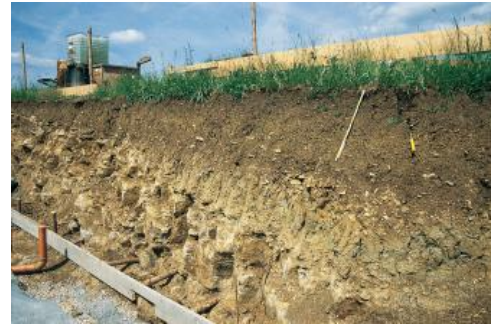
Kolluvium aus holozänen Abschwemmmassen auf Arienkalk im Unterjuragebiet bei Hüfingen-Sumpfhöfen

Zwischen Auenlehm und Flussschotter treten im Donaueschinger Ried verbreitet geringmächtige, vermutlich spätglaziale bis altholozäne Hochflutlehme auf. Sie bestehen aus feinkörnigem, weitgehend unverwittertem Gesteinsmaterial und sind im Gegensatz zu den jüngeren Hochwasserbildungen (Auenlehme) zumindest im unteren Bereich humusfrei. Nach oben schließen sie oft mit einem schwarzgefärbten tonigen Horizont ab, der vermutlich als Stillwasserablagerung zu deuten ist und den schwarzen Tonen ähnelt, die man oft am Rand und im Untergrund der Baar-Moore findet.