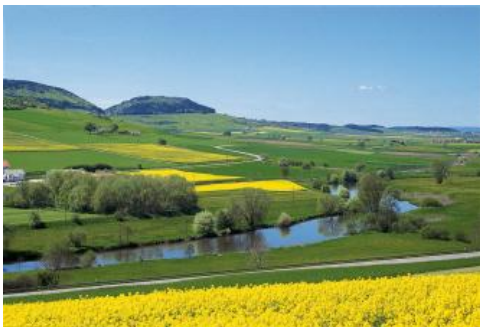
Aussicht vom Wartenberg nach Südwesten über die Donauaue zum Fürstenberg

Das relativ starke Einfallen der Gesteinsschichten und die geringe Mächtigkeit mancher Schichtglieder sind die Ursache für die im Vergleich zu nördlichen Landesteilen geringen Stufenhöhen und für das enge Zusammenrücken der einzelnen Schichtstufen. Die Baar mit ihrem danubischen Relief unterscheidet sich deutlich von der durch die junge Eintiefung des Hochrheins bedingten, stark zerschnittenen Landschaft des Alb-Wutach-Gebiets. Die Donauaue bei Donaueschingen liegt 355 m höher als der nur 40 km südwestlich gelegene Unterlauf der Wutach bei Waldshut-Tiengen. Die Baar nimmt den Osten des Schwarzwald-Baar-Kreises ein. Kleinere Gebiete im Osten und im Südwesten der Baar gehören zu den Landkreisen Tuttlingen bzw. Breisgau-Hochschwarzwald. Das Alb-Wutach-Gebiet liegt dagegen nahezu vollständig im Landkreis Waldshut.