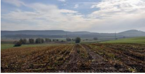
Von der Unterjura-Stufenfläche bei Pfohren geht der Blick nach Osten zur Baaralb und rechts hinten zum Wartenberg

An den bewaldeten steilen Hängen im Mitteljura-Bergland zwischen Tuningen und Talheim war bei der Bodenkartierung auffallend, dass die Decklage dort großflächig überdurchschnittliche Mächtigkeiten von mehr als 3 dm besitzt (Pelosol-Braunerden h72 , h71 ). Vermutlich waren die siedlungsfernen, steilen Hanglagen in der Vergangenheit immer bewaldet und somit vor Erosion geschützt. Besonders deutlich wird der Zusammenhang zwischen Nutzungsgeschichte und Mächtigkeit der Decklage im Bereich des Unterhölzer Walds nordwestlich von Geisingen, wo ebenfalls zweischichtige Pelosol-Braunerden vorherrschen ( h72 ). Dieses seit 1939 als Naturschutzgebiet ausgewiesene, zusammenhängende Waldgebiet ist seit jeher Herrschaftswald und war wohl nie vollständig gerodet (Vetter, 1964;