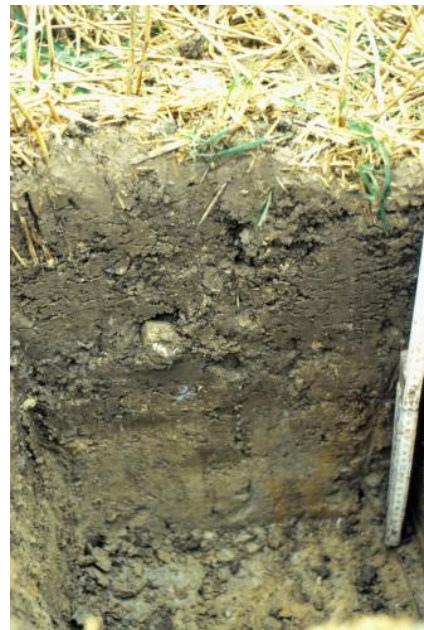
Pararendzina aus tonig-mergeligem Verwitterungsmaterial des Unterjuras (h59)