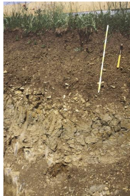
Tiefes Kolluvium in einer flachen Mulde im Unterjura-Gebiet bei Hüfingen-Sumpftöhlen (h82)

In den zahlreichen Muldentälchen , Senken und Hangfußlagen des Mittel- und Unterjura gebiets bilden mehr oder weniger mächtige, durch die Bodenerosion entstandene holozäne Abschwemmmassen das Ausgangsmaterial der Bodenbildung. Es handelt sich meist um lehmig-tonige Substrate, die hinsichtlich ihres Grund- und Stauwassereinflusses zu unterscheiden sind. Kaum hydromorphe Merkmale zeigen die mäßig tiefen bis tiefen Kolluvien ( h82 ) deren Einzugsgebiet hauptsächlich an den Mitteljurahängen oder auf den Arietenkalk-Platten liegen. Dort kommen zudem oft sehr flache Mulden vor, in denen die Kolluvien meist weniger als 0,5 m mächtig sind ( h84 ). Die meisten anderen Kolluvien weisen meist deutliche Anzeichen zeitweiliger Staunässe auf, da sie oft nicht sehr mächtig sind und über dichtgelagerten Tonfließerden liegen. Auch die Abschwemmmassen selbst sind meist recht tonreich und schwer wasserdurchlässig. Verbreitete Böden sind daher Pseudogley-Kolluvien, die oft von Pseudogley-Pelosolen unterlagert werden ( h85 ). Das Hauptverbreitungsgebiet der noch stärker hydromorphen Kolluvium-Pseudogleye und Pseudogleye ( h81 ) liegt im Bereich der Opalinuston-Formation. Die holozänen Abschwemmmassen sind dort in den Waldgebieten allerdings oft sehr geringmächtig. Teilweise wird der wasserdurchlässige Oberboden dort auch von lösslehmhaltigen Fließerden gebildet (Deck- und/oder Mittellage). Vielerorts weist der stauende tonige Unterboden eine grauschwarze bis schwarze Farbe auf (Sumpftön).