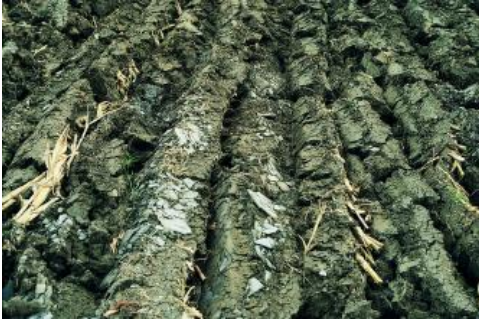
Pararendzina aus Ölschiefer (Posidonienschiefer-Formation, Unterjura) auf einer Ackerfläche bei Trossingen

Im Bereich der von der Posidonienschiefer-Formation (Ölschiefer, früher: Schwarzjura epsilon) gebildeten, meist ackerbaulich genutzten Flächen der Baar sind Tonböden (Pelosole h62 ) verbreitet, die eine charakteristische dunkle Färbung besitzen. Im Vergleich zu den Pelosolen aus anderen Tongesteinen der Baar besitzen die meist ackerbaulich genutzten Ölschieferböden aufgrund des hohen Gehalts an organischer Substanz aus dem Ausgangsgestein ein vergleichsweise lockeres Bodengefüge mit günstigerem Wasser- und Lufthaushalt. Sie neigen daher im Gegensatz zu Pelosolen aus anderen Unterjuragesteinen selten zu Staunässe. Am auffallendsten tritt der Ölschiefer dort in Erscheinung, wo durch das Pflügen flachgründiger Böden die rohen Schieferplatten an die Oberfläche geschafft wurden. Die entsprechenden Böden sind als Pararendzina zu bezeichnen ( h60 ). In Bereichen, wo härtere Mergelkalksteine