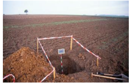
Ackerbau auf der lösslehmbedeckten Unterjura-Stufenfläche südsüdwestlich von Donaueschingen-Aasen (h74)

Die wenigen zentralen Plateauflächen, auf denen Lösslehm oder über 1 m mächtige, lösslehmreiche Fließerden (Mittellage) auftreten, sind hinsichtlich ihrer für den Landbau günstigen Bodenverhältnisse besonders hervorzuheben. Es handelt sich dabei um inselhafte Vorkommen hauptsächlich in dem Bereich zwischen Tuningen, Donaueschingen-Aasen und Bad Dürkheim-Oberbaldingen mit Pseudogley-Parabraunerden und pseudovergleyten Parabraunerden ( h74 ). Meistens ist der Tonverarmungshorizont durch Erosion abgetragen oder stark verkürzt. Die Tonüberzüge auf den Aggregaten der Bt-Horizonte sind oftmals schwer zu erkennen und z. T. auch nur in Rissen und Klüften vorhanden (Parabraunerde-Braunerde). Möglicherweise sind bei solchen Bodenprofilen durch die Bodenerosion ältere, umgelagerte Bodenbildungen, in denen keine holozäne Tonverlagerung mehr stattgefunden hat, an die Oberfläche geraten. Nicht selten finden sich humose, dunkle Flecken in den Bt-Horizonten. In Muldentälchen, in der Unterlagerung von holozänen Abschwemmassen, sowie im Übergang zu Mooren und feuchten Senken können sie komplett schwarzbraun gefärbt sein. Vermutlich handelt es sich um eine alte Bodenbildung („Feucht-Schwarzerde“), die durch gehemmten Humusabbau unter ehemals feuchteren Verhältnissen entstanden ist.