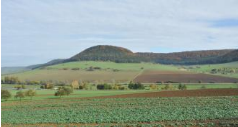
Der Hörnekopf am Rand der Baaralb bei Geisingen

Gley-Kolluvien und Gleye ( h86 , h88 ) sind v. a. in den Muldentälern im Übergang zu den feuchten Senken und Auen und unterhalb der zahlreichen Quellhorizonte verbreitet. In einigen ebenen Tiefenbereichen sowie auf Verebnungen und flachen Schwemmfächern im Übergang zu Auen und Mooren treten örtlich sehr tonreiche Substrate auf, in denen zusätzlich zum Grundwassereinfluss noch Staunässe eine Rolle spielt (Pseudogley-Gley h87 ). Am stärksten vernässt sind die in Kartiereinheit (KE) h89 abgegrenzten Bereiche mit Anmoorgleyen, Humusgleyen und Moorgleyen, die sich am Rand der vermoorten Senken im Baar-Albvorland befinden. Der aktuelle Grundwasserstand befindet sich bei diesen Böden z. T. nahe der Geländeoberfläche. Häufig ist er aber auch künstlich abgesenkt.