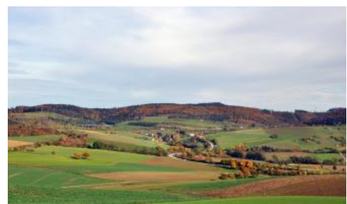
Blick nach Osten zum Randen bei Blumberg-Epfenhofen

Auch weiter südlich bilden Unter- und Mitteljura breite Rücken, Hänge und schmale Verebnungen. Sie befinden sich auf dem sog. Hallauer Rücken zwischen unterer Wutach und Klettgauer Tal sowie, dem Kleinen Randen vorgelagert, am Hochrhein zwischen Küssaberg und Lauchringen. Vorherrschende Böden auf Scheitelbereichen und Hängen sind dort zweischichtige Braunerde-Pelosole und Pelosol-Braunerden aus einer geringmächtigen lösslehmhaltigen Fließerde (Decklage) über tonreicher Fließerde (Basislage) oder Rutschmassen ( h65 , örtlich h63 ). Pelsole und Pararendzinen als Erosionsprofile kommen nur untergeordnet, v. a. im Bereich junger Hangrutschungen vor. Das Unterjuragebiet östlich von Wutöschingen-Degernau wird allerdings von Pararendzinen dominiert ( h59 ). Im Bereich der Rebhänge bei Klettgau-Erzingen besitzen sie, durch das Rigolen bedingt, einen schwach humosen Unterboden (Pararendzina-Rigosol h90 ). Stellenweise wurde dort in den Weinbergen aber auch Fremdmaterial aufgebracht.