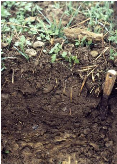
Rendzina auf Kalksteinen der Arietenkalk-Formation (Unterjura, h55)

In hängigen Lagen und auf rundlichen Scheitelbereichen, in denen die Mittellage fehlt, sind Pelosole verbreitet ( h61 ). In den Randbereichen der Plateaus und auf kleineren Verebnungen, wo Kalksteine in Oberflächennähe anstehen, dominieren Rendzinen ( h55 ). Vereinzelt, z. B. nördlich von Donaueschingen-Aasen, haben sich auf den Unterjura-Kalksteinen auch Terrae fuscae entwickelt ( h79 ). Es handelt sich aber sicherlich meist nicht um reine Rückstandstone, wie sie in den typischen Kalksteinlandschaften des Muschelkalks oder Oberjuras vorkommen. Vielmehr sind sie oft in unterschiedlichem Maße mit Mergelstein-Verwitterungsmaterial vermischt. Die Terrae fuscae sind daher mit Pelosolen und Pararendzinen vergesellschaftet. In der östlichen und südlichen Umrahmung des Donaueschinger Rieds bildet der tiefere Unterjura nur noch schmale Verebnungen und Hügelrücken, auf denen der Lösslehmeinfluss stark zurückgeht und Pelosole, Pararendzinen und Rendzinen vorherrschen.