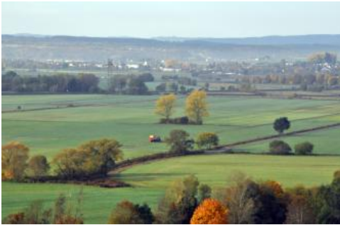
Aussicht nach Südwesten über die große Ebene des Donauschinger Rieds bei Pfohren

Bis Geisingen sind in den Auenabschnitten entlang der Donau Böden mit deutlichen Grundwassermerkmalen im Unterboden aus schwach lehmigen oder sandigen Auensedimenten wechselnder Mächtigkeit auf sandigem Kies verbreitet (Brauner Auenboden-Auengley und Auengley-Brauner Auenboden, h134 , h135 ). Die aktuellen Grundwasserstände unterliegen starken Schwankungen. Nach Hochwasser oder ergiebigen Regenfällen sind sie zeitweise höher als es aufgrund der Profilmerkmale zu erwarten wäre. Vorherrschende Böden in den Rinnen ehemaliger Donauläufe sind Auengleye und z. T. auch Nassgleye mit hoch anstehendem Grundwasser ( h140 ).