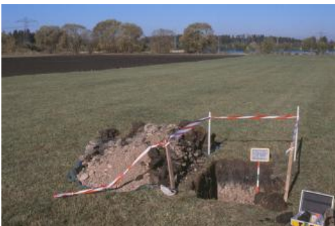
Anmoorgley aus tonreichem Altwassersediment ( h148 ) südwestlich von Donauschingen-Pfohren

In seltener überfluteten flachen Senken in flussfernen Abschnitten der Aue konnten sich längere Zeit stehende Gewässer halten, in denen tonige Altwassersedimente zur Ablagerung kamen. In solchen Bereichen, wie etwa am Nordrand der Donauaue zwischen Neudingen und Gutmadingen, sind heute anmoorige, nasse Böden (Anmoorgleye, humose Auengleye und humose Auenpseudogley-Auengleye, h145 , h148 ) verbreitet. Auch im Süden des Donauschinger Rieds, in der Umgebung des Wuhrholz-Moors, finden sich oft Anmoorgleye aus schwarzen, tonigen Altwassersedimenten. Eine geringmächtige Auenlehmdecke ist dort nur lückenhaft vorhanden. Das Grundwasser ist im Westen des Vorkommens von Einheit h148 sowie in Einheit h145 deutlich künstlich abgesenkt.