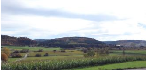
Blick nach Südwesten über das Zollhausried bei Blumberg

Während es auf der Baar nur noch wenige Moore mit echter Moorvegetation gibt (Reichelt, 1995, S. 60 ff.), sind Moore im bodenkundlichen Sinne relativ weit verbreitet und nehmen eine Fläche von rund 6,8 km 2 ein ( h149–h152 ). Es handelt sich um Böden mit mehr als 30 cm Torfmächtigkeit, wobei unter Torf Substrate mit mehr als 30 Masse-% organischer Substanz zu verstehen sind. Oft sind diese Flächen stark durch ehemaligen Torfabbau überprägt. Viele Moore sind entwässert und werden als Grünland oder forstwirtschaftlich genutzt. Die Torfe der entwässerten Moore sind im obersten Bereich gelegentlich sehr stark zersetzt oder vererdet. Andere Flächen sind wegen des hochanstehenden Grundwassers von der land- und