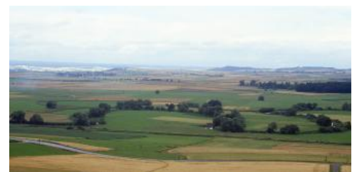
Flussschlingen der Donau bei Geisingen-Gutmadingen

Die Böden in der Talsohle der Breg zwischen Donaueschingen-Wolterdingen und Hüfingen besitzen ebenso wie die Böden der Brigachau zwischen VS-Villingen und Donaueschingen noch deutlich den Charakter von Auenböden der Schwarzwaldtäler. Es handelt sich um sandige Lehme mit wechselndem Kiesgehalt und unterschiedlicher Mächtigkeit, die von Schwarzwaldschottern unterlagert werden. Tendenziell ist der Grundwassereinfluss in der Bregau gering (Brauner Auenboden und Auengley-Brauner Auenboden, h125 ) als in der Brigachau (Auengley-Brauner Auenboden bis Auengley, h132 ). Immer wieder treten im Brigach- und Bregtal und in ihren kleinen Nebentälern auch nasse Wiesen mit Auengleyen und Nassgleyen auf ( h137 , h138 , h139 , h144 ).