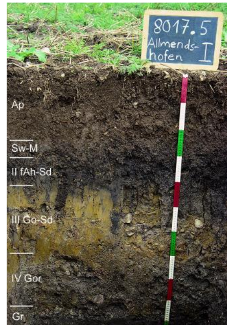
Auengley-Auenpseudogley aus Auenlehm über Hochflutlehm auf Donauschotter ( h129 )