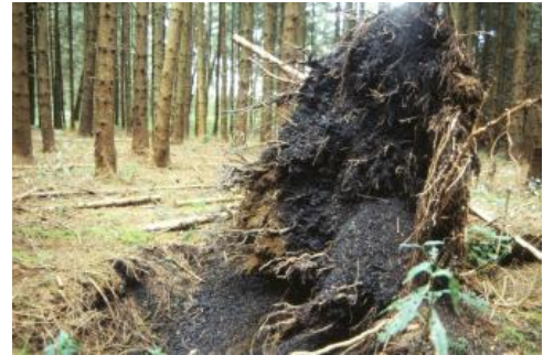
Windwurf im Bereich humoser Gleye aus tonreichen Altwassersedimenten (Sumpftone) in der Umgebung des Schuraer Moors

Einige der breiten Auen und Talmulden der Baarlandschaft wurden in historischer Zeit zu Fischweihern aufgestaut. Der wohl größte war der in historischen Karten des 17. und 18. Jh. eingetragene Donaueschinger Weiher (Reichelt, 1970; Reinartz, 1987). Reste des Damms beim Donaueschinger Flugplatz sind heute noch erkennbar. Am Rand der Muselau sind dort in einem etwa 1,6 km langen Streifen die Oberböden kalkhaltig und enthalten Schneckenschalen, während die Auenböden im Museltal sonst üblicherweise kalkfrei sind.