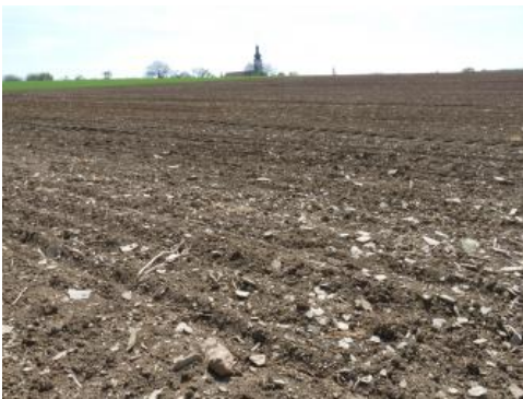
Ackerfläche im Lettenkeuper bei Wittighausen-Vilchband

Vielfach sind auf den landwirtschaftlich genutzten Flächen im Lettenkeupergebiet tonige, z. T. steinige Böden zu finden, die bereits an der Oberfläche karbonathaltig sind. Ehemals entkalkte Bodenhorizonte wurden durch die Bodenerosion abgetragen oder durch die Pflugarbeit mit karbonathaltigem Unterbodenmaterial vermischt. Vorherrschende Böden sind Pararendzinen mit Übergängen zum Pelosol ( i15 ). In geringer Tiefe, oberhalb 5 dm u. Fl. kann örtlich bereits das anstehende Ton-, Mergel-, Sand- oder Dolomitgestein auftreten. Als Begleitböden kommen vereinzelt Braunerde-Ranker aus Sandstein, Pelosol-Ranker aus Ton- und Schluffstein sowie Rendzinen aus Dolomitstein vor. In wenigen Fällen ließen sich Braunerde-Ranker und Braunerden aus Sandstein oder Sandstein führenden Fließerden als flächenhafte Vorkommen abgrenzen ( i1 , i25 ).