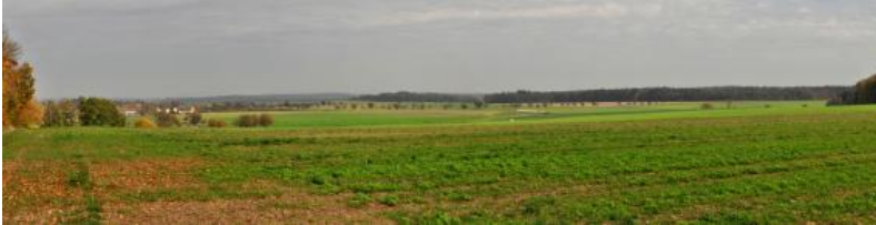
Lettenkeuper-Landschaft bei Creglingen-Freudenbach

In flachen Muldentälern im Lettenkeupergebiet finden sich oft mäßig tiefe und tiefe Kolluvien aus schluffig-lehmigen holozänen Abschwemmmassen, die deutliche Anzeichen zeitweiliger Staunässe aufweisen (Pseudogley-Kolluvium und Kolluvium-Pseudogley, i73 ). In flachen Muldenanfängen sind die Abschwemmmassen oft geringmächtig. Dort sind mittel und mäßig tiefe Kolluvien und Pseudogley-Kolluvien zu finden, die von Pelosolen, Pseudogley-Pelosolen oder Parabraunerden unterlagert werden ( i70 ).