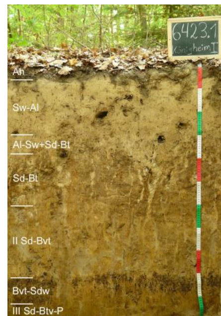
Pseudogley-Parabraunerde aus Lösslehm im „Ahornwald“ südlich von Königheim-Brehmen (i45)

Häufig ist zwischen Deck- und Basislage auch eine Mittellage vorhanden, so dass es zur Ausbildung dreischichtiger Bodenprofile kam. Meist ist in der lösslehmreichen Mittellage der Bt-Horizont einer Parabraunerde oder Pelosol-Parabraunerde entwickelt ( i41 , i43 , i47 ). Örtlich, wo der tiefere Unterboden aus dem umgelagerten Rückstandston der Dolomitsteinverwitterung besteht, handelt es sich um Terra fusca-Parabraunerden. Besonders in ebenen und schwach geneigten Lagen oder flachen Mulden sind die Mittellagen mächtiger und gehen in skelettfreien Lösslehm über, in dem keine Umlagerungsmerkmale zu erkennen sind. In solchen Reliefpositionen sind in den Böden immer auch deutliche Staunässemerkmale vorhanden. Vorherrschender Bodentyp ist die Pseudogley-Parabraunerde ( i45 ). Als Stauhhorizont wirkt neben dem Tonanreicherungshorizont (Bt) der Parabraunerde besonders auch die unter dem Lösslehm folgende tonreiche Basislage aus Lettenkeuper-Material. Als Folge der Bodenerosion sind die Tonverarmungshorizonte (Al-Horizonte) der Parabraunerden in den häufig vorkommenden Kartiereinheiten i41 und i45 oft stark verkürzt oder fehlen auf exponierten Ackerflächen auch vollständig.