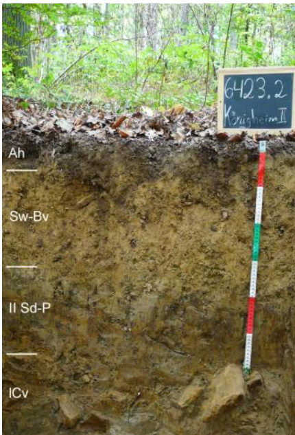
Pseudovergleyte Pelosol-Braunerde im Lettenkeupergebiet (i27)

Häufig ist zwischen Deck- und Basislage auch eine Mittellage vorhanden, so dass es zur Ausbildung dreischichtiger Bodenprofile kam. Meist ist in der lösslehmreichen Mittellage der Bt-Horizont einer Parabraunerde oder Pelosol-Parabraunerde entwickelt ( i41 , i43 , i47 ). Örtlich, wo der tiefere Unterboden aus dem umgelagerten Rückstandston der Dolomitsteinverwitterung besteht, handelt es sich um Terra fusca-Parabraunerden. Besonders in ebenen und schwach geneigten Lagen oder flachen Mulden sind die Mittellagen mächtiger und gehen in skelettfreien Lösslehm über, in dem keine Umlagerungsmerkmale zu erkennen sind. In solchen Reliefpositionen sind in den Böden immer auch deutliche Staunässemerkmale vorhanden. Vorherrschender Bodentyp ist die Pseudogley-Parabraunerde ( i45 ). Als Stauhhorizont wirkt neben dem Tonanreicherungshorizont (Bt) der Parabraunerde besonders auch die unter dem Lösslehm folgende tonreiche Basislage aus Lettenkeuper-Material. Als Folge der Bodenerosion sind die Tonverarmungshorizonte (Al-Horizonte) der Parabraunerden in den häufig vorkommenden Kartiereinheiten i41 und i45 oft stark verkürzt oder fehlen auf exponierten Ackerflächen auch vollständig.