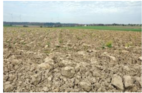
Gebleichte Oberböden von Pseudogleyen auf Lettenkeuper südlich von Creglingen-Freudenbach