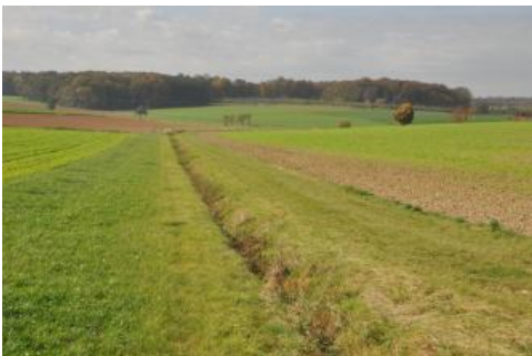
Feuchte Mulde mit Drainagegraben im Lettenkeupergebiet bei Creglingen-Freudenbach

In bewaldeten oder durch Grünland genutzten Muldentälern sind örtlich Böden verbreitet, die noch stärker durch Staunässe geprägt sind und zusätzlich auch oft Grundwassereinfluss aufweisen. Es handelt sich um Gley-Pseudogleye, Kolluvium-Pseudogleye, Parabraunerde-Pseudogleye und Gleye aus geringmächtigen holozänen Abschwemmmassen oder älteren Schwemmsedimenten, die über Fließerden oder Lösslehm lagern ( i56 , i59 , i99 ). In KE i97 wurden flache, mulden- und sohlenförmige Tälchen sowie Hangfußlagen abgegrenzt, in denen Kolluvium-Gleye aus meist tonreichen Abschwemmmassen vorherrschen.