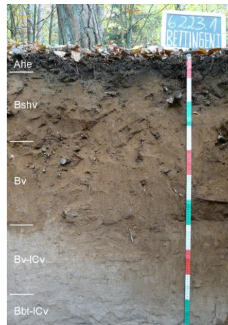
Podsol-Braunerde aus Flugsand auf einer pleistozänen Mainterrasse bei Wertheim-Bettingen ( i26 )

An den flachen Unterhängen bei Wertheim-Bettingen geht der Löss über Sandlöss in den für das Maintal charakteristischen Flugsand über (Freudenberger, 1990). Die Flugsanddecken lagern größtenteils bereits schon über Buntsandstein oder über pleistozänen Terrassensedimenten des Mains. Es sind v. a. sandige Braunerden verbreitet, die im tieferen Unterboden oft durch Lessivierung entstandene Tonbänder aufweisen ( i26 ). Bänderparabraunerden treten selten auf. Unter Wald sind die Sandböden meist podsoliert (podsolige Braunerde und Podsol-Braunerde). In geneigten Lagen sind die Flugsande oft umgelagert und örtlich, im Übergang zu höheren Hangabschnitten, mit Kalksteinschutt vermischt.