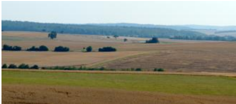
Flachhügelige Gäulandschaft im Tauberland nordöstlich von Tauberbischofsheim

An flachen Gleithängen im Taubertal sowie in Muldentalanfängen des lössbedeckten Tauberlands sind die Kolluvien oft nur mittel bis mäßig tief und werden von Parabraunerden unterlagert ( i71 ). Deren Bt-Horizonte sind gelegentlich schwach humos und weisen eine schwarzbraune Farbe auf (Tschernosem-Parabraunerde). Bei Igersheim-Bernsfelden schließt sich daran das verzweigte Muldentalsystem des Maßbachs an, in dem die Kolluvien deutlichen Grundwassereinfluss aufweisen (Gley-Kolluvium, i75 ).