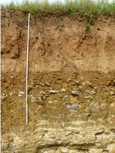
Parabraunerde aus Löss über Muschelkalk-Fließerde (i30)

Das Profil bei Grünsfeld-Krensheim zeigt unten gebankte Kalksteine des Oberen Muschelkalks, darüber eine durch Tonmergelstein- und Kalksteinverwitterung sowie durch eiszeitliches Bodenfließen entstandene steinig-tonige Fließerde. Aus der an dieser Stelle vorhandenen Überdeckung aus ca. 80 cm Löss hat sich eine erodierte Parabraunerde entwickelt. Die obersten 25 cm sind künstlich aufgebracht.