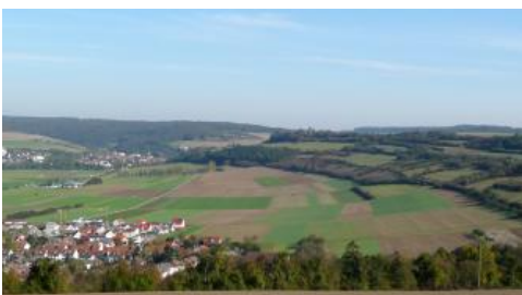
Blick auf einen ausgedehnten, flachen Gleithang im Taubertal zwischen Bad Mergentheim (vorne) und Igersheim (hinten)

Solche lössreichen Fließerden, die örtlich auch viel Muschelkalkschutt enthalten können, sind besonders auch an Unterhängen des Taubertals und seiner Nebentäler verbreitet. Im Taubertal überlagern die lössreichen Fließerden z. T. pleistozäne Flussterrassen. Am Hangfuß handelt es sich teilweise wohl auch um lössreiche pleistozäne Schwemmsedimente. Auch in diesen Bereichen wurden die Parabraunerden meist vollständig erodiert, so dass heute Braunerde-Pararendzinen und Pararendzinen vorherrschen (i18).