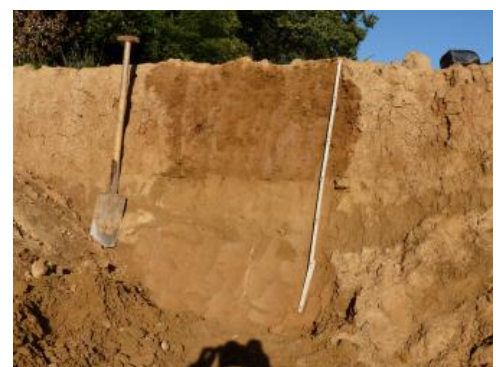
Erodierte Parabraunerde aus Löss nordöstlich von Tauberbischofsheim ( i30 )

Erodierte Parabraunerden aus Löss ( i30 ) nehmen v. a. auf den Gäuflächen nördlich und östlich des Taubertals große Flächen ein. Die Tonverarmungshorizonte (Al-Horizonte) sind durch die Bodenerosion meist sehr stark verkürzt bzw. im Pflughorizont aufgearbeitet oder komplett abgetragen. In 5–10 dm Tiefe folgt unter dem Bt-Horizont meist der C-Horizont aus kalkhaltigem Rohlöss. Dieser ist örtlich nur sehr geringmächtig und wird von einem älteren kalkfreien oder sekundär aufgekalkten Lösslehm unterlagert. In bewaldeten Flachlagen waren die Böden weniger von der Erosion betroffen, so dass sich dort oft noch nahezu vollständige Parabraunerde-Profile finden (Kartiereinheit i31 ).