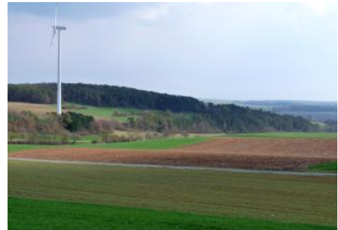
Gäulandschaft im Tauberland nordöstlich von Werbach-Wenkheim

Das Lössverbreitungsgebiet des nordöstlichen Tauberlands wird von zahlreichen verzweigten, meist zum Einzugsgebiet des Grünbachs gehörenden Muldentälern durchzogen. In ihnen finden sich tiefe Kolluvien aus mächtigen holozänen Abschwemmmassen. Meistens, v. a. wenn an den Hängen Löss-Pararendzinen verbreitet sind, handelt es sich um kalkhaltige Kolluvien ( i62 ). Dieselbe Kartiereinheit wurde für schluffreiche, kalkhaltige Kolluvien aus Lössbodenmaterial im Raum Mosbach im Bauland verwendet.