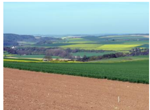
Vom Wittigbach und seinen Nebentälern zerschnittene Landschaft im Oberen Muschelkalk bei Grünsfeld-Zimmern

Noch stärker erodierte Böden kommen hingegen auf den sehr schwach bis mittel geneigten, meist ostexponierten ackerbaulich genutzten Hängen im Tauberland vor. Die Parabraunerden sind dort oft komplett abgetragen oder ihr Bt-Horizont im Pflughorizont aufgearbeitet. Vorherrschende Böden sind Pararendzinen (i16). Stellenweise sind diese auch in solifluidal umgelagertem Löss entwickelt, der auch etwas Muschelkalk- oder Lettenkeupermaterial enthalten kann.