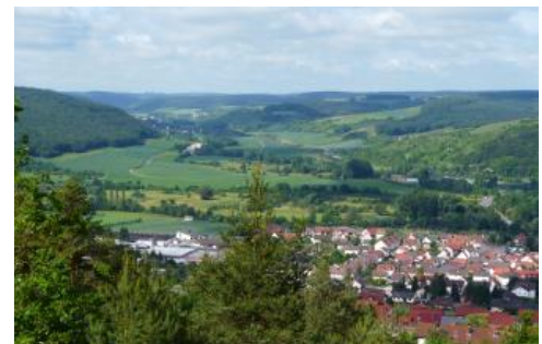
Blick nach Südwesten über das Taubertal bei Lauda-Königshofen in das untere Umpfertal bei Sachsenflur

Böden aus pleistozänen Terrassensedimenten nehmen nur sehr wenig Fläche ein. Im Taubertal sind die Talbodenreste älterer Flussniveaus meist von mächtigen Lössdecken, Fließberden, Hangschutt oder Abschwemmmassen überdeckt. Gelegentlich ist auf den Ackerflächen dort eine lockere Kiestreu festzustellen, die aber bodenkundlich nicht relevant ist. Im Maintal bei Wertheim-Bettingen werden die Terrassensedimente von Flugsand überlagert.