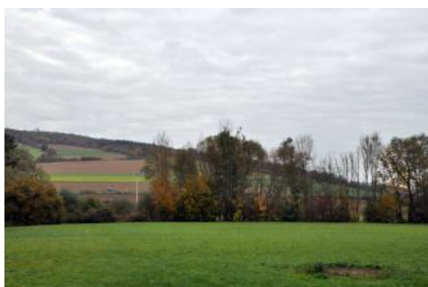
Taubertal südwestlich von Weikersheim

Bei Weikersheim und bei Tauberbischofsheim-Dittigheim wurden zwei kleine Terrassenflächen abgegrenzt, die wenige Meter über der Talaua liegen ( i10 ). Es dominieren dort Ackerböden, die sehr viel Kalksteinkies enthalten (Rendzinen). Sie wechseln mit mittel tiefen, kalkhaltigen und schutführenden Kolluvien ab. Auf einer weiteren kleinflächigen, höher gelegenen Terrasse südlich von Lauda-Königshofen ist nur wenig pleistozäner Flusskies erhalten. Er ist vollständig in einer geringmächtigen Lössfließerde aufgearbeitet, die über Mergelsteinersatz des Unteren Muschelkalks lagert. Die Böden an dem schwach geneigten Hang sind stark durch Bodenerosion geprägt (Braunerde-Pararendzina, Pararendzina, i20 ).