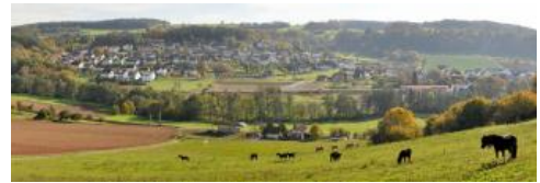
Blick nach Süden auf Elztal-Neckarburken im südwestlichen Bauland