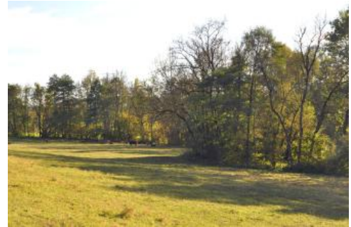
Weidenutzung in der Aue des Hiffelbachs südlich von Buchen-Bödigheim

In einigen Bachtälern finden sich Auenabschnitte mit tonreicheren Auensedimenten, so etwa im Übergang vom Unteren Muschelkalk zur Rötton-Formation (Oberer Buntsandstein) bei Buchen-Bödigheim (Kalkhaltiger Auengley-Brauner Auenboden, i86 ) oder im Ausstrichbereich des Mittleren Muschelkalks südlich von Buchen-Eberstadt (Brauner Auenboden-Auengley, i90 ). Am Oberlauf der Erfa, zwischen Hardheim-Gerichtstetten und Ahorn-Buch, wird der Auenlehm von tonreichen Umlagerungsbildungen aus Lettenkeuper- und Muschelkalkmaterial unterlagert. Neben Grundwassereinfluss waren dort auch deutliche Staunässemerkmale festzustellen (Auenpseudogley-Auengley, i94 ).