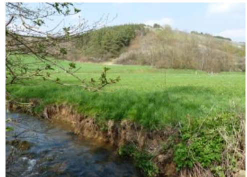
Schüpfbachaue östlich von Boxberg-Lengenrieden

In KE i88 wurden Auenböden zusammengefasst, in denen die hydromorphen Merkmale stärker ausgeprägt sind (Auengley-Brauner Auenboden und Brauner Auenboden-Auengley). Im Grundwasserschwankungsbereich bzw. in der Zone des kapillaren Grundwasseranstiegs gebildete Rostflecken lassen sich bei diesen Böden stellenweise (Auenboden-Auengley) bereits oberhalb 4 dm u. Fl. feststellen. Sie treten verbreitet in den Nebentälern der Tauber auf. In den schmalen Oberläufen sind die Böden dort örtlich karbonatfrei. Im Taubertal wurde die Einheit nur in wenigen, meist kleinflächigen Auenabschnitten ausgewiesen.