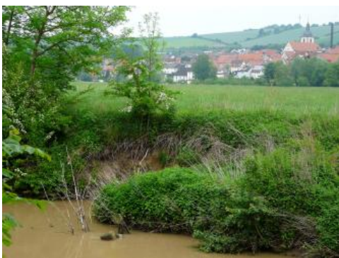
Tauberaue bei Tauberbischofsheim-Distelhausen

Haupteinheit im Taubertal und seinen Nebentälern ist Kartiereinheit (KE) i80 . Dominierender Bodentyp ist ein kalkhaltiger oder kalkreicher Brauner Auenboden (Vega). Grundwassermerkmale sind in den Profilen nur gelegentlich unterhalb 8 dm u. Fl. festzustellen. Der Auenlehm ist 12 bis über 20 dm mächtig und wird von schluffig-lehmigem bis lehmig-sandigem Kies unterlagert. Als Begleitböden können örtlich, besonders in schmalen Rinnen, auch Böden mit deutlicherem Grundwassereinfluss vorkommen (Auengley-Brauner Auenboden und Brauner Auenboden-Auengley). Außerdem treten vereinzelt auch Böden aus geringmächtigerem (5–12 dm) Auenlehm auf. An wenigen jungen Auenabschnitten in Flussnähe nördlich von Bad Mergentheim konnten solche Bereiche als eigene Kartiereinheit ausgewiesen werden ( i85 ).