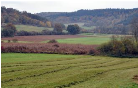
Randbereich der Seckachaue südlich von Adelsheim

In drei Kartiereinheiten wurden im Bau- und Tauberland kleinflächige, vernässte Auenabschnitte abgegrenzt, in denen der Auengley den Leitbodentyp bildet. Die Einheiten i91 , i92 und i93 unterscheiden sich durch den Karbonatgehalt und die Bodenart des Auenlehms. Noch stärker vernässte Flächen, in denen auch Nassgleye vorkommen, werden in Einheit i101 beschrieben.