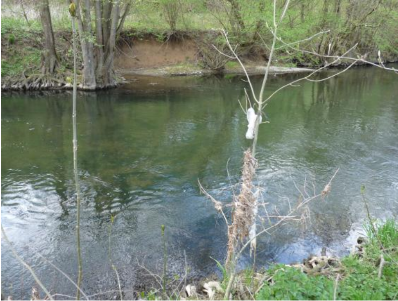
Die Tauber südlich von Lauda-Königshofen

Am Ufer im Hintergrund ist der aus Überflutungssedimenten entstandene Braune Auenboden ( i85) über hellem Muschelkalk-Kies zu sehen. Im Vordergrund ist die im Gehölz hängen gebliebene Fracht der Tauber eine Marke für den Höchststand des letzten Hochwassers.