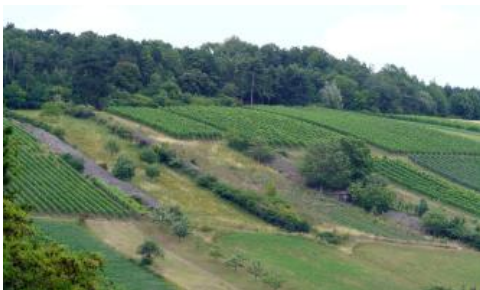
Südexponierter Weinbergshang im Oberen und Mittleren Muschelkalk im Brehmbachtal bei Königheim-Gissigheim (i104)

Die Böden der aktuell Weinbaulich genutzten Hangabschnitte im Tauberland werden in Einheit i104 beschrieben. Die Weinbergsböden (Rigosole) sind durch tiefe Bodenbearbeitung und einen daraus resultierenden Humusgehalt im Unterboden charakterisiert. Sie sind oft in steinigem Muschelkalk-Hangschutt entwickelt und besitzen dann nur ein geringes Wasserspeichervermögen, was in Verbindung mit den geringen Niederschlägen im Regenschatten des Odenwalds zu Problemen führen kann. Besser sind die Bedingungen dort, wo die Reben auf steinigen Tonfließberden stehen. Stellenweise wird versucht, durch den künstlichen Auftrag von Lössboden-Material die Durchwurzelbarkeit und das Wasserspeichervermögen zu verbessern.