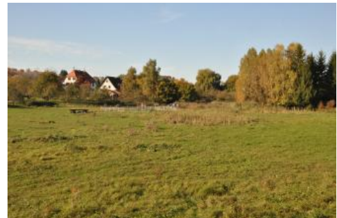
Kleinflächiger, stärker vernässter Auenabschnitt am Hiffelbach bei Buchen-Bödighheim (Auengley, i92)

In anderen Fluss- und Bachtälern des Baulands weisen die Auenböden häufiger Grundwassermerkmale im Unterboden auf und sind je nach Einzugsgebiet örtlich auch karbonatfrei ( i81 , i82 , i83 , i87 , i88 ; Brauner Auenboden mit Vergleyung im nahen Untergrund, Auengley-Brauner Auenboden, Brauner Auenboden-Auengley). Böden aus tonreicheren Auensedimenten im Bauland sind durch eine sehr hohe KAK gekennzeichnet ( i86 , i90 ). In den schwer wasserdurchlässigen, tonreichen Sedimenten am Oberlauf der Erfa bei Ahorn-Buch war neben Grundwassereinfluss auch zeitweilige Stauansätze festzustellen (Auenpseudogley-Auengley, i94 ). Stärker vernässte, durch hoch anstehendes Grundwasser geprägte Auenabschnitte sind selten und nehmen nur wenig Fläche ein. Sie werden in den Kartiereinheiten i91 , i92 , i93 und i101 beschrieben (Auengley, Nassgley).