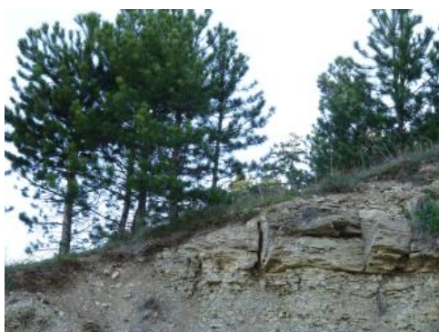
Unterer Muschelkalk bei Werbach-Werbachhausen

Die stark geneigten und steilen Talhänge sind überwiegend mit Hangschutt aus Karbonatgestein bedeckt. Die früher verbreitet weinbaulich genutzten Steilhänge im Unteren Muschelkalk sind stark durch Bodenerosion überprägt. Es handelt sich oft um Trockenstandorte mit sehr flach bis flach entwickelten Rendzinen (i4). Die Schuttdecken sind oft nur geringmächtig. Stellenweise folgt unter dem Ah-Horizont auch bereits der anstehende Kalkstein und nicht selten tritt in diesen Bereichen der kahle Fels an die Oberfläche.