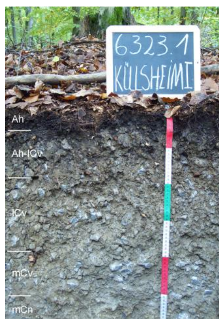
Sehr flach entwickelte Rendzina aus Kalksteinzersatz des Unteren Muschelkalks (i8)