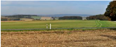
Blick über die lösslehmbedeckte Bauland-Gäufäche bei Mosbach-Bergfeld nach Nordwesten

Besonders im Lettenkeupergebiet im Bereich des Ahornwalds, aber auch auf Oberem Muschelkalk im südlichen und südwestlichen Bauland, weisen die Lösslehme in Flachlagen des Öfteren deutliche Staunässemerkmale auf. Als Stauhizont wirken der unter geringmächtigem, verlehmtem Würmlöss folgende, z. T. umgelagerte, ältere Lösslehm und/oder die unterhalb 1 m Tiefe anschließende Tonfließerde. Die Wasserdurchlässigkeit und die Luftkapazität im Unterboden sind bei den dort vorkommenden Pseudogley-Parabraunerden ( i45 , i46 ) und Parabraunerde-Pseudogleyen ( i57 )