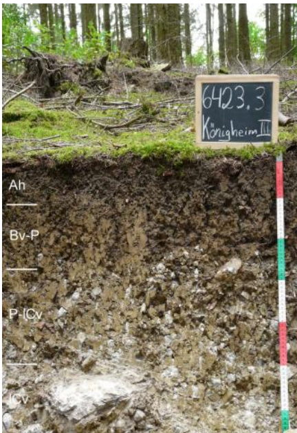
Braunerde-Pelosol auf Oberem Muschelkalk (i22)

Die obersten 2–3 dm der Bodenprofile in KE i24 sind örtlich noch im Rest einer lösslehmhaltigen Deckschicht (Decklage) entwickelt, die andernorts durch Bodenerosion abgetragen wurde. Die Eigenschaften der Böden sind neben der Gründigkeit und dem Steingehalt besonders auch von dieser Deckschicht abhängig. Ist sie vorhanden, dann ist der Wasser- und Lufthaushalt sowie die Durchwurzelbarkeit als günstiger einzustufen. Am ehesten ist eine geringmächtige Decklage noch unter Wald ausgeprägt. Dort sind dann die Oberböden oft entkalkt und schwach bis stark sauer, während die Böden unter Ackernutzung überwiegend bereits an der Oberfläche karbonathaltig sind. Terrae fuscae und zweischichtige Braunerde-Terrae fuscae in meist bewaldeten Flachlagen konnten oft auch als eigene Kartiereinheit ausgewiesen werden ( i50 ). Eine ähnliche, im Unteren und Mittleren Muschelkalk vorkommende Bodengesellschaft wird in KE i51 beschrieben. Seltener treten Braunerde-Terrae fuscae mit ähnlichen Eigenschaften auch an bewaldeten Schatthängen des Baulands auf ( i28 ).