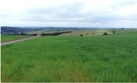
Flachwellige Gäulandschaft im Oberen Muschelkalk bei Lauda-Königshofen-Heckfeld

Kolluvien, die einen geringen bis mittleren, örtlich sogar hohen Skelettgehalt aufweisen, wurden hinsichtlich nFK und KAK nur als mittel bis hoch eingestuft. Sie besitzen immer auch einen karbonathaltigen Feinboden und kommen weit verbreitet in tief eingeschnittenen und hängigen Trockentälern sowie in Hangfußlagen und auf Schwemmfächern vor ( i64 , i68 ). Ein etwas eingeschränkteres Wasserspeichervermögen haben auch die nur mittel bis mäßig tiefen, von steinigen Fließberden unterlagerten Kolluvien in den Muldenanfängen und Hangmulden des Muschelkalkgebiets ( i69 ).