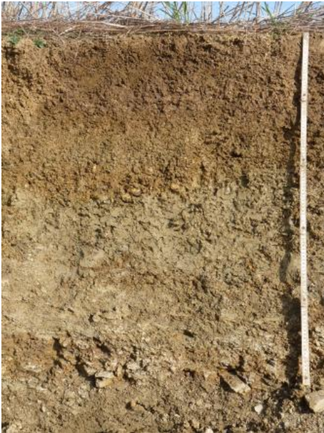
Pelosol auf einem kleinen Lettenkeupervorkommen westlich von Großrinderfeld (i23)

Etwas günstigere bodenphysikalische Eigenschaften als die Pelosole haben die oft ackerbaulich genutzten Pararendzinen ( i11 , i13 , i15 ). Sie sind besser durchwurzelbar und eher wasserdurchlässig. Wegen des häufig hohen Skelettgehalts und des oft oberhalb 1 m u. Fl. anstehenden Festgesteins liegt ihre nFK wie bei den Pelosolen meist im geringen bis mittleren Bereich. Bei hohem Steingehalt oder geringmächtigem Solum ist die nFK teilweise auch nur als sehr gering einzustufen. Häufiger ist dies bei den Kartiereinheiten i12 und i14 im Gebiet des Unteren Muschelkalks der Fall.