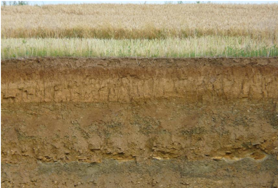
Lössbodenprofil bei Grünsfeld-Krensheim

geringer einzustufen als bei den Parabraunerden.