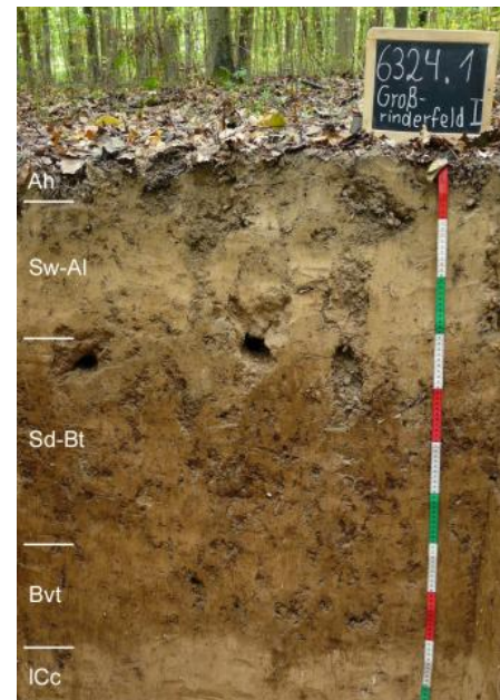
Parabraunerde aus Löss (i31)

Parabraunerden aus Löss und Lösslehm ( i30, i33, i31, i34, i32 ) sind tiefgründige, gut durchwurzelbare, steinfreie Lehm Böden mit günstigem Wasser-, Luft- und Nährstoffhaushalt. Sie zählen zu den besten Böden des Landes. Stellenweise weisen sie in Flachlagen und Mulden leichten Staunässeeinfluss auf. Die nFK und KAK sind als hoch bis sehr hoch einzustufen. Die schluffreichen Oberböden (Ap-/Al-Horizonte) sind stark erosionsgefährdet, neigen zu Verschlammung sowie Verkrustung und sind verdichtungsempfindlich. Meist sind die Al-Horizonte unter landwirtschaftlicher Nutzung stark verkürzt bzw. im Ap-Horizont aufgearbeitet oder vollständig abgetragen.