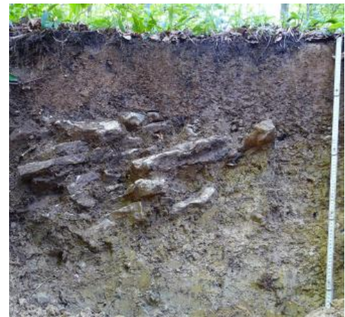
Braunerde-Terra fusca auf Oberem Muschelkalk (i50)

Die obersten 2–3 dm der Bodenprofile in KE i24 sind örtlich noch im Rest einer lösslehmhaltigen Deckschicht (Decklage) entwickelt, die andernorts durch Bodenerosion abgetragen wurde. Die Eigenschaften der Böden sind neben der Gründigkeit und dem Steingehalt besonders auch von dieser Deckschicht abhängig. Ist sie vorhanden, dann ist der Wasser- und Lufthaushalt sowie die Durchwurzelbarkeit als günstiger einzustufen. Am ehesten ist eine geringmächtige Decklage noch unter Wald ausgeprägt. Dort sind dann die Oberböden oft entkalkt und schwach bis stark sauer, während die Böden unter Ackernutzung überwiegend bereits an der Oberfläche karbonathaltig sind. Terrae fuscae und zweischichtige Braunerde-Terrae fuscae in meist bewaldeten Flachlagen konnten oft auch als eigene Kartiereinheit ausgewiesen werden ( i50 ). Eine ähnliche, im Unteren und Mittleren Muschelkalk vorkommende Bodengesellschaft wird in KE i51 beschrieben. Seltener treten Braunerde-Terrae fuscae mit ähnlichen Eigenschaften auch an bewaldeten Schatthängen des Baulands auf ( i28 ).