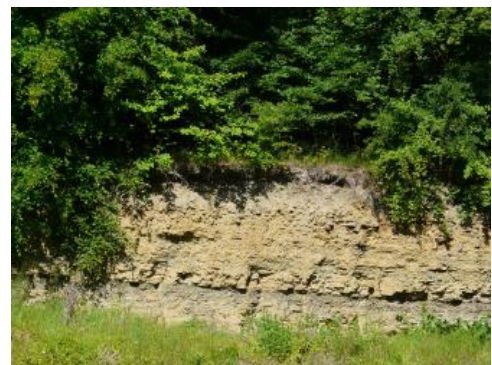
Lettenkeupergesteine bei Wittighausen-Vilchband

Abgesehen von den oben beschriebenen, im Karbonatgesteinsgebiet des Muschelkalks immer wieder vorkommenden Verwitterungsprodukten aus Tonmergelstein werden weitere 17 % der Bodengroßlandschaft von Pararendzinen und Pelosolen eingenommen, die sich auf tonig-mergeligen Substraten des Muschelkalks oder des Lettenkeupers (Unterkeuper, Erfurt-Formation) entwickelt haben ( i11 , i22 , i23 , i27 , i12 , i21 usw.). Im Lettenkeupergebiet ist zu berücksichtigen, dass mit dem kleinräumigen Gesteinswechsel auch die Böden und damit die Bodeneigenschaften engräumig wechseln können. So treten neben schweren Tonböden kleinflächig immer wieder auch flachgründige, steinige Böden auf Dolomitstein oder sandige Böden auf Sandstein auf.