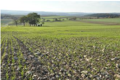
Blick vom Bauland bei Buchen-Hettingen nach Westen zum Odenwald

Im Verbreitungsgebiet des Oberen Muschelkalks ist eine Trennung der Ausgangsgesteine in Karbonatgestein einerseits und Ton- und Mergelgestein andererseits nur bedingt möglich. Die Kalksteine dominieren in der Schichtenabfolge zwar deutlich, liefern aber im Gegensatz zu den Tonmergellagen wenig Feinboden als Verwitterungsrückstand. An der Oberfläche ist oft ein kleinräumiger Wechsel der verschiedenen Substrate festzustellen. Häufig sind durch Kryoturbation und Solifluktion Mischprodukte aus den Verwitterungsbildungen von Kalk- und Mergelsteinen entstanden.