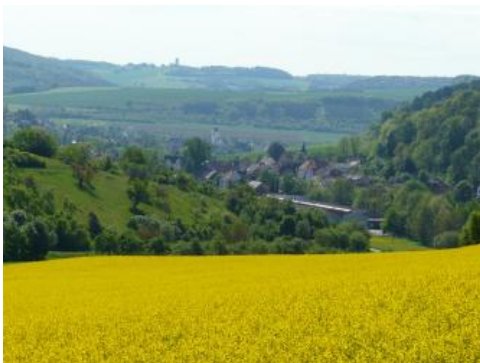
Zertaltes Muschelkalk-Hügelland bei Boxberg-Unterschüpf

Im Lössgebiet des Tauberlands treten immer wieder erodierte, meist karbonathaltige Böden aus geringmächtigen, mehr oder weniger skeletthaltigen Lössfließerden auf. Es handelt sich um Pararendzinen und stellenweise um stark erodierte Parabraunerden ( i18 , i39 , i17 , i19 ). Die an den Unterhängen des Taubertals oft vorkommenden Braunerde-Pararendzinen und Pararendzinen ( i18 ) besitzen ähnliche Eigenschaften wie die weiter oben beschriebenen Löss-Pararendzinen ( i16 ). Wegen des Skelettgehalts wurde das Wasserspeichervermögen etwas niedriger eingestuft. Der Steingehalt und die z. T. lehmigere Bodenart mindern bei diesen Böden die Erosionsanfälligkeit. In der im Hügelland vorkommenden Einheit i39 wechseln Pararendzinen und erodierte Parabraunerden und damit der Karbonatgehalt an der Oberfläche engräumig. Auch die starken Schwankungen hinsichtlich Mächtigkeit und Skelettgehalt der Lössfließerde haben große Spannen