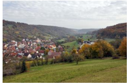
Blick ins Taubertal oberhalb von Creglingen-Archshofen

Auch die Hänge mit Gesteinsschutt aus Material des Oberen Muschelkalks wurden früher in weiten Bereichen Weinbaulich genutzt, wovon die zahlreichen die Hänge hinabziehenden Steinriegel zeugen. Die mit KE i6 abgegrenzten Hangbereiche sind i. d. R. nicht so steil wie diejenigen im Unteren Muschelkalk ( i4 ). Die Hangschuttdecken sind mächtiger und besitzen oft auch einen höheren Feinbodenanteil. Neben steinigen Rendzinen mit sehr geringer nFK kommen oft auch Pelosol-Rendzinen, steinige Pararendzinen und Rigosole vor, die ein etwas höheres Wasserspeichervermögen besitzen. Als Folge der Erosion sind die Böden meist bereits an der Oberfläche karbonathaltig. In einigen bewaldeten, v. a. im Bauland gelegenen Hangabschnitten, finden sich auch Böden, deren oberste 1–3 dm in einer entkalkten lösslehmhaltigen Deckschicht (Decklage) entwickelt sind ( i9 , Braunerde-Rendzina). In mächtigen steinigen Hangschuttdecken können Waldbäume durch ihre Fähigkeit, auch in grobem Substrat tief zu wurzeln, das geringe Wasserspeichervermögen etwas ausgleichen und haben somit bessere Wachstumsbedingungen als auf flachgründigen Böden der Hochflächen.