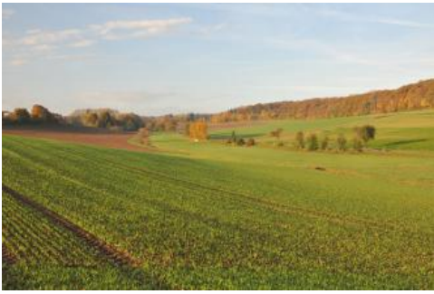
Oberlauf des Lochbachtals nordwestlich von Bad Mergentheim-Herbsthausen