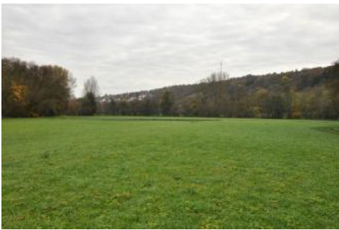
Durch Grünland genutzte ebene Talaue der Tauber bei Weikersheim (i80)

Den größten Flächenanteil bei den Auenböden hat KE i80 , die in der Talsohle der Tauber und deren Nebentäler sowie stellenweise in den Tälern des Baulands großflächig verbreitet ist. Die kalkhaltigen Braunen Auenböden (Vegen) weisen nur stellenweise im tieferen Unterboden Grundwassermerkmale auf. Es handelt sich um tiefgründige, auch im Unterboden sehr schwach bis mittel humose, kiesfreie bis schwach kiesige Lehm Böden mit oft hoher biologischer Aktivität. Die Böden sind gut durchlüftet, wasserdurchlässig und haben eine hohe bis sehr hohe nFK und KAK. Wegen der Überflutungsgefahr sind die agrarischen Nutzungsmöglichkeiten allerdings eingeschränkt, so dass das Grünland i. d. R. überwiegt.