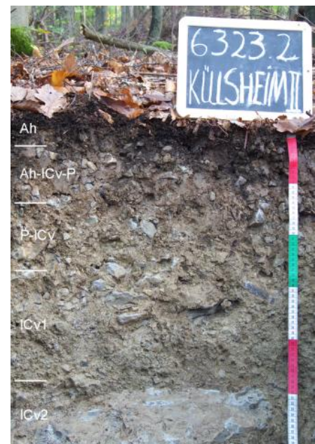
Pelosol-Pararendzina aus steiniger Fließerde (i12)

Den schwierigen Wasser- und Luftverhältnissen der Pelosole stehen bessere bodenchemische Eigenschaften wie etwa eine mittlere bis sehr hohe Kationenaustauschkapazität (KAK) gegenüber. Die Pararendzinen sind häufig bereits an der Oberfläche kalkhaltig, während die Pelosole und Pseudogley-Pelosole i. d. R. im Oberboden entkalkt und zumindest unter Wald mehr oder weniger stark versauert sind.