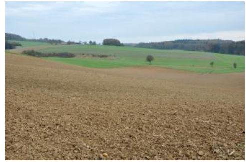
Das Bauland nordwestlich von Adelsheim