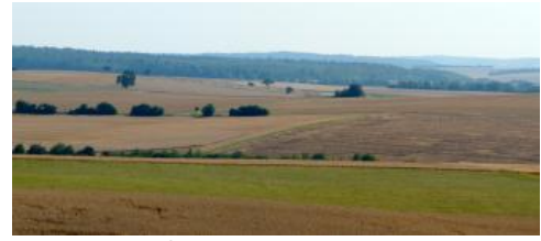
Flachhügelige Gäulandschaft im Tauberland nordöstlich von Tauberbischofsheim

Wo die Parabraunerden im Lössgebiet des nordöstlichen Tauberlands völlig erodiert wurden sind Pararendzinen verbreitet ( i16 ). Als Ackerböden haben sie ähnlich gute Eigenschaften wie die Parabraunerden. Auf Kuppen und an Oberhängen neigen sie im Sommer allerdings schnell zur Austrocknung und sind aufgrund des hohen Schluffgehalts und der strukturschwachen Oberböden erosionsanfällig. Außerdem schränkt der hohe Kalkgehalt die Nährstoffverfügbarkeit ein.