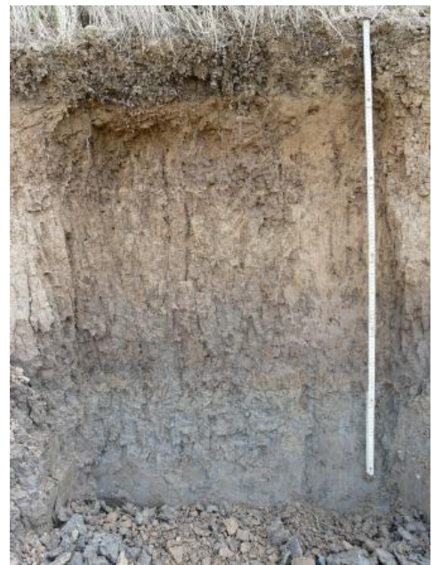
Pseudogley-Kolluvium über Pelosol-Pseudogley ( i73 )

Im Lettenkeupergebiet liegen die schluffig-lehmigen Abschwemmmassen oft über dichten, schwer wasserdurchlässigen Tonfließberden, was zu zeitweiliger Staunässe in den Böden führen kann (Pseudogley-Kolluvium, i70 , i73 ). Auch in dem von Lösslehm bedeckten Muschelkalkgebiet des Baulands haben die Böden der Muldentäler örtlich eine geringe Wasserdurchlässigkeit, da die Abschwemmmassen von dichtgelagertem Lösslehm oder Fließberden unterlagert werden (pseudovergleytes Kolluvium, i67 ).