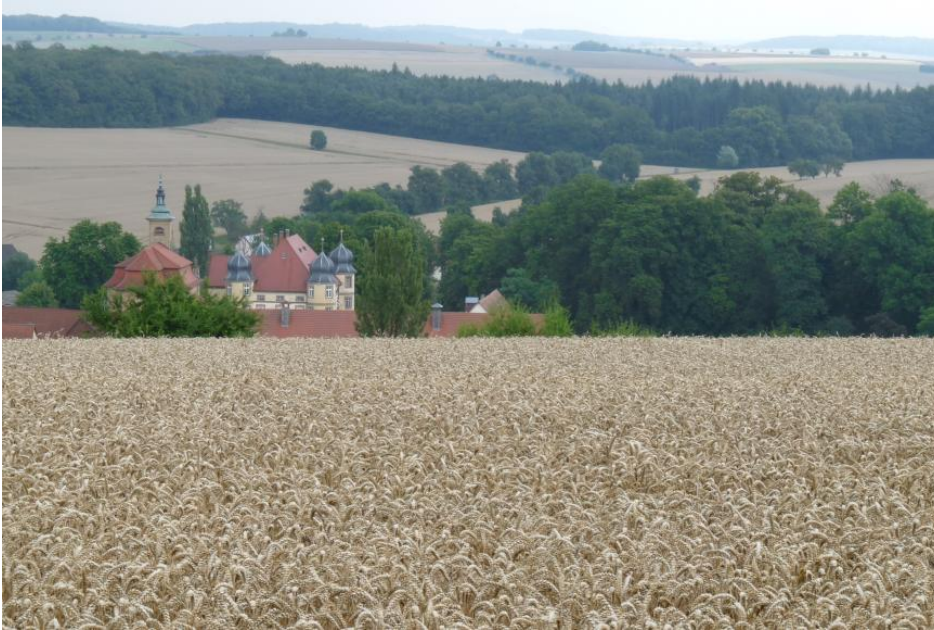
Blick von Südwesten über die Kocher-Jagst-Ebenen bei Dörzbach-Meißbach