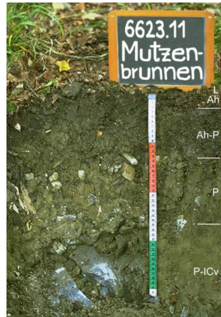
Flach entwickelter Pelosol aus toniger Muschelkalkfließerde bei Krautheim

Aufgrund der kleinräumig sehr stark wechselnden Anteile von Mergelstein- und Kalksteinverwitterungston im Feinboden sowie aufgrund von Unterschieden bei Steingehalt, Kalkgehalt und Entwicklungstiefe, werden große Flächen durch eine Sammeleinheit beschrieben ( J1 ). Allgemein besteht diese Pararendzina-Rendzina-Einheit aus flachgründigen, steinigten Tonböden aus Verwitterungsrückständen von Kalk- und Tonmergelsteinen. Sie beinhaltet sowohl Pelosole als auch Terrae fuscae als Übergangstypen, wobei letztere zumeist eher untypisch ausgebildet sind. Oft treten unter landwirtschaftlicher Nutzung Böden auf, in denen der Rest einer lösslehmhaltigen Decklage (Decklage, entspr. Hauptlage in Ad-hoc-AG Boden, 2005a, S. 180 f.) vollständig im Pflughorizont aufgearbeitet ist. Solche als Braune Rendzina angesprochene Böden besitzen im Vergleich zu Profilen mit vollständig erodierter Decklage einen schluffreichen, eher stein- und kalkarmen bis kalkfreien Oberboden. Bei Zweischicht-Böden unter Wald kann in dem geringmächtigen Rest der Decklage noch ein Bv-Horizont entwickelt sein, sodass sich dort zusätzlich auch Braunerden und Braunerde-Rendzinen bzw. Braunerde-Pararendzinen oder Braunerde-Pelosole bzw. Braunerde-Terrae fuscae finden.