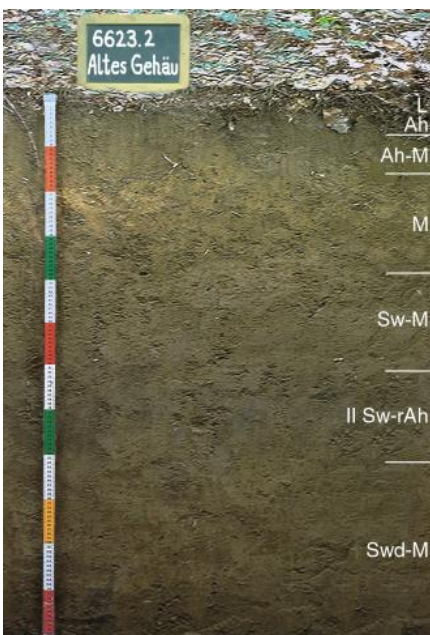
Tiefes pseudovergleytes Kolluvium aus schluffig-tonigen Abschwemmmassen in Trockentalmulden im Verbreitungsgebiet des Muschelkalks

Die zahlreichen Trockentalmulden der Muschelkalkhochfläche werden von mäßig tiefen und tiefen Kolluvien eingenommen, die als steinarme, humose Lehmböden zusammen mit den Parabraunerden die besten Ackerböden darstellen ( J24 ).