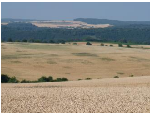
Getreideanbau auf den Kocher-Jagst-Ebenen bei Dörzbach

In gewölbten Scheitelbereichen und talrandnahen Verebnungen kommen im Vergleich zu den großen „Heckengäu“-Landschaften nur untergeordnet und kleinflächig steinige Rendzinen und Braunerde-Rendzinen vor ( J2 ).