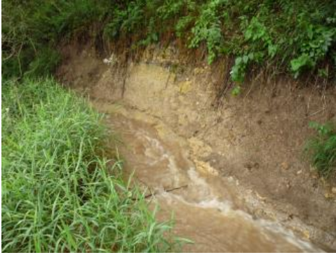
Prallhang des Echtbachs im Lettenkeuper. Der Echtbach ist ein Seitenbach der Bühler bei Vellberg-Talheim.

In schmalen Bachauen mit Einzugsgebiet in der Lettenkeuper-Landschaft ist der Auenlehm vor allem in lösslehmärmeren Gebieten etwas toniger und geringmächtiger. Die verbreitet vorkommenden Auengley-Braune Auenböden und Brauner Auenboden-Auengleye sind nur zum Teil karbonathaltig ( J76 ). In den oberen Abschnitten dieser Täler und an der östlichen Grenze der Bodengroßlandschaft zum Gipskeuperhügelland kommen bei vergleichsweise geringem Gefälle selten auch Auengleye und Auengley-Braune Auenböden aus schluffig-lehmigen Auenlehmen vor ( J291 ). Im Übergang zum Gipskeuper haben sich vergleichbare Bodentypen aus tonreichem Auenlehm gebildet ( J290 ). In Kartiereinheit J292 besteht das Substrat dagegen aufgrund von Einzugsgebieten mit deutlichem Lettenkeupersandstein-Einfluss aus sandigem Auenlehm. Daraus haben sich Braune Auenböden und Auengley-Braune Auenböden gebildet.