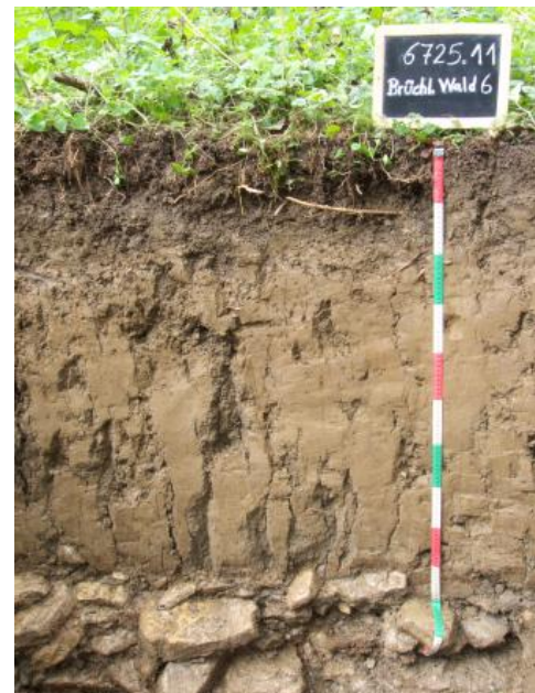
Karbonathaltiger Auengley-Brauner Auenboden (Vega)