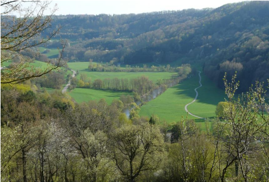
Kochertal bei Braunsbach-Döttingen

Feuchtere Auenböden mit Übergängen zum Auengley treten nur vereinzelt in schmalen Rinnen oder im Bereich von Quellaustritten im Unteren und Mittleren Muschelkalk am Auenrand auf. In den kleineren Nebentälern sind sie jedoch häufiger anzutreffen. Dabei handelt es sich um kalkreiche Brauner Auenboden-Auengleye und Auengleye aus Auenlehm ( J40 ). Im Bereich ehemaliger Randrinnen kann der Auenlehm von Altwassersedimenten unterlagert sein, die zu stark humosen und tonigen Unterböden führen (Humoser Auengley-Brauner Auenboden und Brauner Auenboden-Auengley ( J229 , ( J48 )). Extrem vernässte Bereiche mit Anmoorgleyen und Nassgleyen treten in diesen Kartiereinheiten nur selten auf.