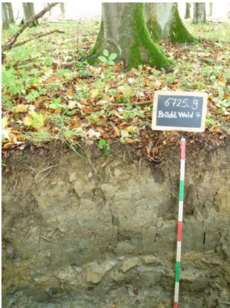
Pseudovergleyter Braunerde-Pelosol aus einer geringmächtigen lösslehmhaltigen Fließerde über einer tonigen Basislage über Gesteinszersatz des Lettenkeupers

Über die Hälfte der auf Karbonatgestein entwickelten Böden in der BGL Kocher-Jagst- und Hohenloher-Haller-Ebene liegen im Hangbereich der Muschelkalktäler. Pelosole (J1, J37) und Terrae fuscae (J45, J42, J86) als Leitbodentypen, zumeist als Übergang zu Pararendzinen oder Braunerden, stellen mit 56 % den größten Anteil der Böden auf Karbonatgestein dar. Wie im Kapitel zur Beschreibung der Bodenlandschaften diskutiert, ist aufgrund der kleinräumig sehr stark wechselnden Anteile von Mergelstein- und Kalksteinverwitterungston im Feinboden eine klare Trennung in Kartiereinheiten meist nur eingeschränkt möglich. Die Eigenschaften der Böden hängen folglich von zweierlei Faktoren ab: (1) Die Entwicklungstiefe und das Vorhandensein von Resten lösslehmhaltiger Deckschichten sowie (2) die Genese des tonigen Materials der Basislage durch Mergelstein- oder Kalksteinverwitterung.