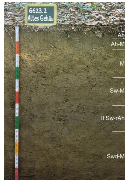
Tiefes pseudovergleytes Kolluvium aus schluffig-tonigen Abschwemmassen in Trockentalmulden im Verbreitungsgebiet des Muschelkalks

Im Muschelkalkgebiet spielt Staunässe und Grundwassereinfluss aufgrund der hydrogeologischen Eigenschaften des Muschelkalks eine vergleichsweise untergeordnete Rolle. Entsprechend sind hier mäßig tiefe bis tiefe Kolluvien mit nur geringer Pseudovergleyung und sehr guten Bodeneigenschaften am weitesten verbreitet ( J24 ). Sind diese Kolluvien karbonathaltig, wirkt sich das positiv auf die Nährstoffverfügbarkeit aus ( J49 ). Dennoch kommen auch Kolluvien mit Vergleyung im nahen Untergrund und Gley-Kolluvien vor ( J67 ). Im Vergleich zu entsprechenden Böden im Lettenkeupergebiet sind aufgrund des weniger tonreichen Substrats nFK und KAK etwas niedriger anzusetzen. Mittel tiefe Kolluvien nehmen einen geringeren Flächenanteil ein und sind häufig von Pelosolen oder Terraes fuscae unterlagert, weshalb auch die KAK hohe Werte erreicht ( J31 ).