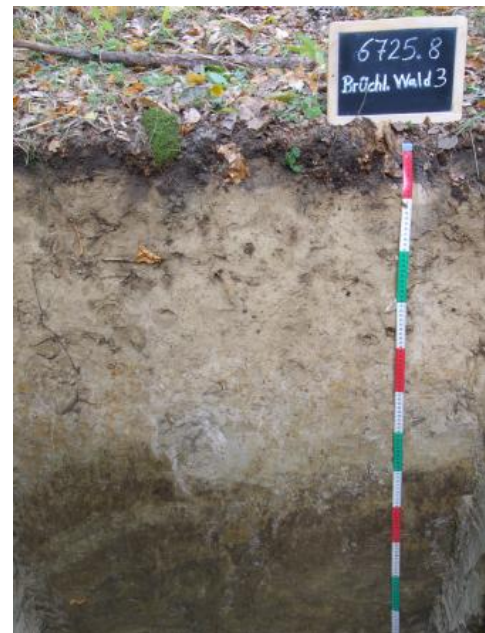
Podsolierter Pseudogley-Pelosol-Braunerde aus lösslehmreichen Fließerden über toniger Fließerde aus Lettenkeupermaterial

Eine deutliche Verbesserung der Eigenschaften toniger Böden ist dort gegeben, wo der Oberboden in einer lösslehmhaltigen Deckschicht (Decklage) entwickelt ist (zweischichtige Braunerde-Pelosole). Wo Deck- und Mittellage mächtiger als 3 dm werden, sind als Bodentypen Braunerden, Pelosol-Braunerden und Pelosol-Parabraunerden verbreitet ( J32, J305, J77, J365 ). Die lösslehmreichen Deckschichten bewirken im Vergleich zu den reinen Tonböden eine höhere nFK (mittel bis hoch) und eine bessere Durchwurzelbarkeit.