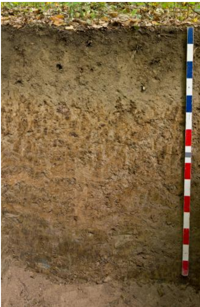
Parabraunerde-Pseudogley aus lösslehmreichen Fließerden über Ton-Fließerde aus Lettenkeupermaterial