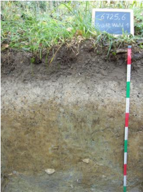
Braunerde-Pelosol-Pseudogley aus geringmächtigen lösslehmreichen Fließerden über Ton-Fließerde aus Lettenkeupermaterial

Den schwierigen Wasser- und Luftverhältnissen der Pelosole stehen bessere bodenchemische Eigenschaften wie etwa eine hohe bis sehr hohe KAK gegenüber. Die KAK der Pararendzinen liegt meist im mittleren bis hohen Bereich und damit etwas niedriger. Sie sind häufig bereits an der Oberfläche kalkhaltig, während die Pelosole und Pseudogley-Pelosole i. d. R. im Oberboden entkalkt und mehr oder weniger stark versauert sind.