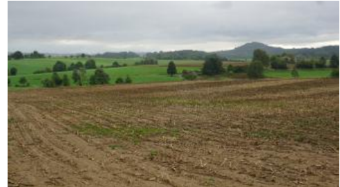
Östliches Albvorland bei Rainau Dalkingen – Vorne welliges, von Goldshöfe-Sand bedecktes Unterjura-Hügelland. Rechts hinten bewaldetes Mitteljura-Hügelland

Bei der am weitesten verbreiteten Kartiereinheit (KE) m51 handelt es sich um mäßig tief und tief entwickelte Braunerden aus lehmig-sandigem Bodenmaterial. Eine unterschiedliche Entwicklungstiefe der Böden mit teilweise nur mittlerer Solummächtigkeit ( m52 ) dürfte mit junger Bodenerosion auf den Ackerstandorten zusammenhängen. Unter Waldnutzung macht sich rasch Podsolierung im Bereich des sehr stark versauerten, mit nur geringer Pufferkapazität ausgestatteten Oberbodens bemerkbar ( m70 , podsolige Braunerde).