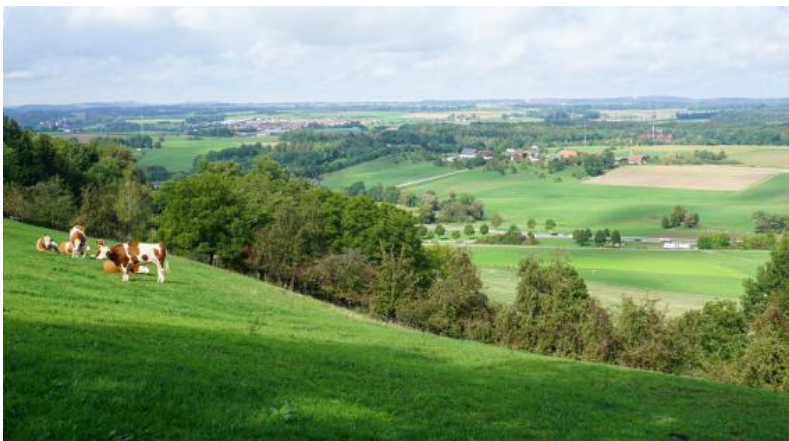
Blick von einer Hangkante im Eisensandstein am Albrand bei Aalen-Oberalfingen nach Nordwesten ins Albvorland – rechts im Mittelgrund liegt der Weiler Goldshöfe der für die Ablagerungen der Goldshöfe-Sande namensgebend war. Diese nehmen auf dem Scheitelbereich dieses Hügelrückens und auch links im Bild auf den Höhen um Hüttlingen große Flächen ein (Braunerde, Pseudogley -Parabraunerde; m51 ; m50 ; m99 ).

Die Sand- und Kiesablagerungen der früh- bis mittelpleistozänen Goldshöfe-Sande bilden auf den Höhen zwischen dem Oberen Remstal und dem Tal der Lein örtliche Vorkommen. Diese dehnen sich östlich, im Raum Aalen-Wasseralfingen, weiter aus und haben im Umfeld des Jagsttals zwischen Westhausen und Ellwangen sowie der aus östlicher Richtung einmündenden Seitentäler eine besonders große Verbreitung.