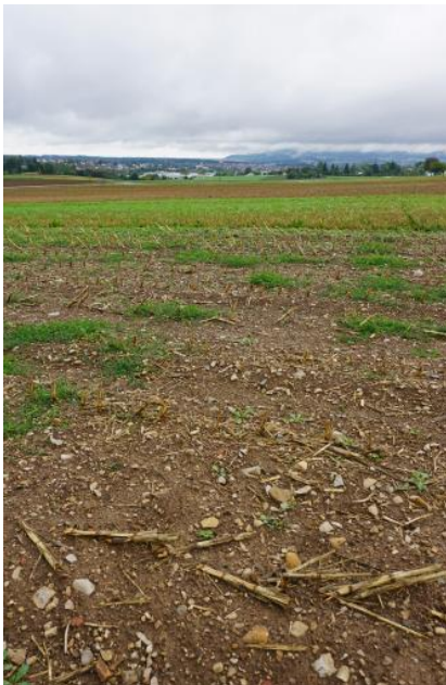
Feuerstein-, Sandstein- und Kalksteinschutt führende Fließberden am Fuß des Albtraufs, im Niveau der Goldshöfe-Sande (m98)

Auf breiteren Rücken und an schwach geneigten Hängen sind die Ablagerungen der Goldshöfe-Sande oft von mächtigen lösslehmhaltigen oder lösslehmreichen Fließberden (Deck- und Mittellage) mit Pseudogley-Parabraunerden und pseudovergleyte Parabraunerden ( m50 , m99 ) überdeckt. Als Staukörper wirken sich der z. T. dichtgelagerte Bt-Horizont oder örtlich auftretende tonige Fließberden im tieferen Unterboden aus. In einigen Flachlagen zwischen Aalen und Ellwangen ist die zeitweilige Staunässe in solchen Böden noch deutlicher ausgeprägt (Parabraunerde-Pseudogley, m95 ). Auf besser drainierten sandig-kiesigen Substraten sind dagegen Parabraunerden verbreitet, die nur örtlich eine schwache Pseudovergleyung aufweisen ( m94 ).