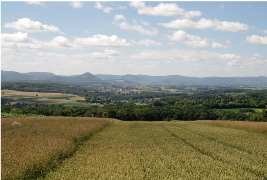
Blick von Altenriet in Richtung des Albanstiegs bei Reutlingen

Das Vorland der Mittleren und Westlichen Alb wird durch kleinere Flüsse zum Neckar entwässert. Unter ihnen sind die Lauter mit ihren verzweigt in das Kirchheimer Becken zurückgreifenden Quellflüssen, die Erms bei Metzingen, die bei Tübingen einmündende Steinlach, die Eyach bei Balingen und die Schlichem bei Schömberg die wichtigsten. Für das Fildergebiet ist v. a. das Körschtal als zentrale Tiefenlinie von Bedeutung.