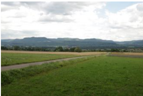
Stufenfläche der Unterjura-Schichtstufe – Blick über das Albvorland bei Dußlingen zur Schwäbischen Alb

Das Albvorland wird durch die Gesteine des Unter- und Mitteljuras bestimmt, die im Vorfeld der Schwäbischen Alb ausstreichen. Eine besondere landschaftsprägende Bedeutung kommt dabei harten Gesteinsbänken aus Sand- und Kalksteinen des tieferen Unterjuras zu, welche ausgedehnte Verebnungen hervorrufen. Diese bilden zugleich die Dachfläche der Unterjura-Schichtstufe, einem markanten Element der Südwestdeutschen Schichtstufenlandschaft. Die früher für die Gesteine des Albvorlands ebenfalls gebräuchlichen Begriffe Lias und Dogger sind heute nicht mehr zur Verwendung empfohlen, dagegen können die Bezeichnungen Schwarzer bzw. Brauner Jura weiterhin synonym für die Schichten des Unteren und Mittleren Juras eingesetzt werden.