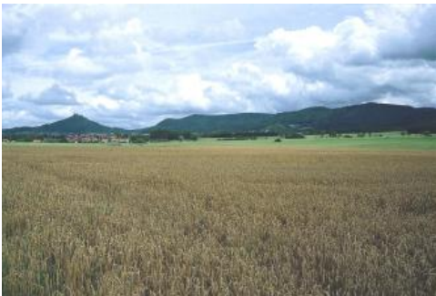
Ackerbaulich genutzte Ölschieferverebnung (Posidonienschiefer-Formation) bei Bisingsen- Steinhofen

Die im gesamten Albvorland landschaftlich eine bedeutende Rolle spielende Arietenkalk-Formation besteht aus einer rasch wechselnden Abfolge von Tonmergelsteinlagen und mehrere Dezimeter mächtigen Kalksteinbänken. Diese setzen sich hauptsächlich aus kalkigem Fossildetritus (Schalenbruchstücke etc.) zusammen, der durch Meeresströmungen und auch Stürme aufgearbeitet wurde. Die Arietenkalk-Formation besitzt im Fildergebiet eine Mächtigkeit von 10–15 m, nimmt in südliche Richtung ebenfalls deutlich ab und umfasst bei Balingen nur noch 4–5 m.