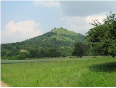
Die Vulkankuppe Limburg bei Weilheim an der Teck von Süden

Auf der Schwäbischen Alb machen sich die Vulkanschote zumeist als Geländedepressionen bemerkbar, die von abtragungsresistenteren Karbonatgesteinen umgeben werden. Im Albvorland hingegen treten die vulkanischen Röhren im Bereich von Vollformen auf, da die durch Kalziumkarbonat verfestigten Tuffbrekzien der Schlotfüllungen deutlich widerständiger gegen Erosion sind als die umgebenden tonig-mergeligen Gesteine des Mittel- und Unterjuras. Je nach Durchmesser der vulkanischen Röhren können die vulkanischen Vollformen im Vorland der Alb unterschiedliche Dimensionen annehmen und von kleinen Kuppen bis zu bergähnlichen Formen reichen. Bekannte Beispiele für letztere sind der markante Bergkegel der Limburg bei Weilheim a. d. Teck sowie der Jusi-Berg als eines der größten vulkanischen Gebilde des Urach-Kirchheimer Vulkangebiets. Aufgrund ihrer Kegelform besitzt die Limburg Ähnlichkeit mit einem typischen