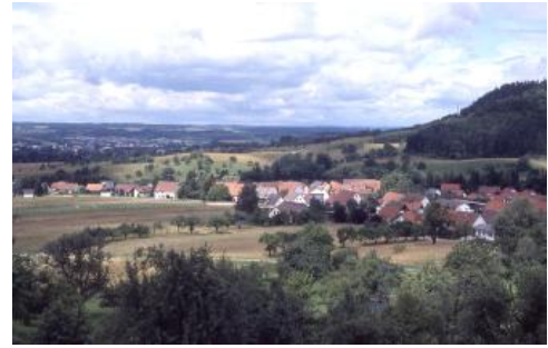
Albvorland östlich von Balingen

Für die landschaftliche Gliederung und die Reliefformung im Albvorland spielen die Lagerungsverhältnisse der geologischen Schichten teilweise eine erhebliche Rolle. Dies wird exemplarisch durch das intektonisch tiefer Lage vor der Abtragung relativ geschützte Vorspringen des Unterjuras im Fildergraben weit nach Nordwesten, bis in die Nähe von Stuttgart, verdeutlicht. Aber auch im kleineren Maßstab kommt der Schichtlagerung für die Ausbildung der Landschaftsformen eine wesentliche Bedeutung zu, so bei der Ausdehnung des Kleinen Heubergs in einer tektonischen Mulde zwischen Balingen und Schömberg. Auch die Entstehung der markanten Zeugenberge im Albvorland (Hohenzollern, Achalm) und des als Auslieger vom Albrauf vorspringenden Bergrückens der Teck ist auf ihre Lage in grabenartigen Tiefpositionen zurückzuführen.