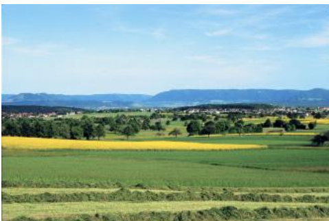
Mittleres Albvorland bei Walddorfhäslach

Die Festgesteine des Unter- und Mitteljuras bilden nur vereinzelt und meist in stark vom Menschen durch Bodenerosion beeinflussten Bereichen die Ausgangsgesteine für die Böden, die an solchen Stellen nur schwach entwickelt und wenig differenziert ausgebildet sind. Die natürlichen Böden entstanden überwiegend aus Lockergesteinsdecken, deren Entstehung mit typischen kaltzeitlichen geomorphologischen Prozessen wie Solifluktion („kaltzeitliches Bodenfließen“) und der Verwehung sowie Ablagerung von Gesteinsstaub durch den Wind zusammenhängt. Selbst in schon lange ackerbaulich genutzten Landschaftsbereichen bilden diese über dem älteren Gesteinsuntergrund lagernden periglaziären Deckschichten weitverbreitet das Ausgangsmaterial für die Böden. Ihr Aufbau und ihre Mächtigkeit wurden zwar durch den anthropogenen Bodenabtrag teilweise deutlich reduziert, jedoch war dessen Auswirkung selten so stark, dass sie komplett beseitigt wurden. Die Abtragungsprodukte der Bodenerosion finden sich in den aktuell und ehemals ackerbaulich genutzten Landschaftsbereichen in typischen Akkumulationspositionen, wie z. B. Hangfußlagen und in Muldentälern.