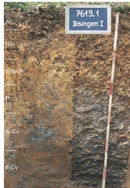
Mäßig tief entwickelter pseudovergleyter Braunerde-Pelosol aus lösslehmarmer Fließerde über periglazial umgelagertem Opalinuston auf Opalinustonzersatz

In etlichen weiteren Geländebereichen des von pelitischen Gesteinen des Mitteljuras aufgebauten Albvorlands kommen ebenfalls Pelosol-Braunerden vor, die allerdings von schwach bis örtlich deutlich erodierten Bodenformen begleitet werden, so von Braunerde-Pelosolen mit einem nur noch 1–3 dm mächtigen Bv-Horizont ( n64 , n112 , n113 ) oder stellenweise von Pelosolen, bei schon völliger Abtragung des schluffigen Bv-Horizonts in der Decklage. Stärkere Bodenerosion, auch in heute z. T. unter Wald gelegenen Reliefbereichen, führte zum weitflächigen Auftreten von Pelosolen ( n100 ), die teilweise noch durch Braunerde-Pelosole ergänzt werden ( n48 ) oder örtlich infolge bereits weiter fortgeschrittener Bodenerosion teilweise Übergänge zu Ah/C-Böden wie Pararendzinen zeigen ( n36 ).