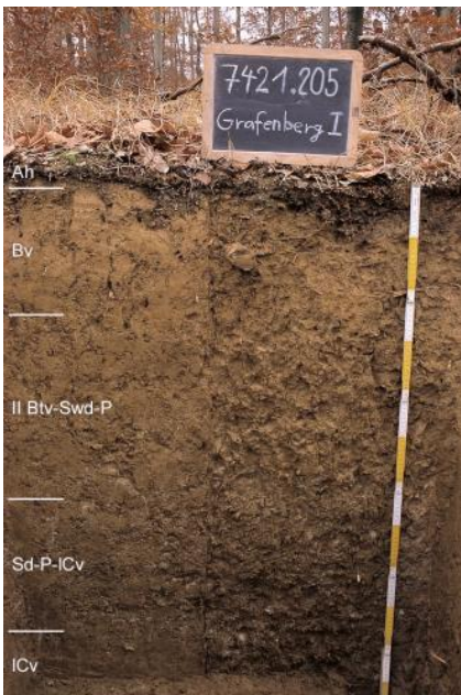
Pseudovergleyte Pelosol-Braunerde aus lösslehmhaltiger Fließerde über toniger Fließerde aus Mitteljura-Material