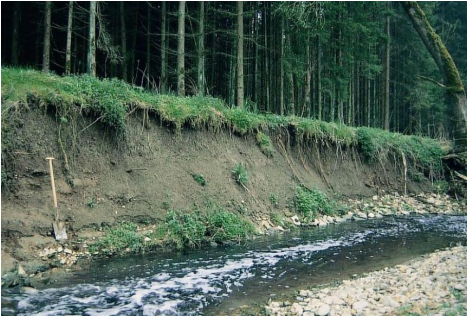
Kalkreicher Auengley-Brauner Auenboden aus mächtigem Auenlehm

Örtlich treten in Braunen Auenböden aus häufig tonreichen Auenlehmen durch zeitweiligen Luftmangel bedingte Staunässemerkmale auf. Bei nur mäßiger Intensität kommen Auenpseudogley-Braune Auenböden zusammen mit Braunen Auenböden vor ( n86 ), während bei vorherrschender Prägung des Bodenprofils durch Rost- und Bleichflecken Braune Auenböden-Auenpseudogleye vorliegen ( n89 ). Stellenweise, wie z. B. im Primal südöstlich von Rottweil, lagern Stauwasserhorizonte auch über Go- bzw. Gor-Horizonten von Gleyen ( n22 , Auenpseudogley-Auengley, Auengley-Auenpseudogley).