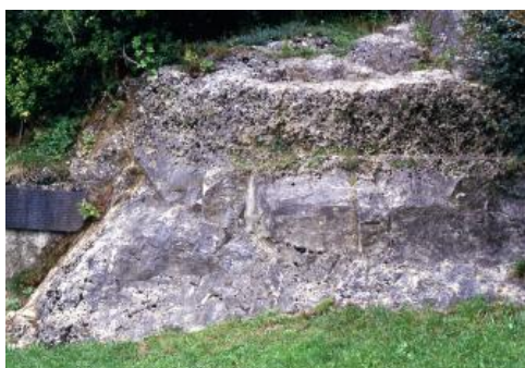
Miozänes Kliff des Molassemeeres mit Bohrmuschellöchern in Oberjura-Massenkalk in Gerstetten-Heldenfingen.

Weitere Informationen zu alt- und jungtertiären Paläoböden, insbesondere zu einer Schichtfolge, die in einem Steinbruch bei Heidenheim-Mergelstetten aufgeschlossen war, finden sich bei Kallis (2001) und Bleich (1994). Für die Bodenverhältnisse der Ostalb bedeutender ist das umgelagerte tertiäre Paläobodenmaterial der Feuersteinlehme, die weiter unten beschrieben werden.