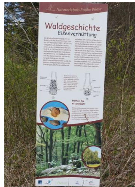
Informationstafel an der „Rauhen Wiese“ bei Böhmenkirch

In vorindustrieller Zeit war der Waldanteil auf der Ostalb sehr viel geringer. Der Großteil der Flächen wurde für den Ackerbau zur Selbstversorgung benötigt. Als Grünlandflächen spielten Schafweiden für die Wanderschäfererei eine bedeutende Rolle. Erst in der ersten Hälfte des 19. Jahrhunderts setzte mit der Industrialisierung und der sich ausbreitenden Textilindustrie ein Strukturwandel ein, in dessen Folge der Anteil der landwirtschaftlich genutzten Flächen stark zurückging (Mailänder et al., 2005). Die Wälder der Albhochfläche waren bis dahin durch die Waldweidenutzung sehr stark aufgelichtet, so dass zwischen Wald, Weide, Wiese und Acker oft fließende Übergänge bestanden. Erst nach Einführung der geregelten Forstwirtschaft sind wieder geschlossene Waldgebiete entstanden. Die ehemalige Waldweidenutzung und die früher ausgedehntere ackerbauliche Nutzung erklären das heutige Vorkommen erodierter Böden oder ehemaliger Ackerterrassen in den Wäldern auf der Albhochfläche. Neben dem Vieheintrieb hatten auch die Erzgräberei sowie v. a. die raubbauartigen Holzeinschläge für die Köhlereiwirtschaft ihren Anteil an der Zerstörung der Wälder. Das Brennmaterial wurde in großen Mengen für die in der Region ab dem 16. Jh. besonders intensiv betriebene Eisenverhüttung benötigt.