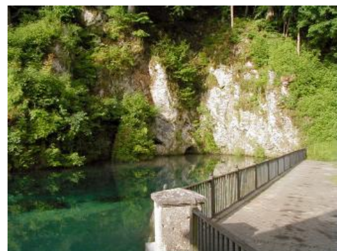
Der Brenztopf in Königsbronn

Aufgrund verstärkter Hebung im Pliozän und Pleistozän schnitt sich die Urbrenz stärker ein, verlor durch die rückschreitende Erosion der Neckarzubringer aber zunehmend große Teile ihres Einzugsgebiets. Zu Beginn des Mittelpleistozäns hatte der Kocher sich in den Norden des Durchbruchstals zurückgeschnitten. Die entstandene Talwasserscheide wurde in der Folge mit 50 m mächtigem Sediment von der Seite verschüttet. Kocher und Brenz entspringen heute aus Karstquellen bei Oberkochen bzw. in Königsbronn (Brenztopf).