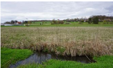
Niedermoor in der Egauaue südlich von Dischingen (o56)

Seit dem Eingreifen des Menschen durch Rodungen und landwirtschaftliche Nutzung findet auf den Äckern der Albhochfläche Bodenerosion statt. Die erosionsanfälligen lösslehmhaltigen Oberböden sind vielerorts im Laufe der jahrhundertelangen Nutzung der Erosion zum Opfer gefallen. Besonders bei sommerlichen Starkregenereignissen oder während Tauperioden im Winter, wenn das Wasser nicht in dem gefrorenen Boden versickern kann, wird bevorzugt Bodenmaterial abgespült. Das abgeschwemmte humose, lehmige Bodenmaterial ( holozäne Abschwemmmassen ) findet sich heute in den zahlreichen Trockentalmulden, Karstwannen und Hangfußlagen als Kolluvium wieder.