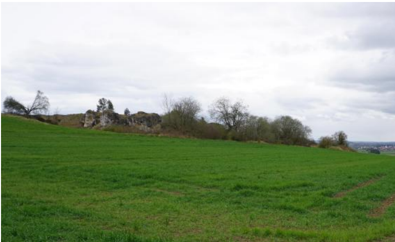
Aus der Landschaft aufragende, durch den Meteoriteneinschlag zertrümmerte und wieder verfestigte Oberjura-Schollen, die sogenannten Griesbuckel, prägen besonders in der Umgebung von Dischingen-Demmingen das Landschaftsbild. Die Kalksteinkuppen sind durch sehr flachgründige Böden, felsige Bereiche und alte Abbaustellen gekennzeichnet.

Katastrophale Auswirkungen hatten im Mittleren Miozän vor etwa 14,8 Mio. Jahren die beiden Asteroideneinschläge, die das Nördlinger Ries und das Steinheimer Becken schufen (Impaktkrater-Gruppe). Härtsfeld und Riesalb liegen am südöstlichen äußeren Rand des Rieskraters. Die damalige Flachlandschaft wurde großflächig mit Riesauswurfmassen ( Bunte Brekzie ) bedeckt und die anstehenden Oberjurakalke in brekziöse („Gries“) oder dicht geklüftete Kalksteinschollen umgewandelt. Ein Großteil der Überdeckung wurde im Laufe der späteren Landschaftsgeschichte abgetragen. Großflächig ist die Bunte Brekzie besonders in der wenig zertalten Hügellandschaft der Riesalb östlich des Egautals sowie bei Ober- und Unteriffingen verbreitet. Es handelt sich um wechselhaft zusammengesetzte Brekzien aus unterschiedlichsten Gesteinen der Trias und des Juras, an denen in geringerem Maß auch Kristallingestein beteiligt sein kann. Auch die Größe der Komponenten kann extremen Schwankungen unterliegen.