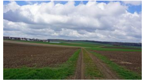
Blick nach Westen über die flachwellige Albhochfläche bei Oberiffingen, im Bereich der Bunten Brekzie (o74)

Die weitere Siedlungsentwicklung im Früh- und Hochmittelalter war kein ständiger Wachstumsprozess. Sie wurde von Phasen der Stagnation und Schrumpfung unterbrochen. Der Albuch und das nördliche Härtsfeld weisen im Landesvergleich eine starke Häufung von hauptsächlich spätmittelalterlichen Wüstungen auf (Grees, 1993).