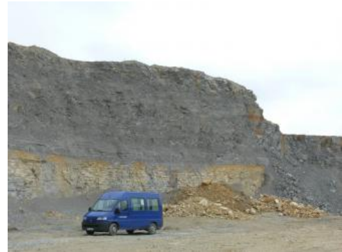
Zementmergel überlagern gebankte, tonige Kalksteine

Mehrere größere Vorkommen dickbankiger bis massiger pseudoolithischer Trümmerkalke, die mit Mergelsteinen und Bankkalken der Mergelstetten-Formation verzahnt sind, finden sich v. a. im Raum Heidenheim und sind in der Geologischen Karte als Brenzta-Trümmerkalk ausgewiesen.