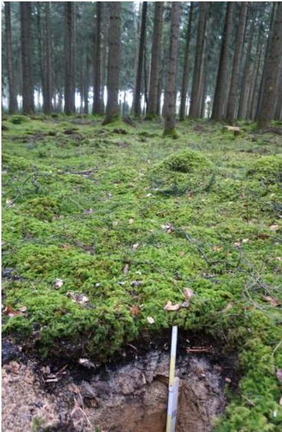
Fichtenwald auf stark podsolierten Böden aus Feuersteinschutt führenden Fließberden (o48)

Besonders die heute zu einem großen Teil bewaldeten ungünstigeren Böden auf Feuersteinlehm waren von einer dauerhaften Besiedlung ausgenommen. Sie waren aber im Mittelalter von vielen kleinen Weilern und Gehöften durchsetzt, auf die z. T. noch die Namen in der topographischen Karte hinweisen. Auch die im Wald erhaltenen, für die Alb typischen Hülben, die als Viehtränken und für die Wasserversorgung künstlich angelegt wurden, sowie alte Ackerbeete und Ackerraine belegen die früheren Ansiedlungen in den heutigen Waldgebieten (Grees, 1993).