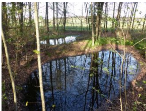
Mit Wasser gefüllte Bohnerzgruben bei Bopfingen-Aufhausen

Verbreitet sind die Hochflächen von Albuch und Härtsfeld von Bildungen des Tertiärs überlagert. Vermutlich ab der Oberkreide und während des Alttertiärs bildete sich im Bereich der Schwäbischen Alb unter tropischen Klimabedingungen ein ausgedehntes Flachrelief heraus (Rumpffläche), das von einer mächtigen Verwitterungsdecke überzogen war. Bei den wenigen noch erhaltenen Bildungen aus umgelagertem kaolinitischem Bodenmaterial, den sog. Bohnerztonen handelt es sich um oft rotbraune bis ockergelbe, tonige Substrate, die in wechselndem Maße Eisenkonkretionen (Bohnerze) führen (Tertiäre Residuallehme). Oft enthalten sie auch Beimengungen von Quarzsand, der eine hohe Verwitterungsintensität aufweist und vermutlich Reste umgelagerter kreidezeitlicher Sedimente darstellt (Borger, 1990). Bohnerzton wurde häufig im späteren Tertiär und im Pleistozän umgelagert und findet sich, zusammen mit jüngeren tertiären