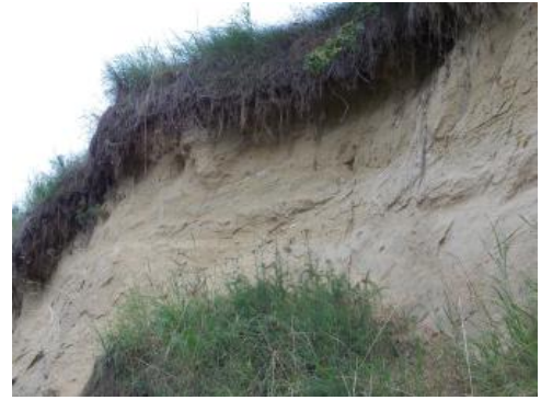
Sandgrube in der Oberen Meeresmolasse bei Dischingen-Ballmertshofen; Foto: Geopark Schwäbische Alb

Generell war die Klifflinie als Grenze zwischen Kuppenalb und Flächenalb ein Anhaltspunkt für die Abgrenzung der BGL Albuch und Härtsfeld von der BGL Südöstliche Alb. Da diese aber oft nicht als deutliche Geländekante ausgebildet ist, wurden im Einzelfall andere nahe gelegene Reliefformen, wie Taleinschnitte, zur Abtrennung herangezogen. Auf der Riesalb im Osten, wo das ehemalige Kliff durch Riesauswurfmassen verhüllt ist, reicht die Bodengroßlandschaft bis an die Grenze zu Bayern. Aus diesen Gründen wurden die besonders am Südostrand der Bodengroßlandschaft stellenweise vorkommenden sandigen Sedimente der Oberen Meeresmolasse in das Gebiet mit einbezogen.