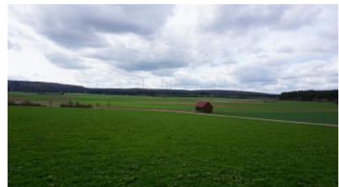
Die Rauhe Wiese bei Böhmenkirch-Heidhöfe – Blick nach Westen über die flache, mit Feuersteinlehm plombierte Karstwanne

Die abgelegenen Hochflächen im Albuch bei Böhmenkirch, Lonsee und Gerstetten sowie auf dem Härtsfeld bei Neresheim und auf der Ries-Alb bei Dischingen sind relativ dünn besiedelt und ländlich geprägt. Der dazwischen gelegene Talzug von Kocher und Brenz mit dem Mittelzentrum Heidenheim und der sich bis nach Aalen erstreckenden Siedlungs- und Industriegasse mit den Gemeinden Königsbronn und Oberkochen wird dagegen in der Raumordnung als Verdichtungsbereich im ländlichen Raum ausgewiesen. Dazu gehören auch weitere auf den angrenzenden Hochflächen gelegene Gemeinden wie Steinheim am Albuch und Nattheim. Ganz im Westen grenzt die Bodengroßlandschaft mit dem Talraum bei Geislingen an der Steige bereits an den Verdichtungsraum Stuttgart.