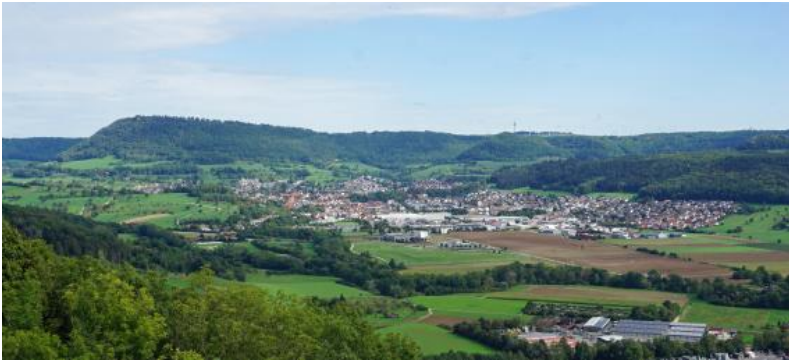
Blick auf den Albtrauf am Nordwestrand des Albuchs bei Donzdorf – Links blickt man auf den Messelberg. Der Sendemast rechts der Mitte steht auf der Albhochfläche bei Böhmenkirch-Schnittlingen.

Im Vergleich zur Westalb und Mittleren Alb wurde die Ostalb weniger starktektonisch herausgehoben, was sich in einer geringeren Höhendifferenz am Albtrauf und geringeren absoluten Höhen der Hochflächen bemerkbar macht. Auf den Kuppen des Albuchs liegen die Höhen meist zwischen 600 und 700 m ü. NHN. In Traufnähe treten z. T. Erhebungen bis über 770 m ü. NHN auf (Kaltes Feld, 781 m ü. NHN). Die Höhen auf dem nördlichen Härtsfeld liegen bei 630–730 m ü. NHN. Nach Südosten fällt das Gelände dann allmählich bis auf unter 500 m ü. NHN im Bereich der Riesalb ab.