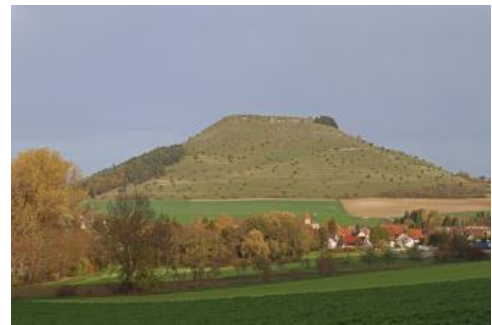
Der Ipf bei Bopfingen