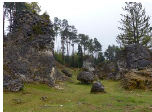
Felsbildungen im oberen Wental südöstlich von Bartholomä

Wie das Längental, sind auch die anderen im Plio-/Pleistozän gebildeten, auf die Brenz eingestellten engen Taleinschnitte des Albuchs aufgrund der Verkarstung heute Trockentäler (Stubental, Wental, Oberläufe des Hungerbrunnentals). Die im Talboden stehenden bizarren turmartigen Dolomifelsen im oberen Wental, die bei der Taleintiefung aufgrund ihrer relativen Härte erhalten gebliebenen sind, gelten als geologische Besonderheit des Albuchs. Im Südwesten des Härtsfelds führen kurze enge Trockentalzüge zum Brenztal hinunter. Der weit größte Teil des Härtsfelds wird jedoch von ausgedehnten verzweigten flachen Trockentälern durchzogen, die alle ins Egautal münden und in ihren Unterläufen zeitweise Wasser führen. Das Egautal selbst ist erst ab Neresheim ständig wasserführend. Das Verbreitungsgebiet der Bunten Breckzie auf der Ostalb liegt ebenfalls größtenteils im Einzugsgebiet der Egau. Dort finden sich örtlich schwach schüttende Quellen sowie Wassergräben und kleine Bachläufe, die z. T. beim Übertritt in den verkarsteten Oberjura wieder versickern.