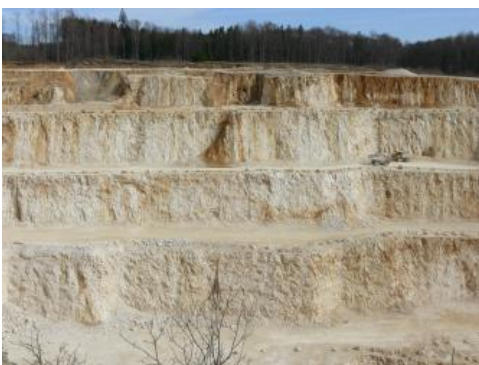
Massenkalk-Formation, Steinbruch Waibertal, nördlich von Heidenheim

Zum Karstformenschatz gehören neben den Trockentälern auch zahlreiche Dolinen und weitere abgeschlossene Hohlformen unterschiedlichster Größenordnung. Große Karstwannen mit mächtiger Lehmverfüllung sind z. B. die Rauhe Wiese bei Böhmenkirch oder die Ebnater Karstwanne südlich von Aalen-Ebnat.