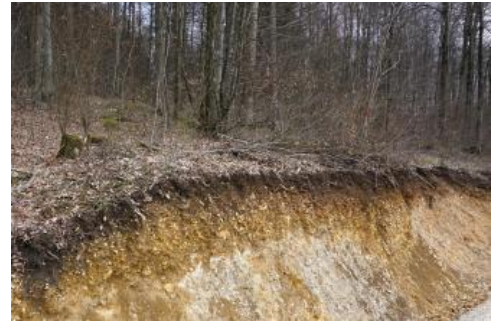
Rendzina aus geringmächtigem Oberjura-Hangschutt auf Unterem Massenkalk nördlich von Bopfingen-Michelfeld (o3)

Auch an den Hängen des Albtraufs und der Albtäler ist das anstehende Juragestein überwiegend von mächtigen quartären Deckschichten verhüllt. Es handelt sich dort um einen groben Gesteinsschutt, der als Hangschutt bezeichnet wird. Gebildet wurde er v. a. im Pleistozän durch Frostverwitterung, Felsstürze, Steinschlag und Schuttrutschungen. Weitere Prozesse wie Solifluktion, Abschwemmungen und Muren brachten den Schutt bis in tiefere Hangpartien. An Mittel- und Unterhängen des Albanstiegs, die von Mergelsteinen des obersten Mitteljuras und des Unteren Oberjuras gebildet werden, sind mächtige, tonreiche, oft Kalksteinschutt führende Fließerden verbreitet (Basislage). Häufig werden sie von Hangschuttdecken unterschiedlichster Mächtigkeit überlagert. Kalksteinschutt führende, tonig-mergelige junge Rutschmassen treten als Ausgangsmaterial der Bodenbildung nur an wenigen Stellen in Erscheinung. Ihr Vorkommen beschränkt sich auf die nordwestlichen Traufhänge des Albuchs zwischen Geislingen an der Steige und Heubach-Lautern.