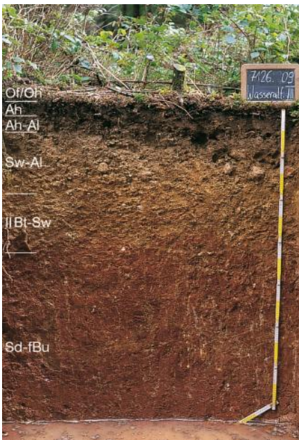
Tief entwickelte Pseudogley-Parabraunerde aus Feuersteinschutt führender Deckschicht über Feuersteinlehm (o84; Musterprofil 7126.9)

Besonders im Norden der Bodengroßlandschaft, zwischen Böhmenkirch und den Hochflächen östlich von Aalen haben die für die Ostalb charakteristischen rötlichen und ockerfarbenen Feuersteinlehme eine große Verbreitung (Tertiäre Residuallehme). Die früher übliche Trennung in Feuersteinrotlehm und Feuersteinockerlehm (Müller, 1958; Dongus, 1977, S. 401 ff.) gilt als überholt, da beide Varianten meist zusammen vorkommen (Bleich & Kuhn, 1990; Etzold, 1994).