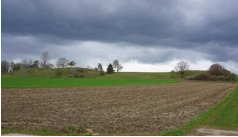
Oberjura-Schollen auf der Riesalb (Griesbuckel) mit flach und sehr flach entwickelte Rendzinen (o6)

Exponierte Kuppen und Hanglagen mit flach und örtlich sehr flach entwickelten Rendzinen, die oft mit Wacholderheiden, extensivem Grünland oder Wald bestanden sind, wurden als eigene Kartiereinheit o6 ausgewiesen. Diese Einheit wurde auch für die Böden im Bereich von Oberjuraschollen der Riesalb, den sog. Griesbuckel, verwendet. Als weitere kleinflächig vorkommende Rendzina-Einheiten konnten Terra fusca-Rendzinen auf Dolomit- und Kalkstein im Oberjura-Massenkalk ( o80 ) sowie Rendzinen auf Kalksteinen und tonigen Kalksteinen der Mergelstetten-Formation abgegrenzt werden ( o67 ).