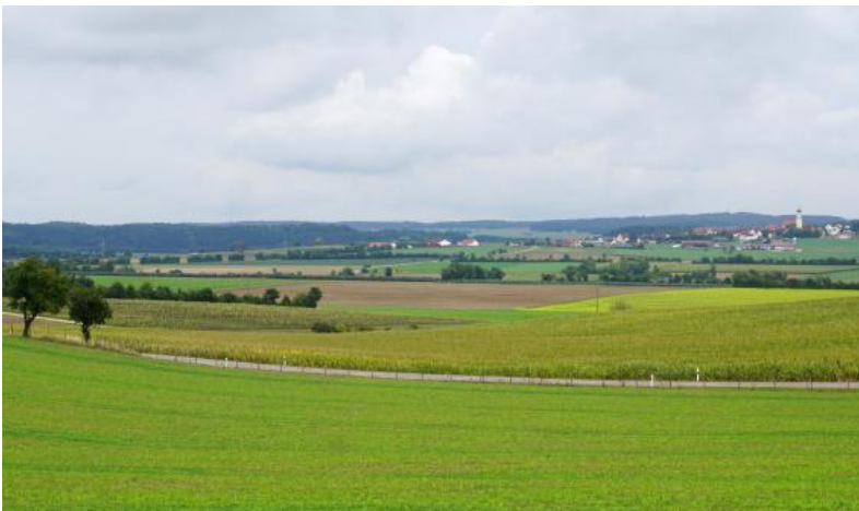
Flachkuppige Albhochfläche auf dem Härtsfeld bei Neresheim-Ohmenheim – Blick vom Greutbuck bei Dorfmerkingen nach Südosten

Im Süden von Albuch und Härtsfeld ist in flachen Scheitellagen und an schwach geneigten Hängen auf Mergelsteinen und Mergelkalksteinen der Mergelstetten-Formation häufig ein Wechsel von Pararendzinen und Rendzinen anzutreffen ( o7 ). Oft sind es flachgründige Böden, die direkt im anstehenden Gestein entwickelt sind. Teilweise handelt es sich aber auch um mäßig tiefgründige Böden aus steinigen Fließerden. Dieselbe Einheit wurde auch an den Traufhängen verwendet, wo im Bereich schmaler Rücken und Hangverflachungen Mergelsteine der Lacunosamergel-Formation und örtlich der Impressamergel-Formation anstehen.