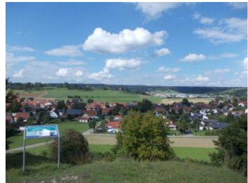
Blick über das Steinheimer Becken vom Burgstall bei Sontheim im Stubental nach Norden (Steinheim am Albuch)

Eine Besonderheit bei Steinheim am Albuch sind die an den Kraterhängen und am Zentralhügel des Steinheimer Beckens verbreiteten Seeablagerungen. Vorherrschende Böden in den kalkigen Sedimenten sind Rendzinen und Pararendzinen ( o43, o44 ). Gründigkeit und Steingehalt der kalkreichen Böden schwanken stark. Ihre nutzbare Feldkapazität liegt im sehr geringen bis mittleren Bereich. Im Gipfelbereich des Zentralkegels treten schwere Tonböden aus Mitteljura-Material auf (Pelosol und Braunerde-Pelosol, o42 ) und in den Tiefenbereichen finden sich geringmächtige und von Schwemmschutt unterlagerte kalkhaltige Kolluvien ( o39, o40 ). Im Ostteil des Beckens („Ried“) führte hochstehendes Grundwasser zur Bildung von humosen Gleyen und Anmoorgleyen ( o41 ).