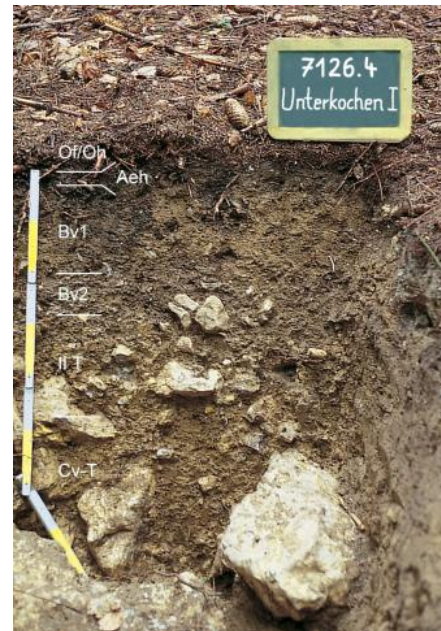
Mäßig tief entwickelte podsolige Braunerde-Terra fusca aus Feuersteinschutt führender Deckschicht über Dolomitstein-Verwitterung (o91)

Die in der weit verbreiteten Kartiereinheit o21 meist 5–10 dm mächtigen Feuerstein führenden lösslehmreichen Deckschichten werden von Fließerden aus Rückstandston der Karbonatgesteinsverwitterung bzw. Feuersteinlehm unterlagert. Meist sind die Böden tief entkalkt und besitzen unter Wald stark versauerte Oberböden. Nur stellenweise treten unterhalb 7–10 dm u. Fl. karbonathaltige Kalkstein führende Fließerden auf. In Abhängigkeit von der Mächtigkeit der lösslehmreichen Fließerden und dem Grad der Lessivierung wechseln Parabraunerden, Braunerde-Parabraunerden, Braunerden und Terra fusca-Parabraunerden. Als tiefgründige, gut durchwurzelbare Böden mit ausgeglichenem Wasser- und Lufthaushalt gehören sie zu den besseren Böden der Ostalb-Hochfläche (nFK mittel bis hoch). Im Randbereich der Hochflächen und an Oberhängen gilt dies allerdings nur eingeschränkt. Die lösslehmhaltige Decklage führt dort z. T. sehr viel Feuersteinschutt und ist nur 1–6 dm mächtig. In 5–10 dm Tiefe kann im Übergang zum Festgesteinszersatz bereits steinigtes karbonathaltiges Bodenmaterial auftreten ( o85 , o91 , Braunerde-Terra fusca und Terra fusca-Braunerde).