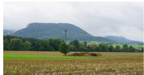
Albrauf bei Heubach – Blick von der Remsau unterhalb von Essingen nach Südwesten zum Rosenstein und rechts hinten zum Scheuelberg

Aus der abgestorbenen organischen Substanz bildet sich bei ständiger Kalknachlieferung ein schwarzer Ah-Horizont mit einem lockeren Bodengefüge aus stabilen Krümeln mit reichem Bodenleben und hohem Nährstoffumsatz. Die Mull-Rendzinen aus Kalksteinschutt können aufgrund ihres günstigen Gefüges mehr pflanzenverfügbares Wasser speichern als vergleichbare flachgründige Böden aus anderem Festgestein. Das hohe Stickstoffangebot wird in den Laub- und Mischwäldern durch eine artenreiche Bodenflora angezeigt. Unter Nadelwald treten auch mullartiger Moder und Moder als Waldhumusform auf. Trockene Standorte finden sich besonders in den obersten Hangabschnitten, wo der Hangschutt ausdünnt und Karbonatgestein in Oberflächennähe ansteht. Im Bereich von Felsen und jungen Schutthalden treten begleitend Extremstandorte mit Felshumusböden, Skeletthumusböden, Syrosemen und Lockersyrosemen auf. Als eigene Kartiereinheit wurden solche flachgründigen Trockenstandorte in KE o11 ausgewiesen.