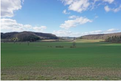
Trockental zwischen Amstetten-Bahnhof und Lonsee-Urspring (Längental)

In den Trockentalmulden der Albhochfläche finden sich verbreitet tiefgründige Lehmböden aus abgeschwemmtem Bodenmaterial, die bis in den Unterboden einen geringen bis mittleren Humusgehalt aufweisen (Kolluvien, o8 , o4 , o30 ). Zusammen mit den Parabraunerden aus Lösslehm und lösslehmreichen Fließerden sind sie die günstigsten Böden für die Land- und Forstwirtschaft in der Bodengroßlandschaft. Deutlich ungünstigere Eigenschaften haben die nur mittel und mäßig tiefen kalkhaltigen, z. T. steinigen Kolluvien im Verbreitungsgebiet von Mergel- und Kalkmergelsteinen auf der Albhochfläche ( o24 ). Das Solum ist deutlich toniger und im Unterboden oft nur mäßig durchwurzelbar. Die nFK ist mit 50–90 mm als gering einzustufen.