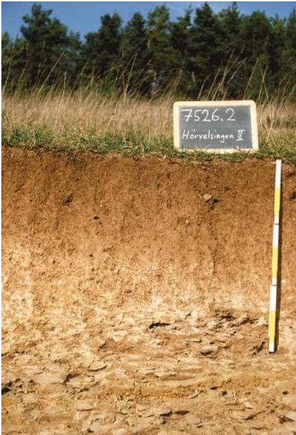
Pararendzina aus Kalkmergelstein der Mergelstetten-Formation (p161) bei Langenau-Hörvelsingen

Pararendzinen aus anstehendem Mergelstein ( p161 ) treten örtlich nur begrenzt auf und sind ausschließlich am Südhang des Ofenlochs bei Langenau-Hörvelsingen sowie am Abhang des unmittelbar westlich folgenden Ägenbergs lokalisiert. Nur stellenweise haben sich im Verbreitungsgebiet der pelitischen Gesteine der Mergelstetten-Formation die tonigen Unterböden von typischen Pelosolen und Braunerde-Pelosolen ( p39 ) kleinflächig erhalten. Sie stellen Rudimente der ursprünglich weit verbreiteten Pelosole dar, die im Zuge langanhaltender Ackernutzung sukzessive abgetragen und schließlich durch Pararendzinen als Erosionsformen ersetzt wurden.