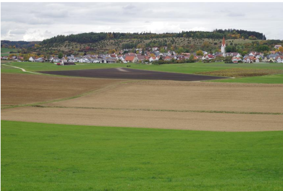
Zementmergel-Schüssel von Langenau-Hörvelsingen mit ehemaligem Niedermoor im zentralen Tiefenbereich (p8); im Hintergrund die Erhebung des „Ofenlochs“ aus Schichten der Mergelstetten-Formation des Oberjuras

Eine Besonderheit im Bereich der Ulmer Alb ist die erosive Ausraumform der Zementmergelschüssel bei Langenau-Hörvelsingen mit ihrem grundwassererfüllten Tiefenbereich. Aufgrund des ursprünglich bis an die Geländeoberfläche reichenden Grundwasserspiegels kam es im zentralen Teil zur Bildung eines Niedermoores.