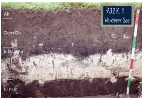
Kalkgley über Kalkanmoorgleye auf Niedermoor ( p179 )

Im früher von der Brenz durchflossenen Tiefenbereich treten großflächig Kalkgleye aus limnischen Ablagerungen über Niedermoor auf ( p179 ).