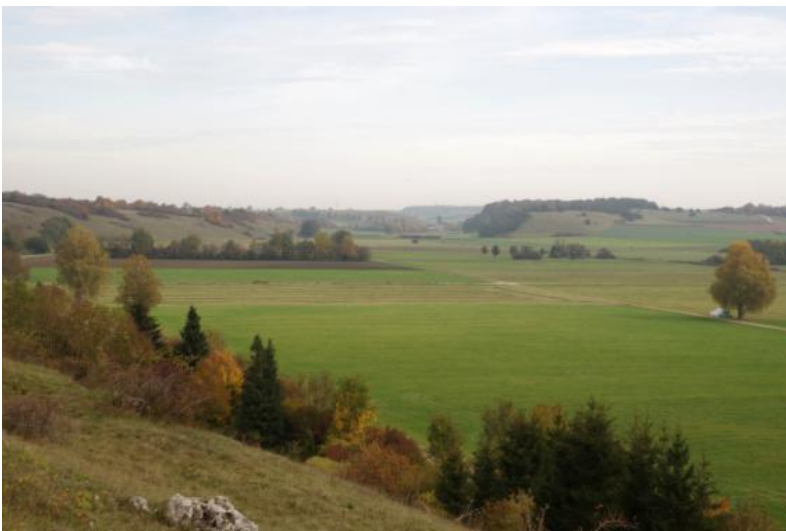
Zementmergelschüssel „Vorderer See“ östlich von Giengen an der Brenz-Hürben

Im aktuell von der Brenz durchflossenen Talzug sowie entlang der Hürbe zwischen Giengen-Hürben und -Burgberg ist KE p178 hauptsächlich in den engeren Tiefenbereichen verbreitet. Dabei handelt es sich um kalkreiche Auengleye mit heute noch stark bis sehr stark humosem Oberboden. Verbreitet werden sie ab ca. 3 dm bis etwa 7 dm u. Fl. von geringmächtigen Niedermoorhorizonten und von Wiesenkalk ehemaliger Kalkgleye unterlagert. Aufgrund flächiger Grundwasserabsenkung und mittlerer Grundwasserstände, die sich heute nur selten oberhalb von 6 dm u. Fl. bewegen, ist die Vergleyung der stark bis sehr stark humosen semiterrestrischen Böden überwiegend reliktsicher Natur. Es ist anzunehmen, dass die Humusgehalte früher deutlich höher waren und mit der Ausbildung von Anmoor- und Moorgleyen sowie geringmächtigen Niedermooeren einhergingen.