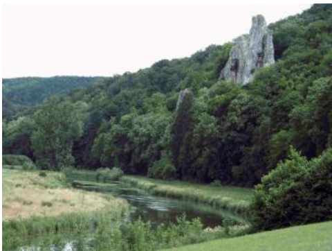
Blautal östlich von Blaubeuren-Gerhausen mit Felsbildung am Prallhang (Oberjura-Massenkalk-Formation) und nassen Auenböden

Die Bodenlandschaft im Bereich der Tertiärrücken von Landgericht und Hochsträß sowie ihrer Vorgelände wird maßgeblich auch durch grundwasserbeeinflusste Böden der Täler geprägt.