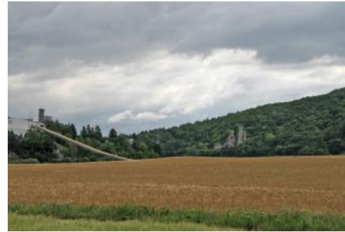
Getreidefeld auf einem Schwemmfächer (p29) im Blautal östlich von Blaubeuren-Gerhausen

Noch stärker macht sich die Ablagerung von jungen, aus der Bodenerosion stammenden holozänen Abschwemmmassen in den Randbereichen des Blautals dort bemerkbar, wo mächtigere Schwemmfächer und Schwemmkegel auftreten, die sich mit ihrem Aufschüttungskörper aus dem Grundwasserbereich erheben und örtlich sogar bis weit in den zentralen Auenbereich vorrücken ( p29 ; mittel und mäßig tiefes Kolluvium sowie Rendzina aus Schwemmschutt). Ähnliches gilt für Schwemmschuttablagerungen, die aus Kerben und steilen Hangtälchen in die Talaue geschüttet wurden ( p125 , Pararendzina und Rendzina) und dabei vereinzelt, wie im Gewann „Steiner Ösch“ östlich von Schelklingen, fast den Gegenhang erreicht haben.