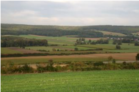
Das untere Schmiechtal zwischen Allmendingen und Ehingen a. d. Donau

Das Biberbachtal westlich von Riedlingen ist stark durch zufließende karbonatreiche Wässer aus der angrenzenden Alblandschaft geprägt, was sich in insgesamt hohen Karbonatgehalten der Böden zeigt und sich in der Aufschüttung der schwemmkegelartigen Bildung aus jungem, teilweise verschwemmtem Süßwasserkalk ( p170 , Rendzina) am Übergang des Biberbachtals in die Donauaue äußert. Für den größeren Teil der Aue des Biberbachs, die im östlichen Laufabschnitt aufgrund glazifluvialer Vorprägung in einen weiten, ebenen Tiefenbereich übergeht, sind kalkreiche Auengleye, teilweise über Niedermoor charakteristisch ( p280 ). Östlich von Langenenslingen-Andelfingen werden diese bereichsweise von Braunen Auenböden und Auengley-Braunen Auenböden über Kalkgleyen ergänzt ( p281 ). Westlich von Andelfingen ist das Niedermoor im Biberbachtal teilweise nicht überdeckt und liegt als anthropogen stark überprägtes Erdkalkniedermoor vor ( p291 ).