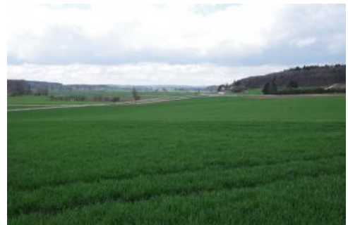
Das untere Brenztal unmittelbar nördlich von Sontheim a. d. Brenz

Das Lonetal durchzieht die Flächenalb über eine Entfernung von etwa 25 km in West–Ost-Richtung, ungefähr parallel zum Südrand der Alb an der Grenze zum Donautal. Ab Lonsee-Ursprung beginnt Wasserführung, die jedoch in längeren Trockenperioden streckenweise aussetzen kann. Die Lone mündet schließlich zwischen Giengen-Burgberg und -Hürben in einen ehemaligen Talverlauf der Brenz, der heute von der Hürbe, einem kleineren Fließgewässer durchströmt wird.