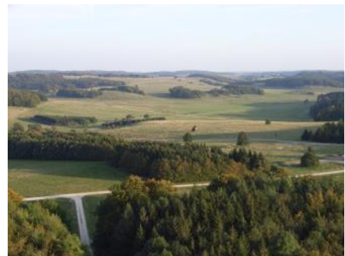
Blick über den ehemaligen Truppenübungsplatz Münsingen südlich von Römerstein-Zainingen