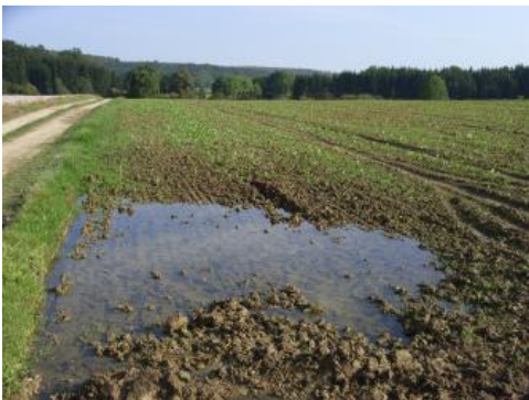
Stauanasse Böden auf Glazialablagerungen bei Sigmaringen

In der Legende zur BGL Mittlere und Westliche Alb werden auch einzelne Bodeneinheiten auf Glazialablagerungen beschrieben. Diese befinden sich im Übergangsbereich zu den Altmoränen des rißzeitlichen Rheingletschers, der zwischen Sigmaringen und Riedlingen über die Donau bis auf die Alb vorgedrungen ist. Im Laucherttal hat dies zum Aufstau eines Sees geführt, dessen Sedimente heute in Resten noch vorhanden sind. Eine rißzeitliche Vergletscherung auf der hohen Westalb, wie sie früher postuliert wurde (Hantke et al., 1976; Rahm, 1981), ist nach Schreiner (1979b) und Münzing (1987) auszuschließen. Allerdings gibt es in den höheren Lagen der Westlichen und Mittleren Alb viele kaltzeitlich entstandene ost- und nordostexponierte nischenförmige Firnmulden (Wolff, 1962; Dongus, 1977, S. 114; Schweizer, 1994, S. 63; Gwinner & Hafner, 1995, S. 46).