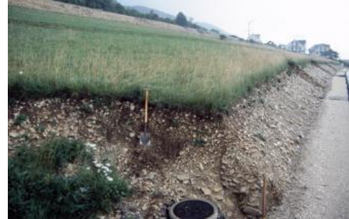
Rendzina auf Oberjura-Hangschutt am westlichen Stadtrand von Ebingen

Auch an den Hängen des Albraufs und der Albtäler ist das anstehende Juragestein überwiegend von mächtigen quartären Deckschichten verhüllt. Es handelt sich dort um einen groben Gesteinsschutt, der als Hangschutt bezeichnet wird. Gebildet wurde er v. a. im Pleistozän durch Felsstürze, Steinschlag und Schuttrutschungen unmittelbar unter den Felskränzen der Traufkante. Weitere Prozesse waren Solifluktion sowie Abschwemmungen und Muren, die den Schutt bis in tiefere Hangpartien brachten. Örtlich entstanden so sortierte, feinscherbige Schuttmassen, die landläufig als „Bergkies“ und dort, wo sie durch Kalkabscheidungen aus dem Hangwasser zu hartem Fels verbacken sind, als „Nägelesfels“ bezeichnet werden. Im Bereich der von Mergelsteinen des obersten Mitteljuras und des Oberjuras gebildeten Mittel- und Unterhängen des Albanstiegs sind mächtige, tonreiche, oft Kalksteinschutt führende Fließerden verbreitet, die oft von Hangschuttdecken unterschiedlichster Mächtigkeit überlagert werden.