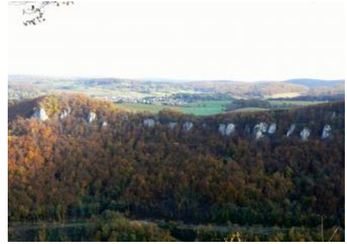
Blick über das obere Echaztal bei Lichtenstein-Honau zur Kuppenalb bei Lichtenstein-Holzelfingen

Auch im Laufe des Miozäns konnten sich auf der Albhochfläche noch rote Paläoböden bilden. Umlagerung und Vermischung mit älteren Verwitterungsrelikten machen genaue Zuordnungen schwierig. Bis in das Obermiozän hinein bestand ein Flachrelief, in dem der Oberjura vermutlich bereits eine deutliche Landstufe bildete. Die eigentliche Herausbildung der Schichtstufen in Südwestdeutschland erfolgte im Obermiozän und Pliozän, als sich während tektonischer Heraushebung, zunehmender Tiefenerosion und nachlassender chemischer Verwitterung unter kühleren Klimabedingungen bei der Abtragung zunehmend die Gesteinsunterschiede bemerkbar machten. Das Hebungszentrum lag damals im Südschwarzwald. Die Hebung und Kippung des Deckgebirges wird durch die heutige Lage der Klifflinie deutlich, die auf der Hegaualb bei 900 m ü. NHN und auf der Ostalb bei 500 m ü. NHN liegt. Nachdem am Südrand der Alb die Entwässerung lange Zeit nach Westen erfolgte, bildete sich im Obermiozän vor ca. 8 Mio. Jahren die nach Osten entwässernde Aare-Donau heraus, deren Einzugsgebiet bis in die Westalpen reichte. Reste der Ablagerungen dieses Flusssystemes ( Höhenschotter ) finden sich heute noch hoch über dem Donautal. Mit der Umlenkung der Aare zur Rhone im mittleren Pliozän, die auf der Alb mit dem Ausbleiben alpiner Gerölle markiert wird, hat sich das Donaueinzugsgebiet stark verkleinert (Feldberg-Donau).