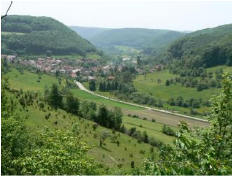
Blick von Norden in ein Seitental der Fils bei Bad Ditzingen-Auendorf

Ein charakteristisches Landschaftselement der Alb sind die besonders auf mageren Böden der Kuppenalb und an Talhängen verbreiteten, durch jahrhundertelange Schafbeweidung entstandenen Wacholderheiden. Sie sind heute vielfach unter Naturschutz gestellt und bedürfen einer regelmäßigen Pflege durch Beweidung, um einer Verbuschung entgegenzuwirken. Während die beweideten Wacholderheiden Relikte einer alten Kulturlandschaft sind, nehmen heute Mähwiesen weite Bereiche der Albhochfläche ein. Besonders auf der Westalb dominiert das Grünland die landwirtschaftlichen Nutzflächen. Im Gebiet der Gemeinde Meßstetten nimmt Dauergrünland beispielsweise 91 % der landwirtschaftlichen Nutzfläche ein. Im noch höher gelegenen Böttingen sind es fast 99 %. Im gesamten Landkreis Reutlingen, der zum allergrößten Teil auf der Mittleren Alb liegt, beträgt der Anteil an Dauergrünland 52,4 %.