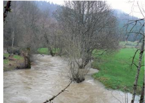
Frühjahrs-Hochwasser im Bäratal nördlich von Fridingen

Ansonsten sind die Talsohlen der engen Albtäler von Auenlehm bedeckt. Es handelt sich meist um schluffig-lehmiges bis tonig-lehmiges, fluvial verlagertes Bodenmaterial, das bei Hochwasserereignissen abgelagert wurde. Dass solche Überschwemmungen auch heute noch stattfinden, zeigte sich zuletzt beim Jahrhunderthochwasser im Jahr 2013, das besonders in den besiedelten Bereichen der Lauchertaue Schäden verursachte.