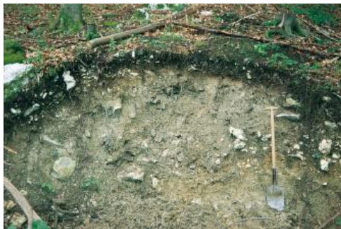
Durch Forstwegebau angeschnittene, steinig-mergelige Rutschmassen am Stufenhang der Schwäbischen Alb südlich von Hechingen-Boll, mit kleinräumigem Wechsel von Rendzina und Pararendzina (qB)

Vielerorts sind die Traufhänge auch von pleistozänen oder holozänen Rutschmassen wechselnder Zusammensetzung bedeckt. Auf pleistozänen Schuttdecken und Rutschmassen lässt sich stellenweise auch an den Traufhängen die für die Bodenverhältnisse wichtige jungtundrenzeitliche Decklage (Hauptlage) nachweisen (Terhorst, 1997, Kallinich, 1999).