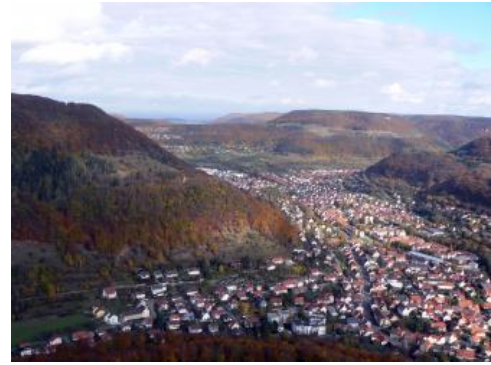
Echaztal und Albrand bei Lichtenstein-Unterhausen

Die Südwestgrenze der Bodengroßlandschaft bildet der Talzug von Prim und Faulenbach zwischen Spaichingen und Tuttlingen. Als südliche Begrenzung wurde der Steilabfall zum oberen Donautal und die Bedeckung mit Glazialsedimenten im Raum Sigmaringen herangezogen. Im Südosten endet die Mittlere Alb dort, wo die großflächige Bedeckung mit Tertiärgesteinen einsetzt. Die Abgrenzung zur Ostalb verläuft mit eher fließenden Übergängen in Anlehnung an die Naturräumliche Gliederung Deutschlands (Meynen & Schmithüsen, 1955) auf der Albhochfläche zwischen Blaubeuren und Geislingen an der Steige sowie im dort nordwestlich anschließenden Filstal. Eine wiederum markante Landschaftsgrenze bildet der Albtrauf mit seinen steilen Stufenhängen, der die Bodengroßlandschaft zwischen Spaichingen und Geislingen an der Steige vom Albvorland abgrenzt. Die Hänge werden, dort wo sie mit Gesteinsschutt des Oberjuras bedeckt sind, noch zur BGL Mittlere und Westliche Alb gerechnet. Erst im Bereich der Mittel- und Unterhänge, an denen überwiegend Mitteljura-Substrate das Ausgangsmaterial der Bodenbildung stellen, beginnt das Mittlere und Westliche Albvorland.