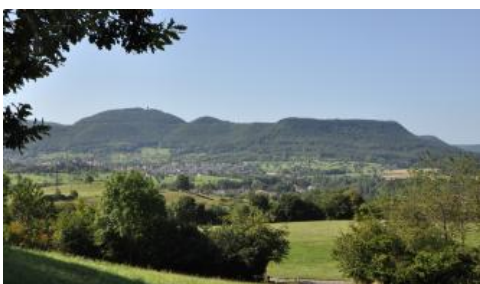
Der Albtrauf bei Reutlingen-Gönningen

Die Mittlere und Westliche Alb ist von Nordwesten gesehen ein weithin sichtbares Mittelgebirge. Die Stufenhänge weisen im Bereich der Westalb Höhenunterschiede von ca. 300 m und im Osten der Mittleren Alb von ca. 200 m auf. Dahinter dacht sich die Alb mit einer ausgedehnten, an der breitesten Stelle ca. 40 km breiten Hochfläche sanft nach Südosten ab.