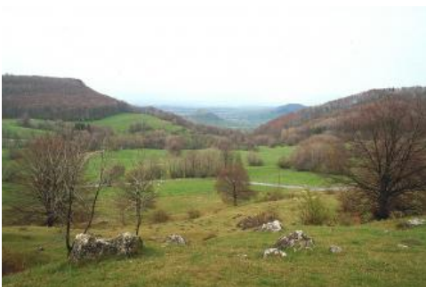
Die kesselförmige Einsenkung des Randecker Maars bei Bissingen-Ochsenwang

Die Südöstliche Alb und die Hegaualb sind heute noch großflächig mit Molassesedimenten bedeckt. In der BGL Mittlere und Westliche Alb sind im Bereich der Flächenalb nur noch wenige isolierte Reste erhalten. Es handelt sich dabei um geröllführende Mergel der Jüngeren Juranagelfluh (Obere Süßwassermolasse) bei Stetten am kalten Markt, Winterlingen und Langenenslingen, die im Untermiozän in großen Schwemmfächern von Norden ins Molassebecken geschüttet wurden. Hinzu kommen kleine Vorkommen von Mergeln und Karbonatgesteinen der Oberen Meeresmolasse bei Stetten am kalten Markt, Winterlingen und Beuron-Hausen.