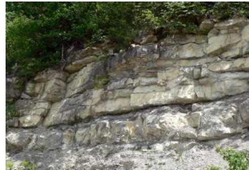
Bankkalk mit Mergelzwischenlagen im unteren Bereich der Wohlgeschichtete-Kalke-Formation am Pfaffenberg bei Bad Ditzingen-Auendorf

Karbonatgehalt, die durch dünne Mergelfugen getrennt sind. Wo auf der Westalb zwischen Spaichingen und Meßstetten bereits im Unteren Oberjura verschwammte Bereiche auftreten (Lochen-Formation, Lochenfazies), ist das Oberflächenrelief eher unruhig und flachkuppig und am Trauf durch Felsbildungen gekennzeichnet.