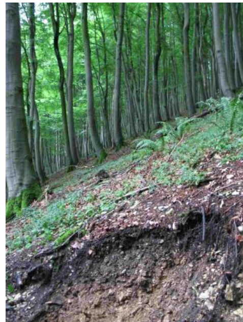
Typischer Buchenwald auf Rendzina aus Kalkstein-Hangschutt an einem Steilhang am Albtrauf

An den Hängen der Alb sind Buchenwälder dominierend. Im nordwestlichen Bereich gehört außerdem die Tanne zum natürlichen Waldbild. Die oft sehr naturnahen Waldgesellschaften werden aber immer wieder auch von Fichtenforsten unterbrochen. An trockenen, felsigen Standorten wechselt der Buchenwald mit eichen- und kiefernreichen Trockenwäldern, während an sehr steilen z. T. bewegten Schutthängen und in schluchtartigen Einschnitten die Buche zugunsten von Ahorn, Ulme, Esche und Linde in den Hintergrund tritt. Vielfach weist der Säbelwuchs der Bäume in diesen Bereichen darauf hin, dass die Hänge in Bewegung sind. Felsen und Steinschutthalden sind von Natur aus waldfreie Gebiete. Sie werden von artenreichen Pflanzengesellschaften eingenommen, die an diese Extremstandorte angepasst sind und seit Gradmann (1898) als Steppenheide bezeichnet werden. Die weniger steilen, mittleren und unteren, von Mergeln gebildeten Hangabschnitte sind an den Traufhängen der Mittleren Alb oft waldfrei. Sie werden meist als Obstwiesen genutzt und leiten über zum Albvorland.