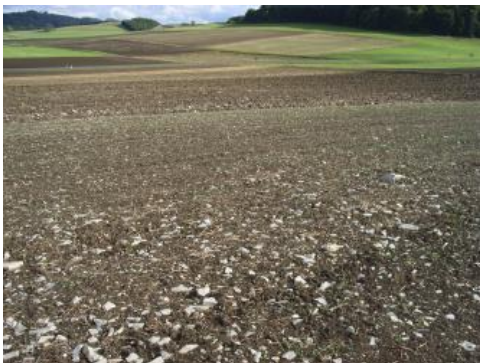
Bodenoberfläche im Verbreitungsgebiet der Zementmergel-Formation bei Münsingen

Raichberg an den Albtrauf vor. Zwischen Mössingen und Geislingen an der Steige ist er schließlich der Hauptstufenbildner und bildet am Albtrauf wie auch in den Taleinschnitten markante Felsen. In vielen Bereichen der Albhochfläche sind die Massenkalke diagenetisch verändert und in Dolomitstein oder daraus zu grobkristallinem, „zuckerkörnigem“ Kalkstein (Dedolomit) umgewandelt. Oft ist dieser von Hohlräumen unterschiedlicher Größe durchsetzt („Lochfels“). Auf der Albhochfläche zwischen Laichingen und Geislingen an der Steige sowie nördlich von Bad Urach tritt der Mittlere Oberjura großflächig in gebankter Fazies in Erscheinung und bildet ein flachkuppiges Relief. Bei der dort verbreiteten Untere-Felsenkalke-Formation (früher: Weißjura delta) handelt es sich um gebankte Kalksteine, die v. a. im unteren Bereich auch Mergellagen enthalten, während die tonarmen bis tonfreien Kalksteinbänke der beispielsweise zwischen Laichingen und Blaubeuren vorkommenden Obere-Felsenkalke-Formation (früher: Weißjura epsilon) nur selten Mergellagen aufweisen. In beiden Formationen können Kieselknollen auftreten.