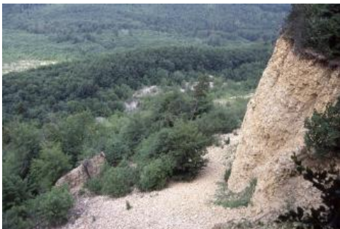
Bergbruch am Albtrauf bei Mössingen (Hirschkopf)

Anhaltende Hebung und der Wechsel von Kalt- und Warmzeiten führten im Pleistozän zu weiterer Taleintiefung mit der Folge, dass immer mehr Seitentäler oder auch jungtertiäre Karsthöhlen wie die Bärenhöhle trockenfielen. Im Bereich der am stärksten herausgehobenen Westalb wurde die Flächenalb durch die junge, zur Donau gerichtete Zertalung stark zerschnitten, so dass der ursprüngliche Charakter einer Flachlandschaft weitgehend verloren ging. Im Hochglazial wurden die Trockentäler durch den Permafrost abgedichtet, was zu einer fluvialen Reaktivierung und Tieferlegung der Talböden führte. Periglaziale Abtragungsprozesse hinterließen Fließberden und Hangschuttdecken.