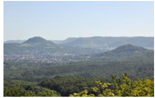
Der zerlappte Rand der Schwäbischen Alb bei Reutlingen mit der vorgelagerten Achalm und dem Vulkanschlot Georgenberg