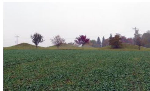
Grabhügel auf der Albhochfläche bei Grabenstetten

Aufgrund der für den Ackerbau günstigen Lehmböden war die gut zugängliche Hochflächenlandschaft trotz der Wasserarmut schon früh besiedelt. Im Gegensatz zu anderen Mittelgebirgen gehört die Alb zum Altsiedelland. Viele der zahlreichen Höhlen der Alb wurden bereits in der Altsteinzeit als temporäre Wohnplätze genutzt. Heute ist die Mittlere und Westliche Alb, abgesehen von den dicht besiedelten und industrialisierten Talräumen bei Albstadt und Geislingen an der Steige, überwiegend eine dünn besiedelte, ländliche Region mit wenigen kleineren Städten (z. B. Bad Urach, Münsingen, Laichingen, Gammertingen, Burladingen).