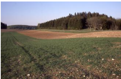
Kuppenalb bei Burladingen-Stetten

Eine viel größere Ausdehnung besitzt die östlich anschließende Mittlere Alb. Sie erreicht überwiegend Höhenlagen zwischen 700 und 800 m ü. NHN und ist in die Kuppenalb und die im Süden angrenzende Flächenalb zu unterteilen. Als Folge der Verkarstung ist die Albhochfläche frei von Fließgewässern. Der Albkörper wird aber durch mehrere tief eingeschnittene Flusstäler zerschnitten. Bära, Schmeie, Lauchert und Große Lauter entwässern den größten Teil der Mittleren und Westlichen Alb nach Südosten zur Donau hin. Die zum Neckar entwässernden Flüsse auf der Traufseite haben sich zwar stark eingetieft, aber ihre Täler reichen (abgesehen vom Filstal) nicht weit in den Albkörper hinein (Schlichem, Eyach, Starzel, Steinlach, Echaz, Erms, Lauter). Wegen der starken Verkarstung dehnt sich allerdings ihr