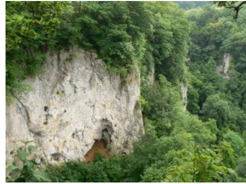
Felsbildung aus Unterem Massenkalk am Oberlauf des Lautertals bei Lenningen-Gutenberg

Der Mittlere Oberjura tritt besonders im mittleren und oberen Bereich in Schwammfazies ( Unterer Massenkalk ) in Erscheinung und nimmt flächenmäßig auf der Westlichen und Mittleren Alb den größten Raum ein. Der Gesteinsaufbau und Karbonatgehalt kann recht unterschiedlich sein. Es kommen sehr reine Kalksteine vor. Es treten aber auch Mergelkalke auf. Die Massenkalke bilden auf der Westalb und auf dem Heufeld nördlich von Burladingen über der Schichtflächenalb einen weiteren Stufenanstieg. Der Hangfuß und die Hänge werden oft von der Lacunosamergel-Formation (früher: Weißjura gamma) gebildet. Sie besteht aus Mergelsteinen und Mergelkalksteinen, in die dünne Kalksteinbänke eingeschaltet sind. Lokal können auch mergelige Schwammkalke auftreten. Hinter der Stufe folgt die stark reliefierte, hügelige Hochfläche der Kuppenalb. Im Bereich des Zollerngrabens springt der Untere Massenkalk weit nach Nordwesten bis zum