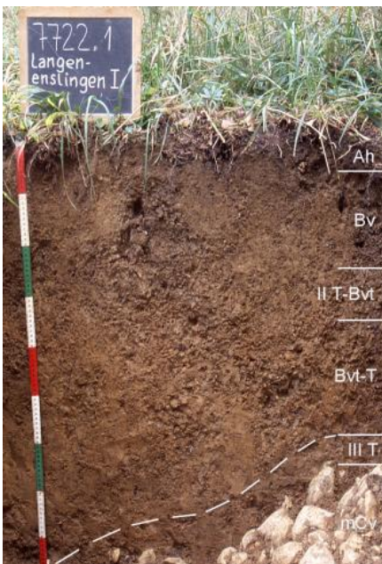
Mäßig tief entwickelte lessivierte Terra fusca-Braunerde aus lösslehmreichen Fließerden über Kalkstein des Oberjuras (Oberer Massenkalk) auf der Flächenalb nördlich von Langenenslingen (q35)