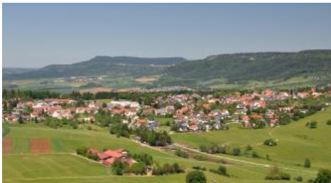
Blick auf den Trauf der Westalb bei Spaichingen

Die zwischen Spaichingen und den Hochlagen östlich von Albstadt gelegene Westliche Alb wird im Süden durch das Durchbruchstal der Donau begrenzt, das bereits zur BGL Baaralb, Oberes Donautal, Hegualb und Randen gerechnet wird. In der Naturräumlichen Gliederung Deutschlands (Meynen & Schmithüsen, 1955) wird die Westalb auch als „Hohe Schwabenalb“ bezeichnet. Außerdem ist für dieses Gebiet, in dem die Schwäbische Alb aufgrund der tektonischen Hebung ihre höchsten Höhen zwischen 800 und 1000 m ü. NHN erreicht, auch der Name „Großer Heuberg“ gebräuchlich. Der höchste Berg der Alb mit 1015 m ü. NHN ist der Lemberg bei Gosheim. Er ist Teil eines vor der eigentlichen Albhochfläche liegenden Komplexes von