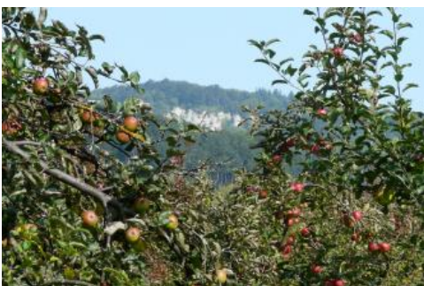
Obstanbau im Lautertal bei Lenningen

Bei den auf der Landnutzungskarte als „Sonstige Nutzungen“ gekennzeichneten Flächen handelt es sich überwiegend um Wacholderheiden oder andere Grünlandbereiche mit eingestreuten Gehölzen, Hecken oder kleinen Aufforstungen. In den tieferen Lagen im Osten sowie an den unteren Traufhängen sind es v. a. Streuobstwiesen. Rebland tritt äußerst kleinfächig am Rande der Bodengroßlandschaft bei Neuffen auf.