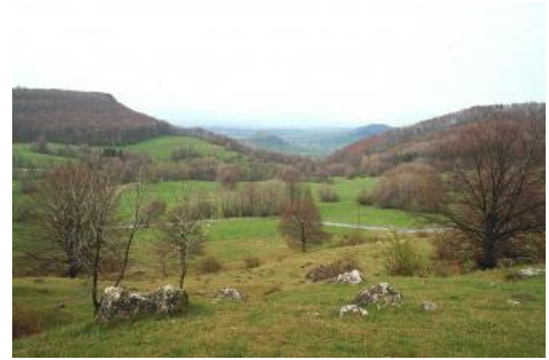
Die kesselförmige Einsenkung des Randecker Maars bei Bissingen-Ochsenwang

Das Randecker Maar bei Bissingen an der Teck-Ochsenwang ist der Rest eines mit tertiären Seesedimenten erfüllten vulkanischen Explosionskraters. In den hängigen Randbereichen sind die tonigen Seesedimente z. T. periglazial umgelagert und mit Kalksteinblöcken und Vulkantuff vermischt. Als Böden sind Pelosole und Pelosol-Rendzinen verbreitet ( q29 ). Im Zentrum des Kessels werden die Seesedimente von geringmächtigen holozänen Abschwemmmassen überlagert. Es sind Pseudogley-Kolluvien und Kolluvien verbreitet, die oft von Pelosol-Pseudogleyen und Pelosolen unterlagert werden ( q62 ). An den überwiegend als Schafweide genutzten steilen Randbereichen sind in den „Blockschichten“ des Randecker Maars Rendzinen verbreitet, die oft nur sehr flach entwickelt sind ( q10 ).