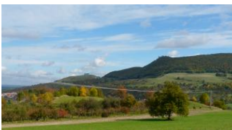
Blick von Südwesten zum Teckberg und Hohenbol bei Owen

Auf der Albhochfläche im Raum Bad Urach/Reutlingen/Münsingen sowie am Albrand südlich von Kirchheim unter Teck sind die Vulkanbildungen des Urach–Kirchheimer Vulkangebiets für das Bodenmuster von Bedeutung. Weil die vulkanischen Tuffe leichter ausräumbar sind als die umgebenden Kalksteine, treten diese Bildungen auf der Albhochfläche überwiegend als Hohlformen in Erscheinung. Der tonig-lehmige, z. T. als Fließerde umgelagerte und mit Juramaterial vermischte Vulkantuffersatz ist schwer wasserdurchlässig und wird in den flachen Senken und Mulden meist von geringmächtigen holozänen Abschwemmmassen überdeckt. Örtlich finden sich auch Zwischenlagen aus verschwemmtem Lösslehm. Häufige Bodentypen in diesen Substraten sind Pseudogleye und Kolluvium-Pseudogleye. Außerdem treten, von geringmächtigen Kolluvien bedeckte, Pseudogley-Braunerden und Pseudogley-Parabraunerden auf ( q43 ). Im Muldenzentrum kann es vereinzelt grundwasserbeeinflusste Böden geben (Gley, Gley-Pseudogley).