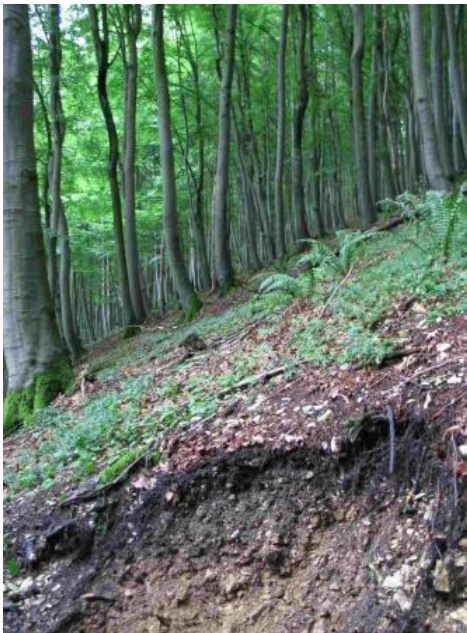
Typischer Buchenwald auf Rendzina aus Kalkstein-Hangschutt an einem Steilhang am Albtrauf

Rendzinen aus Hangschutt in den oberen Hangabschnitten und Pararendzinen aus tonigen Fließerden und Rutschmassen in den weniger steilen unteren Bereichen sind die übliche Abfolge an den Traufhängen. Im Einzelnen ergeben sich aber je nach Art und Alter der Hangsedimente feine und z. T. sehr kleinräumige Unterschiede im Bodenmuster. Der auf pleistozänen Schuttdecken örtlich erhöhte Schluffgehalt in den Ah-Horizonten lässt sich vermutlich auf Reste der jungtundrenzeitlichen, äolisch beeinflussten Decklage zurückführen (Terhorst, 1997; Bibus, 1999; Kallinich, 1999). Hänge mit jüngeren Schuttdecken besitzen oft Ah-Horizonte mit deutlich höheren Kalkgehalten. Das Fehlen der mehr oder weniger entkalkten Decklage, besonders in den siedlungsnahen unteren Hangbereichen, kann auch eine Folge der menschlichen Nutzung und früherer Waldrodungen sein.