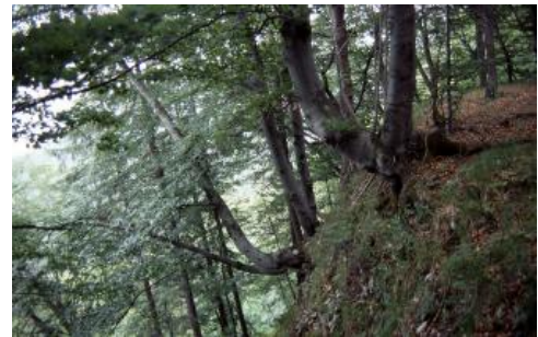
Buchenwald an der Traufkante am Hirschkopf südlich von Mössingen

Im Bereich von Felsdurchragungen oder auf sehr jungen Schutthalden haben die Rendzinen oft Ah-Horizonte von weniger als 15 cm Mächtigkeit und sind damit nur sehr flach entwickelt ( q2 ). Sie sind mit flach und mittel tief entwickelten Rendzinen und mit noch flacheren, im Rohbodenstadium verharrenden Böden vergesellschaftet (Syrosem, Lockersyrosem, Felshumusboden, Skeletthumusboden). Ihr Verbreitungsgebiet zieht sich besonders entlang der von Felskränzen gekrönten, obersten Hangabschnitte am Trauf der Mittleren Alb. Die Entwicklungstiefe und die Eigenschaften der Böden hängen in diesen obersten Hangabschnitten meist unmittelbar mit der Mächtigkeit der Hangschuttdecken zusammen. Teilweise fehlen die Schuttdecken ganz oder sind nur wenige Dezimeter mächtig. An anderen Stellen besitzen sie eine Mächtigkeit von mehreren Metern.