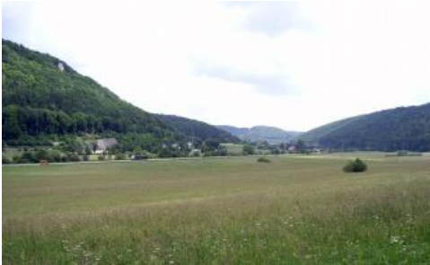
Blick nach Südosten ins Schmiechtal zwischen Albstadt-Ebingen und Straßberg

Wo in den Hangschuttdecken der Talhänge der Steingehalt zugunsten des Feinbodenanteils zurücktritt, treten neben Rendzinen auch Pararendzinen auf. Solche Hangabschnitte, die v. a. im Bereich der Westalb bei Spaichingen sowie an Zementmergel-Hängen bei Langenenslingen vorkommen, wurden in KE q20 zusammengefasst.