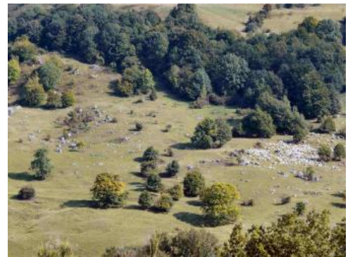
Naturschutzgebiet „Eichhalde“ bei Bissingen an der Teck

In jungen Rutschungsgebieten, die meist ein sehr ausgeprägtes Kleinrelief mit Kuppen, Hohlformen und Verflachungen besitzen, liegt meist ein entsprechend kleinräumiger Bodenwechsel vor ( q27 ). In tonreichen, mehr oder weniger stark Kalksteinschutt führenden Schuttmassen dominieren Pararendzinen mit Übergängen zum Pelosol. Untergeordnet treten Rendzinen aus Kalksteinschutt auf. In Hohlformen und Verflachungen finden sich grund- und stauwasserbeeinflusste Böden (Pseudogley, Gley, Kalkquellengley usw.). In manchen abflusslosen Hohlformen kommen sogar Niedermoore vor. Besonders große Verbreitung haben diese Rutschungshänge an den Stufenhängen im Raum Balingen, Hechingen und Mössingen.