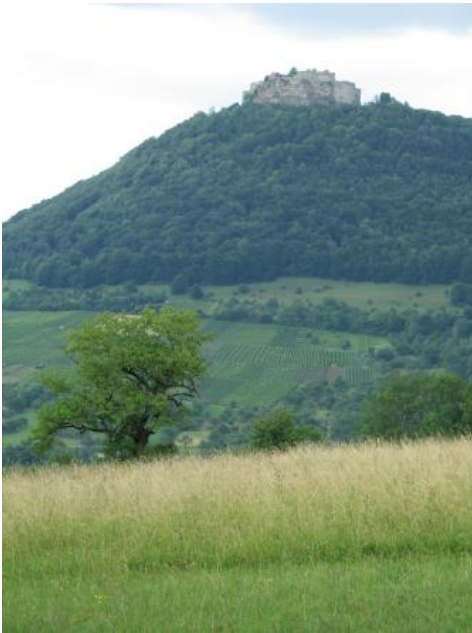
Blick auf den Hohenneuffen von Südwesten

Wo an den Mittel- und Unterhängen der Kalksteinschutt dominiert, sind wiederum Rendzinen vorherrschend ( q8 ). Oft sind die Schuttmassen infolge von Hangrutschungen entstanden. Teilweise sind sie nur geringmächtig und überlagern mergelige Substrate oder dünnen ganz aus. Entsprechend treten im z. T. kuppig-welligen Rutschungsrelief in KE q8 untergeordnet auch Pararendzinen auf. Bei vielen Großrutschungen sind komplette Kalksteinschollen abgeglitten, die heute an den Hängen breite, z. T. wellig-kuppige Hangverflachungen bilden und von Hangschutt bedeckt sind. Auch in diesen Bereichen dominieren Rendzinen ( q8 ). Selten treten an den Hängen auch Terra fusca-artige Böden auf (Terhorst, 1997; Kallinich, 1999). Bei dem Rückstandston dürfte es sich meist um solifluidal oder durch Rutschereignisse verlagertes Material aus Klüften vom Hochflächenrand handeln.