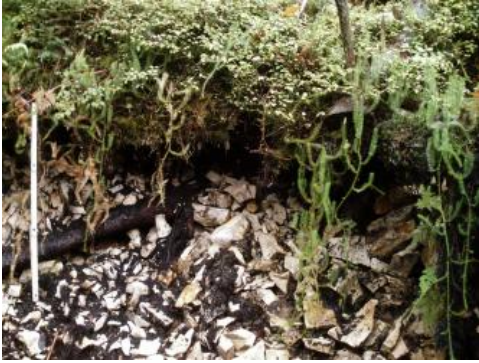
Skeletthumusboden mit Rohhumusdecke (q1) im Bereich der steilen Abrisskante eines jungen Rutschungshangs südlich von Wehingen

Eine kleinflächig vorkommende Besonderheit an Rutschungshängen der Westalb sind karbonathaltige Skeletthumusböden, die eine Rohhumusdecke tragen ( q1 ). Sie treten in Höhenlagen zwischen 800 und 910 m ü. NHN an sehr steilen, schuttbedeckten Abrisshängen und wellig-kuppigen Hangleisten auf. Auf den Rohhumusdecken finden sich kalkfliehende Pflanzengesellschaften mit Moosen, Heidelbeere, Bärlapp usw.. Unter dem Oh-Horizont der Rohhumusaufgabe folgt ein Gesteinsschutt, in dessen Hohlräumen sich schwarzer Feinhumus findet, in dem kaum mineralisches Material zu erkennen ist. Agsten (1977, S. 25 f.) bezeichnet diese Bildungen als „Kalkstein-Berghumus“ und führt ihre Entstehung auf gehemmte biologische Aktivität bei minimaler Wasserspeicherkapazität sowie extremen Schwankungen von Temperatur und Durchfeuchtung zurück.