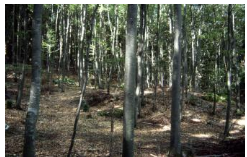
Flachbuckliges Rutschungsrelief mit Rendzina, Pararendzina und Pelosol (q8, q27) am Stufenhang der Mittleren Alb unterhalb des Raichbergs