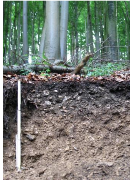
Rendzina aus Hangschutt unter Buchenwald am Albtrauf (q7)

Die an den steilen, mittleren und oberen Stufenhängen der Schwäbischen Alb verbreiteten Böden werden v. a. in Kartiereinheit (KE) q7 beschrieben. Es handelt sich ganz überwiegend um typische Mull-Rendzinen aus Kalkstein-Hangschutt. Sie besitzen meist einen 15–40 cm mächtigen schwarzen, stark humosen, steinigen Ah-Horizont. Die obersten Zentimeter sind häufig nur noch schwach karbonathaltig, örtlich auch karbonatfrei. Die aus dem Streuabfall der verbreiteten Buchenwälder stammende organische Substanz wird bei der hohen Kalknachlieferung zu stabilem Kalkhumat umgewandelt. Dieses und die wenigen Kalklösungsrückstände verkleben mit den feinkörnigen Resten des Karbonatschutts zu großen, stabilen, unregelmäßig geformten porösen Krümeln, die größtenteils aus Tierkot entstehen. Da es sich oft um junge Schuttdecken handelt, ist die Bodenbildung vielerorts nicht über das Rendzina-Stadium hinausgegangen. Nur in Hangabschnitten, die zur Ruhe gekommen sind und an denen im Holozän keine Massenverlagerungen mehr stattgefunden haben, finden sich örtlich auch Braunerde-Rendzinen und Terra fusca-Rendzinen. Der erhöhte Schluffgehalt in den Ah-Horizonten lässt sich dort vermutlich auf Reste der jungtundrenzeitlichen, äolisch beeinflussten Decklage zurückführen.