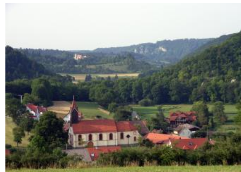
Blick ins Tal der Großen Lauter nördlich von Hayingen-Indelhausen

Der größte Teil der Böden an den Hängen der überwiegend zur Donau gerichteten Täler wurde in KE q11 zusammengefasst. Wie am Albtrauf handelt es sich überwiegend um Rendzinen aus Hangschutt. Im Vergleich zu q7 sind die Hangneigungen im Durchschnitt aber geringer und es fehlt die starke Überprägung durch junge Massenverlagerungen. Aus diesem Grund treten vermehrt auch weiter entwickelte Böden wie Terra fusca-Rendzinen und Braunerde-Rendzinen auf. Die weniger steinig, verbrauchten Oberböden sind in der Regel in einem Rest der jungtundrenzeitlichen Decklage entwickelt. Andererseits treten aber häufig auch nur sehr flach entwickelte Rendzinen auf, die sicherlich häufig eine Folge der Bodenerosion durch Beweidung und andere menschliche Eingriffe sind. Auch im Bereich von Felsbildungen und jungen Schutthalden sind nur extrem flach entwickelte Böden verbreitet (Syrosem, Lockersyrosem, Syrosem-Rendzina, Felshumusboden, Skeletthumusboden). Wo diese an den Talhängen größere Flächen einnehmen, wurden sie in KE q3 abgegrenzt. Weite Verbreitung haben solche, oft an den Wacholderheiden zu erkennenden Hangabschnitte, wie z. B. im Lautertal zwischen Gomadingen und Lauterach. Überwiegend bewaldete, stark felsige Steilhänge, an denen neben sehr flach entwickelten Böden auch mittel tief entwickelte Rendzinen aus Hangschutt auftreten, werden in KE q4 beschrieben.