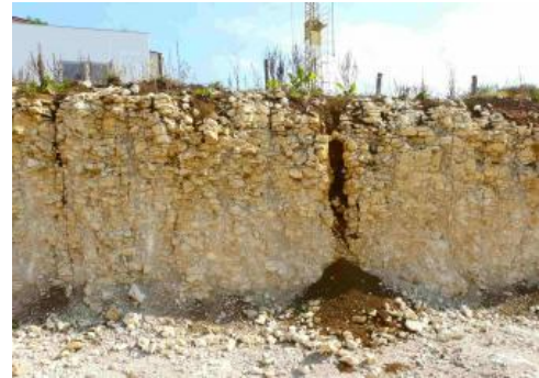
Lehmverfüllte Karstspalten in einer Baugrube bei Grabenstetten

Die Standorteigenschaften der Böden auf der verkarsteten Alb hängen in erster Linie von ihrem Wasserspeichervermögen und damit v. a. von ihrer Gründigkeit ab. Diese kann allerdings kleinräumig sehr stark wechseln. So können Baumwurzeln über einer Karstspalte metertief eindringen, während das Gestein daneben bis nahe an die Oberfläche reicht und nur eine flache Durchwurzelung erlaubt. Besonders auf Bankkalken kann sich über dem Gestein pleistozäner Frostschutt gebildet haben, der schluffig-toniges Verwitterungsmaterial aus Mergelzwischenlagen enthält und damit deutlich mehr Wasser speichern kann als ein flachgründiger Standort auf kaum verwittertem Massenkalk. Eine deutliche Verbesserung der Eigenschaften ist dort gegeben, wo eine Überdeckung mit lösslehmhaltigen Deckschichten vorliegt.