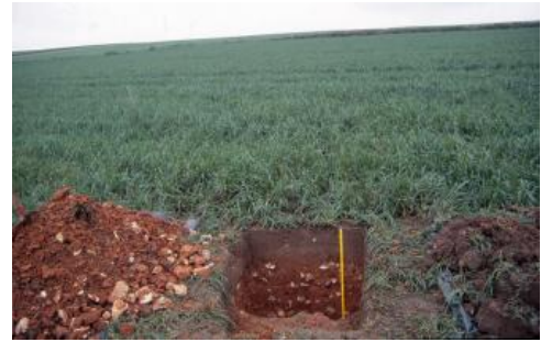
Terra rossa an einem schwach geneigten Hang im Verbreitungsgebiet von Tertiärsedimenten bei Winterlingen-Harthausen (q42)

Vorherrschende Böden im Bereich der tertiären Albüberdeckung in der BGL Mittlere und Westliche Alb sind Pararendzinen und Rendzinen aus Jüngerer Juranagelfluh ( q25 ). Ihre Eigenschaften hängen entscheidend vom Geröllanteil des Ausgangsmaterials ab. Wo dieser nicht sehr hoch ist, handelt es sich um tiefgründige, gut durchwurzelbare, bereits an der Bodenoberfläche kalkhaltige Böden mit mittlerer nFK und hoher KAK (Pararendzinen). Die kies- und geröllreichen Rendzinen sind entsprechend schlechter einzustufen. In den Muldentälchen sind neben tiefgründigen, schwach kiesführenden Kolluvien ( q49 ), deren Eigenschaften denen im Oberjuragebiet ähneln, örtlich auch Gley-Kolluvien ( q63 ) und Gleye ( q77 ) mit deutlichem Grundwassereinfluss verbreitet. Die Terrae fuscae und Terrae rossae, die aus einem Gemisch von Oberjura- und Tertiärverwitterungsmaterial bestehen ( q42 ), sind in ihren Eigenschaften mit den Terrae fuscae des Oberjuragebietes vergleichbar. Ihre Eigenschaften sind stark von der schwankenden Entwicklungstiefe und dem Steingehalt abhängig. Wo am Ausgangsmaterial viel Mergel beteiligt ist, verlief die Bodenentwicklung eher zu Pelosolen, die eine vergleichsweise geringere Wasserdurchlässigkeit besitzen.