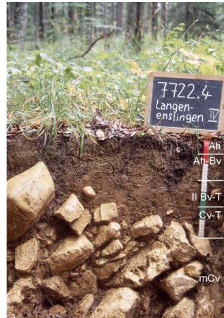
Mittel tief entwickelte Braunerde-Terra fusca, aus lösslehmreicher Fließerde über verwittertem Kalkstein des Oberjuras (Oberer Massenkalk) auf der Flächenalb nördlich von Langenenslingen (q40)

Mächtiger wird die Bodendecke dort, wo über dem Rückstandston noch lösslehmreiche Fließerden oder geringmächtiger Lösslehm lagern. Häufig ist dies auf Verebnungen, in Karsthohlformen und an ostexponierten Hängen der Fall. Als verbreitetste Bodentypen treten dort Terra fusca-Parabraunerden und Parabraunerden auf ( q34 , q35 , q36 ). Es handelt sich überwiegend um tiefgründige, zumindest im oberen Profilabschnitt steinfreie bis steinarmer Lehm Böden mit günstigem Wasser-, Luft- und Nährstoffhaushalt. Die nFK ist überwiegend als mittel bis hoch und die KAK als hoch einzustufen. Die schluffreichen Oberböden (Ap-/Al-Horizonte) sind stark erosionsgefährdet, neigen zu Verschlammung und Verkrustung und sind verdichtungsempfindlich. Unter landwirtschaftlicher Nutzung sind die Al-Horizonte meist stark verkürzt bzw. im Ap-Horizont aufgearbeitet oder vollständig abgetragen.