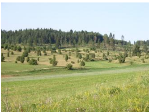
Wacholderheiden auf der Albhochfläche im Digelfeld bei Hayingen

Ehemals als Schafweide genutzte flach entwickelte Mergelböden (q22) sind bei Wiederaufforstungen schwierige Waldstandorte (Müller, 1962). Moder-Humusformen und wenig entwickelte Ah-Horizonte weisen auf ein gestörtes Bodenleben in diesen Bereichen hin. Ähnliches gilt für die sandigen Dolomit-Rendzinen (begleitend in q5 und q14). Auch über deren lockerem, basenreichem Substrat findet sich gelegentlich ein Auflage-Moder mit säureliebenden Moosen. Die mangelnde Stickstoff- und Wasserversorgung schränkt das Pflanzenwachstum auf diesen Standorten sehr stark ein. (Müller, 1962; Müller, S. in Jentsch & Franz, 1999).