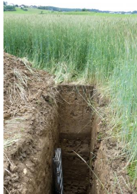
Über 3 m mächtiges Kolluvium (q53) am tiefsten, zentralen Punkt einer großen Karstsenke südöstlich von Königsheim (Lkr. Tuttlingen)