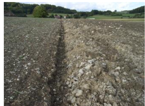
Steinige „Ackerrendzinen“ mit grauem, mergeligem Feinmaterial und Mergelkalksteinen im Verbreitungsgebiet der Zementmergel-Formation bei Münsingen (q22)

Auf den kalkreichen Mergelsteinen der Zementmergel-Formation sind i. d. R. keine plastischen Tonböden verbreitet, sondern nur flach entwickelte Pararendzinen und Rendzinen (q22). Eine deutliche Gefügebildung und Übergänge zum Pelosol sind nur vereinzelt festzustellen. Die Böden mit steinigem, schluffig-tonigem Substrat sind schon an der Oberfläche kalkhaltig und meist flach bis mäßig tiefgründig. Sie weisen eine nur sehr geringe bis geringe nFK und eine geringe bis mittlere KAK auf. Etwas günstigere Eigenschaften haben die Pararendzinen in dem stärker verwitterten, weniger kalkreichen Material der Lacunosamergel-Formation. Dort treten in hängigen Lagen oft auch tiefgründigere Pararendzinen auf (q23), die sich in tonreichen Fließerden entwickelt haben. Sie besitzen eine geringe bis mittlere nFK und eine mittlere bis hohe KAK. Nur an wenigen Stellen, besonders im Ausstrichbereich der Lacunosamergel-Formation, wurden flach bis mäßig tief entwickelte Pelosole auskartiert (q28). Sie besitzen einen dichten, schwer durchwurzelbaren Unterboden und stellenweise schwach ausgeprägte Staunässemerkmale. Auf der Westalb treten lokal tief humose Pelosole mit schwarz gefärbten P-Horizonten auf.