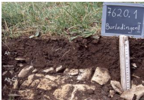
Sehr flach entwickelte Rendzina aus Kalkstein der Wohlgeschichtete-Kalke-Formation (q6)

Auf der von Karbonatgesteinen des Oberjuras gebildeten Albhochfläche werden in der Bodengroßlandschaft (BGL) Mittlere und Westliche Alb über 63 % der Fläche von Kartiereinheiten eingenommen, in denen Rendzinen die Leitbodentypen darstellen. Der Begriff Rendzina („Kratzer“) stammt aus dem polnischen und beschreibt lautmalend das Geräusch, das der Pflug beim Kratzen über den Gesteinsuntergrund erzeugt. Dasselbe drücken die auf der Alb nicht seltenen Flurnamen „Scherre“ oder „Rauscher“ aus. Die dunklen, humosen Ah-Horizonte der Rendzinen erwärmen sich im Frühjahr schnell und haben einen hohen Stoffumsatz. Die Böden sind oft bis an die Oberfläche kalkhaltig bzw. durch landwirtschaftliche Bearbeitung sekundär aufgekalkt. Bei den typischen Rendzinen ( q5 , q6 ) handelt es sich um flach- bis mittelgründige, steinige Böden, bei denen bereits oberhalb 3 dm u. Fl. das Festgestein oder ein sehr stark steiniger Unterboden auftritt. Es