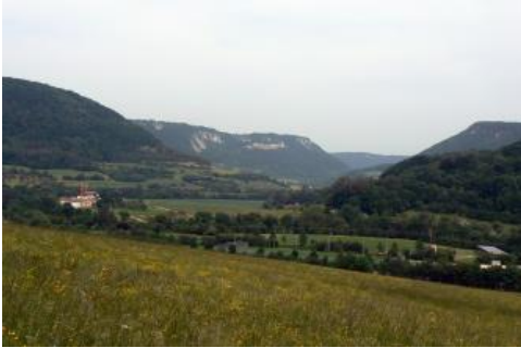
Blick nach Osten in das Filstal zwischen Deggingen und Bad Überkingen

An den weniger stark geneigten unteren Hangabschnitten am Albtrauf, wo sehr viel tonig-mergeliges Substrat am Aufbau der Böden beteiligt ist ( q21 , Pararendzina und Rendzina), ist die Wasserversorgung für die Waldbäume günstiger. Die nFK liegt in der Stufe gering bis mittel. Allerdings sind die tonigen Unterböden stellenweise nur mäßig durchwurzelbar. Dies gilt besonders auch für die Pararendzinen und Pelosole im Bereich junger Rutschungshänge ( q27 ). Ein ausgeprägtes Kleinrelief mit entsprechend engräumigem Bodenwechsel und dem Vorkommen von Pseudogleyen und Hanggleyen sowie die anhaltend bestehende Rutschungsneigung machen in diesen Bereichen nur eine waldbauliche Nutzung möglich.