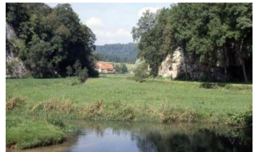
Grundwasserbeeinflusste Auenböden (q68) in der Talsohle der Großen Lauter

In den gewässerführenden Tälern der Alb ist der Karstwasserspiegel angeschnitten. Verbreitet treten mäßig grundwasserbeeinflusste Auenböden aus tiefgründigem, örtlich mäßig tiefgründigem kalkreichem Auenlehm auf, die überwiegend als Grünland genutzt werden ( q68 ). In Talabschnitten mit tief liegendem Grundwasser wird z. T. auch Ackerbau betrieben ( q64 , q66 ). Bis in die 60er Jahre des 20. Jh. gab es in vielen Albtätern noch Grabensysteme zur Wiesenbewässerung. Durch Wasserzufuhr in Trockenzeiten und Nährstoffzufuhr sollte so der Grünlandertrag gesteigert werden. In den Talabschnitten mit Feuchtwiesen, Nasswiesen und Hochstaudenfluren dominieren bei andauernd hoch stehendem Grundwasser kalkhaltige Auengleye. Begleitend können auch kalkhaltige Anmoorgleye auftreten ( q71 ). Wo an den Auensedimenten viel verschwemmtes Kalktuffmaterial beteiligt ist, treten neben lehmigen auch sandige Bodenarten auf. Örtlich wird das Auensediment auch direkt von lockerem oder festem Kalktuff (Sinterkalk) unterlagert. Dies ist besonders bei den in den Kartiereinheiten q65 und q67 abgegrenzten Auenböden der Fall. Die Böden sind in diesen Bereichen sehr kalkreich und haben eine hohe Wasserdurchlässigkeit.