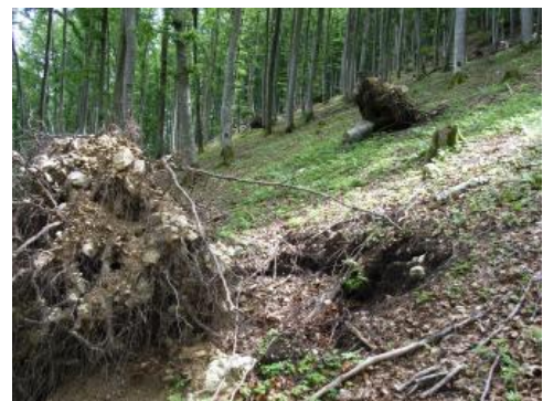
Steilhang im Schmiechatal bei Albstadt-Ebingen mit Rendzinen aus Kalkstein-Hangschutt (q11)

An den steilen Trauf- und Talhängen entscheidet die Mächtigkeit der Schuttdecken und v. a. deren Gehalt an mineralischem Feinmaterial sowie an organischer Substanz über das Wasserspeichervermögen und damit über die Leistungsfähigkeit der meist forstlich genutzten Standorte. Bei den Rendzinen aus Kalksteinschutt an den Hängen ( q7 , q8 , q11 ) ist die nFK meist als gering einzustufen. Aus der abgestorbenen organischen Substanz bildet sich bei ständiger Kalknachlieferung ein schwarzer Ah-Horizont mit einem lockeren Bodengefüge aus stabilen Krümeln mit einem reichen Bodenleben und einem hohen Nährstoffumsatz. Die Mullrendzinen aus Kalksteinschutt können aufgrund ihres günstigen Gefüges mehr pflanzenverfügbares Wasser speichern als vergleichbare flachgründige Böden aus anderen Ausgangsgesteinen. Das hohe Stickstoffangebot wird durch eine artenreiche Bodenflora angezeigt. Wo die Schuttdecken zur Ruhe gekommen sind, ist der Ah-Horizont oberhalb 1–3 dm u. Fl. oft karbonatfrei. In den feinscherbigen Schuttdecken („Bergkies“) ist der Wurzelraum stellenweise durch verfestigte Kalkausfällungen unter dem Ah-Horizont eingeschränkt.