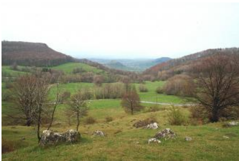
Die kesselförmige Einsenkung des Randecker Maars bei Bissingen-Ochsenwang

Das Besondere im Bereich der Vulkanschote der Mittleren Alb ist das Vorkommen von wechselfeuchten Böden, die auf der umgebenden, verkarsteten Albhochfläche fehlen. Die geringe Wasserdurchlässigkeit des Vulkantuffzersatzes und der daraus gebildeten Fließberden führt in den flachen Senken zu zeitweiliger Staunässe und Luftmangel in den überlagernden Deckschichten ( q43 ). Auch auf den tonigen Seesedimenten des Randecker Maars finden sich Kolluvien mit schwach ausgeprägten Staunässemerkmalen ( q62 ). Im Schopflocher Moor führte die Vernässung bis zur Torfbildung ( q82 ) und im Randbereich des Moors zu extremen Stauwasserböden (Stagnogleye q45 ) und Gleyen ( q76 ). Die Bodeneigenschaften außerhalb der vernässten Senken wechseln stark und hängen vom Steingehalt bzw. dem Ausmaß der Beimengung von Kalksteinschutt und von der