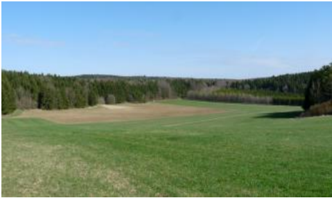
Pfaffental nordöstlich von Leibertingen- Kreenheinstetten

In manchen Flachlagen, flachen Mulden und Karstwannen werden die Rückstandstone recht mächtig und sind dort zudem von meist 4–7 dm mächtigen lösslehmreichen Deckschichten überlagert (Deck- über Mittellage), in denen oft eine mehr oder weniger starke Lessivierung abgelaufen ist. Als Böden sind Parabraunerden, Terra fusca-Parabraunerden und lessivierte Terra fusca-Braunerden verbreitet. Sie stellen die am tiefsten entwickelten Böden der Albhochfläche im Oberjuragebiet dar und kommen als Begleitboden vereinzelt in KE r7 vor. Wo sie größere Flächen einnehmen, wurden sie in KE r45 zusammengefasst. Sie sind i. d. R. über 1 m tief entkalkt. Bei dem stellenweise enthaltenen Bodenskelett handelt es sich um Feuersteinbruchstücke, Quarzkies der Urdonau oder Bohnerze. Örtlich auftretende Bohnerzgruben und Staunässemerkmale in den Böden weisen darauf hin, dass lokal im Untergrund auch Bohnerzton lagern kann. Auch eine teils ockerbraune, teils rotbraune Farbe des Rückstandstons deutet stellenweise auf eine Beimengung von Paläobodenmaterial hin. Vorkommen von KE r45 finden sich v. a. auf der Hegaualb im Raum Tuttlingen, Neuhausen ob Eck, Buchheim und Leibertingen.