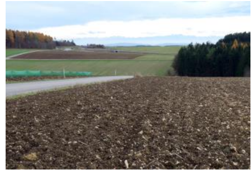
Rand der Hegualb-Hochfläche nördlich von Emmingen-Liptingen

Die flachwellige bis kuppige Hochfläche der Hegualb wird von einem ausgedehnten Netz schmaler Trockentalmulden durchzogen. In ihnen hat sich im Laufe der Jahrhunderte das durch Bodenerosion von den Äckern abgeschwemmte Bodenmaterial angesammelt. Entsprechend den starken Mächtigkeitsschwankungen der Abschwemmmassen (4 bis über 10 dm) wurden in KE r78 mittlere bis tiefe Kolluvien als Leitbodenformen angegeben. Der Karbonat-, Humus- und Steingehalt des Solums kann ebenfalls sehr unterschiedlich sein. In breiteren Mulden und Karstwannen sind die Abschwemmmassen i. d. R. nur geringmächtig und werden von Böden aus Rückstandston oder aus lösslehmreichen Deckschichten unterlagert (Kolluvium über Terra fusca, Kolluvium über Parabraunerde, r73 ). Die meist mittel bis mäßig tiefen Kolluvien, deren Einzugsgebiet sich im Gebiet der Zementmergel-Formation befindet, fallen durch höhere Tongehalte des Solums auf. Sie wurden in KE r49 zusammengefasst.