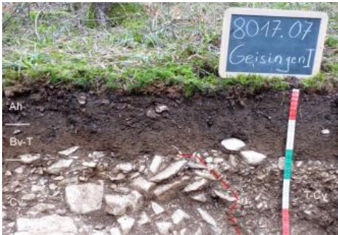
Flach entwickelte Braunerde-Terra fusca aus Rückstandston der Kalksteinverwitterung der Wohlgeschichtete-Kalke-Formation (r72)

Mit den Kartiereinheiten r72 und r7 wurden Bereiche abgegrenzt, in denen Terrae fuscae und zweischichtige Braunerde-Terrae fuscae dominieren. Auf der Baaralb sind die Böden überwiegend flach, z. T. auch mittel tief entwickelt ( r72 ). Bereits in 2–4 dm Tiefe folgt unter dem entkalkten gelblich braunen T-Horizont sehr stark steiniger, karbonathaltiger Rückstandston und häufig unmittelbar darunter der anstehende Kalkstein. In den obersten 1–2 dm ist oft ein auf Lösslehmbeimengung zurückzuführender erhöhter Schluffgehalt festzustellen. Verbraunung und Verlehmung haben in diesem obersten Profilschnitt dann zur Bildung eines Bv- oder Ah-Bv-Horizonts geführt. KE r72 ist hauptsächlich in den zentraleren Bereichen der von der Wohlgeschichtete-Kalke-Formation gebildeten Plateaus verbreitet. Sie kommt aber auch regelmäßig in flachen Mulden vor, die am Plateaurand in steile Kerbtäler übergehen.