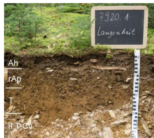
Mittel tief entwickelte Terra fusca auf der Hegualb bei Meßkirch-Langenhart (r7)

Kartiereinheit r7 , mit ähnlichen Böden, tritt ebenfalls auf breiteren Plateaus der Baaralb westlich von Tuttlingen sowie auf dem Randen auf, hat aber ihr Hauptverbreitungsgebiet auf der Hegualb. Sie ist dadurch gekennzeichnet, dass die Terrae fuscae und Braunerde-Terrae fuscae mit 3–6 dm dort deutlich tiefer entwickelt sind. Naturgemäß schwankt aber die Mächtigkeit der Feinbodendecke in der Fläche sehr stark. Neben noch tiefer entwickelten Böden treten auch flach entwickelte Rendzinen und Terrae fuscae als Begleitböden auf. Die Erklärung für die höhere Mächtigkeit des Rückstandstons liegt darin, dass die Bankkalke im Mittleren und Oberen Oberjura oft einen großen nichtlöslichen Gesteinsanteil besitzen und häufig von Mergellagen unterbrochen werden, was die Bodenbildung beschleunigt. Im geneigten Gelände wurde das tonige Material im Pleistozän solifluidal umgelagert und in Mulden und Hangfußlagen akkumuliert. Oft finden sich Beimengungen von Bohnerzen und örtlich einzelne kieselige Schotter der Urdonau. Auch von einer Vermischung mit Bohnerztonen oder jüngerem tertiärem Paläobodenmaterial muss ausgegangen werden. Kartiereinheit r7 findet sich nicht nur auf Bankkalken sondern auch im Verbreitungsgebiet der Massenkalke, in Reliefpositionen, die sich für die Erhaltung des Rückstandstons als günstig erwiesen (Flachhänge, Verebnungen, Mulden, Hangfuß- und Sattellagen).