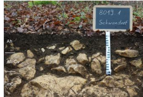
Rendzina auf Oberem Massenkalk (Oberjura) am Hahnenbol bei Neuhausen ob Eck-Schwandorf (r66)

Die auf der Hochfläche von Baaralb, Hegualb und Randen vergleichsweise geringmächtige Decklage ist wohl nicht nur mit Erosion zu erklären. Sie ergibt sich auch aus der Lösungsverwitterung von ursprünglich in der Deckschicht vorhandenem Kalksteingrus, womit im Laufe des Holozäns ein Volumenverlust und eine Mächtigkeitsabnahme verbunden war (Kösel & Rilling, 2002, S. 126). Während KE r1 überwiegend im Flachrelief von Oberjura-Bankkalken auftritt, wurden ganz ähnliche Böden im stärker reliefierten Massenkalk-Gebiet v. a. im Osten der Hegualb mit KE r66 abgegrenzt. Der Unterschied zu KE r1 liegt darin, dass ein viel kleinräumigerer Bodenwechsel auftritt und die als Begleitböden auftretenden Terrae fuscae etwas häufiger und z. T. tiefer entwickelt sind. Dies liegt zum einen an dem kuppigen Relief, zum anderen auch an der Inhomogenität der Karbonatgesteine bzw. deren wechselnden Widerstandsfähigkeit gegenüber der Lösungsverwitterung. Neben Kalkstein mit unterschiedlichem Karbonatgehalt können auch Dolomitstein und Dedolomit (Zuckerkörniger Kalkstein) auftreten. Ein engräumiger Bodenwechsel entsteht dadurch, dass unter einer glatten Geländeoberfläche die Tiefenlage der sog. Lösungsfront der Karbonatgesteinsverwitterung sehr stark schwanken kann. So kann in Karstspalten metertiefer Rückstandston liegen, während sich direkt daneben auf dichtem, schwer verwitterbarem Kalkstein nur eine flach entwickelte Rendzina befindet.