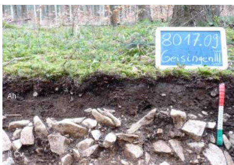
Rendzina auf verwittertem Kalkstein der Wohlgeschichtete-Kalke-Formation

Ausgedehnte Ackerflächen mit einer Bedeckung aus hellen Kalksteinen zeigen auf der Hegaualb im Verbreitungsgebiet des Oberjuras das Vorherrschen flachgründiger und steiniger Böden. Noch mehr gilt dies für die bewaldeten Hochflächen der Baaralb und entlang des Donautals. Die Bäume wurzeln dort in einer nur 2–4 dm mächtigen mehr oder weniger steinigen Feinerdedecke und in dem darunter folgenden aufgelockerten Kalkgestein oder in verlagertem Kalksteinschutt. Es überwiegen Rendzinen, Terra fusca-Rendzinen und Braunerde-Rendzinen, die in Kartiereinheit (KE) r 1 zusammengefasst wurden und fast 20 % der Bodengroßlandschaft einnehmen (ohne Siedlungsflächen). Es handelt sich meist um keine typischen Rendzinen mit lockerem, schwarzem und sehr stark humosem Ah-Horizont. Vielmehr sind die Oberböden oft nur mittel bis stark humos und weisen bräunliche Farbtöne auf. Sie sind wohl in den meisten