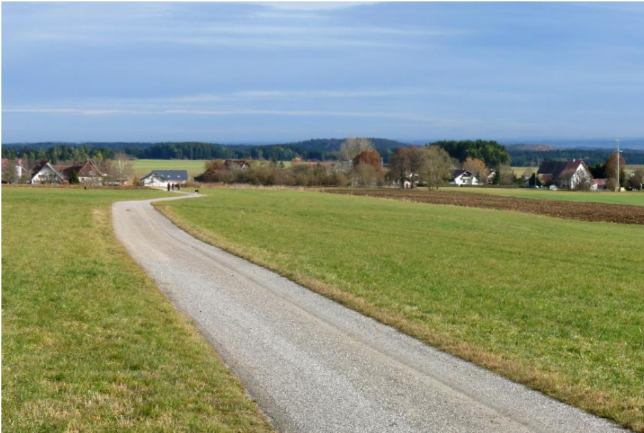
Albhochfläche nördlich von Emmingen-Liptingen

Auf der hügeligen Hochfläche des Kleinen Randens spielen die Gesteine des Oberjuras wegen der großflächigen Tertiärbedeckung nur eine untergeordnete Rolle. Nur im Nordosten des Bergrückens sind in schmalen Streifen entlang der Trauf- und Talhänge Rendzinen ( r1 ) und Terra fuscae ( r7 ) anzutreffen.