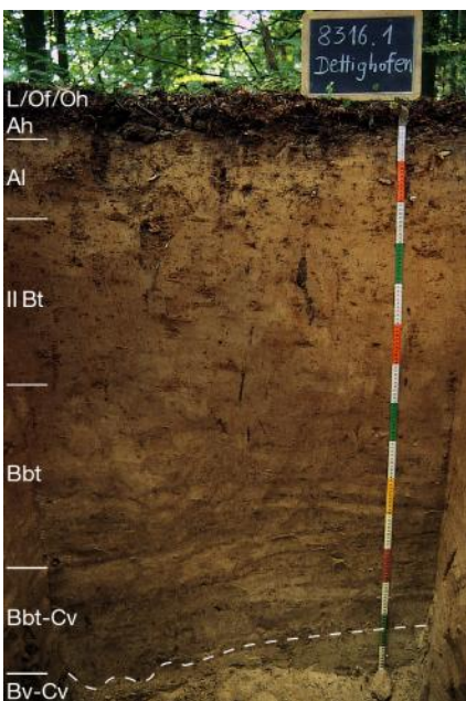
Parabraunerde aus sandiger Decklage über Melaniensand (Obere Brackwassermolasse) auf dem Kleinen Randen nördlich von Dettighofen ( r53 )

Auch im übrigen Gebiet sind tertiäre Karbonatgesteine als Ausgangsmaterial der Bodenbildung eher selten. Wenige kleine Vorkommen mit Rendzinen aus Molasse-Kalkstein finden sich nördlich von Engen und östlich von Tengen ( r101 ) im Verbreitungsgebiet der Oberen Meeressmolasse (Randen-Grobkalk). Am Südrand des Längenwalds südlich von Geisingen sowie westlich von Tengen-Watterdingen treten Terrae fuscae aus periglazial umgelagertem Rückstandston auf ( r8 ). Die Fließerden bestehen vermutlich sowohl aus Verwitterungsmaterial des Oberjuras als auch aus dem Tertiär. Sie enthalten Kalksteine aus der Oberen Meeressmolasse und aus dem Oberjura sowie örtlich Gerölle aus der Jüngerer Juranagelfluh. Die oft rötliche Farbe ist vermutlich auf eine Beimengung von roten Mergeln (Helicidenschichten) zurückzuführen. Ähnlich aussehende Böden im Bereich tertiärer Süßwasserablagerungen des südlich von Geisingen gelegenen Hinterrieds wurden ebenfalls KE r8 zugeordnet. Nordöstlich von Engen gibt es drei kleinflächige Vorkommen mit Parabraunerden, die sich in schluffig-feinsandigen Ablagerungen der Oberen Meeressmolasse entwickelt haben ( r106 ).