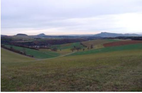
Juranagelfluh-Landschaft zwischen Blumberg-Kommingen und Tengen-Talheim (links im Mittelgrund)

In den Muldentälern auf der hügeligen, von Jüngerer Juranagelfluh bedeckten Hochfläche der Hegualb sind tiefe Kolluvien aus tonig-lehmigen Abschwemmmassen anzutreffen, die meist einen geringen bis mittleren Kies- und Geröllgehalt besitzen ( r37 ). Im Gegensatz zu der vom Oberjura gebildeten Albhochfläche treten auch Kolluvien auf, die Vergleungsmerkmale im tieferen Unterboden aufweisen. In mehreren Muldentälern im Tertiärgebiet ist der Grundwassereinfluss auch deutlicher ausgeprägt. So wurde mit KE r36 eine Einheit ausgewiesen, in der Gley-Kolluvien und Kolluvien mit Vergleyung im nahen Untergrund die Leitböden darstellen. In noch nasseren Talabschnitten sind dann Gleye und Kolluvium-Gleye verbreitet ( r25 ). Die lehmigen Abschwemmmassen werden dort z. T. von Kalktuffsand oder Torf unterlagert. Im Tiefenried nördlich von Tengen treten Kalkquellengleye und Kalkgleye aus geringmächtigen