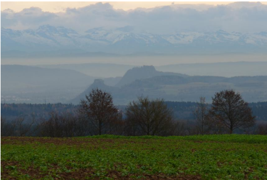
Blick vom Witthoh (Oberhart) in den Hegau zum Hohenkrähen und Hohentwiel

Vier vermoorte Talmulden bzw. Talanfangsmulden wurden als eigene Kartiereinheit ausgewiesen ( r27 ). Zumindest in zwei Fällen handelt es sich um Bereiche, in denen wasserstauende Basaltschlote den Untergrund bilden, nämlich im Kummernied südöstlich von Blumberg und in den Riedwiesen südöstlich von Geisingen-Leipferdingen. Neben mittel tiefem und tiefem kalkreichem Niedermoor finden sich Kalkgleye über Niedermoor sowie, in den Randbereichen, Anmoorgleye und Moorgleye. Ein weiteres kleines Niedermoor mit kalkfreien Torfen beim Hinterried südlich von Geisingen wurde KE r19 zugeordnet. Im Hinterried findet sich außerdem tertiärer Süßwasserkalk, der von geringmächtigen Kalksteinschutt führenden Kolluvien überlagert wird, die als eigene Kartiereinheit ausgewiesen wurden ( r67 ).