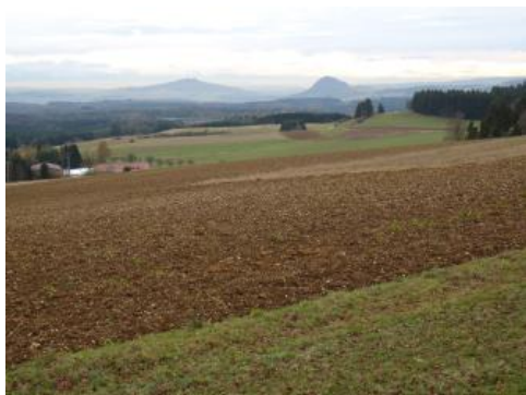
Blick von der Hegaualb am Witthoh (Windegg) bei Emmingen nach Süden in den Hegau

Von den Ablagerungen der Tertiärzeit, die den größten Teil der westlichen und mittleren Hegaualb sowie des Kleinen Randens überdecken, nehmen die geröllführende Mergel und Konglomerate der Jüngeren Juranagelfluh (Obere Süßwassermolasse) den größten Raum ein. In Abhängigkeit von der Zusammensetzung der Juranagelfluh-Sedimente, bzw. der aus ihnen im Pleistozän entstandenen Solifluktsdecken, sind verschiedene Bodenentwicklungen abgelaufen. Auf kalkreichen Mergeln mit sehr hohem Kies- und Geröllgehalt oder auf Konglomeratbänken haben sich als Rückstandsprodukt der Lösungsverwitterung Terra fuscae gebildet (Kartiereinheit r77 ), wogegen auf geröllärmeren Mergeln eher Pelosole entstanden sind ( r103 ). In der vermutlich ursprünglich überall vorhandenen lösslehmhaltigen Deckschicht (Decklage) ist zusätzlich eine Verbraunung abgelaufen, so dass es zur Bildung zweischichtiger