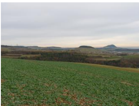
Juranagelfluh-Landschaft der südwestlichen Hegaualb bei Tengen

Auch auf der stärker reliefierten Hochfläche des Kleinen Randens dominieren in KE r5 Grünland, Obstwiesen und kleine Waldstücke. In konvex gewölbten oder steilen Geländedeformationen sind die Fließerden dort oft nur geringmächtig, so dass wenige dm unter der Oberfläche bereits Mergel, Kalksandsteine oder Nagelfluhbänke anstehen. Unterhalb der von Nagelfluhbänken gebildeten Hangversteilungen finden sich gelegentlich kleinflächige Vernässungen durch Quellaustritte. Oft haben oberflächennahe Rutschungen in solchen Bereichen zu einer unregelmäßig welligen Geländeoberfläche geführt.