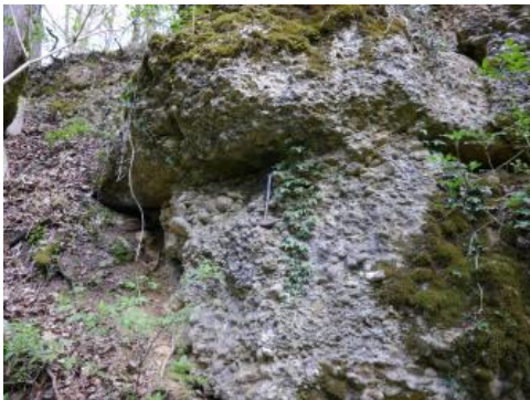
Konglomerat der Jüngeren Juranagelfluh auf dem Kleinen Randen östlich von Küssberg-Küßnach

Auch auf der stärker reliefierten Hochfläche des Kleinen Randens dominieren in KE r5 Grünland, Obstwiesen und kleine Waldstücke. In konvex gewölbten oder steilen Geländedeformationen sind die Fließerden dort oft nur geringmächtig, so dass wenige dm unter der Oberfläche bereits Mergel, Kalksandsteine oder Nagelfluhbänke anstehen. Unterhalb der von Nagelfluhbänken gebildeten Hangversteilungen finden sich gelegentlich kleinflächige Vernässungen durch Quellaustritte. Oft haben oberflächennahe Rutschungen in solchen Bereichen zu einer unregelmäßig welligen Geländeoberfläche geführt.