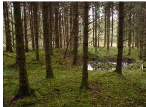
Bohnerzgruben im „Jungholz“ nordöstlich von Liptingen