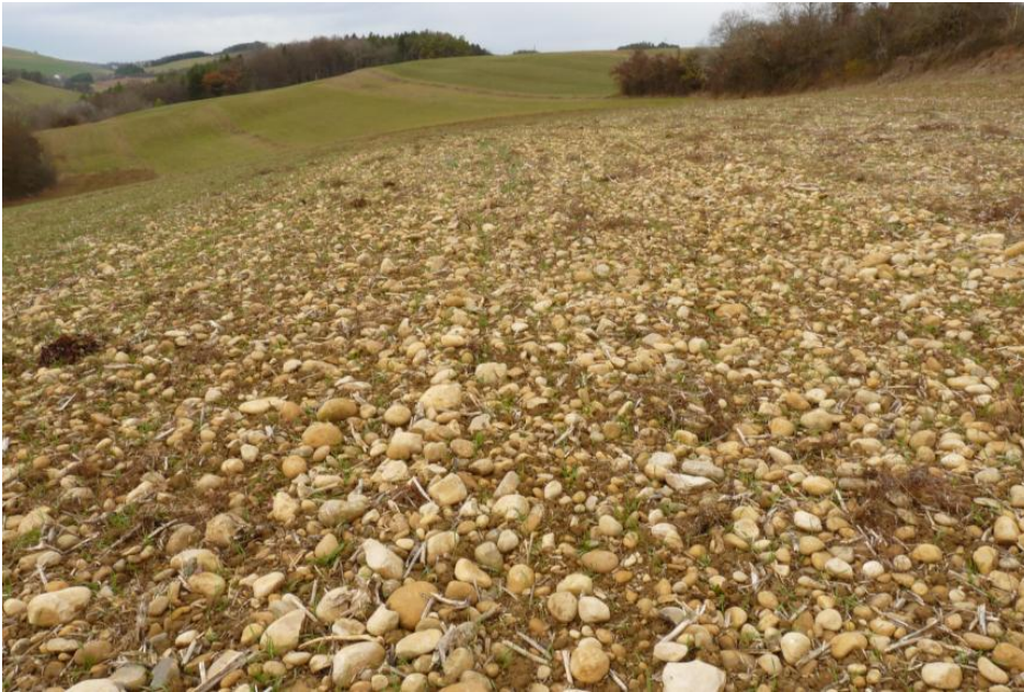
Kiesreiche Ackerböden aus Jüngerer Juranagelfluh bei Tengen

Auch im übrigen Gebiet sind tertiäre Karbonatgesteine als Ausgangsmaterial der Bodenbildung eher selten. Wenige kleine Vorkommen mit Rendzinen aus Molasse-Kalkstein finden sich nördlich von Engen und östlich von Tengen ( r101 ) im Verbreitungsgebiet der Oberen Meeressmolasse (Randen-Grobkalk). Am Südrand des Längenwalds südlich von Geisingen sowie westlich von Tengen-Watterdingen treten Terrae fuscae aus periglazial umgelagertem Rückstandston auf ( r8 ). Die Fließerden bestehen vermutlich sowohl aus Verwitterungsmaterial des Oberjuras als auch aus dem Tertiär. Sie enthalten Kalksteine aus der Oberen Meeressmolasse und aus dem Oberjura sowie örtlich Gerölle aus der Jüngerer Juranagelfluh. Die oft rötliche Farbe ist vermutlich auf eine Beimengung von roten Mergeln (Helicidenschichten) zurückzuführen. Ähnlich aussehende Böden im Bereich tertiärer Süßwasserablagerungen des südlich von Geisingen gelegenen Hinterrieds wurden ebenfalls KE r8 zugeordnet. Nordöstlich von Engen gibt es drei kleinflächige Vorkommen mit Parabraunerden, die sich in schluffig-feinsandigen Ablagerungen der Oberen Meeressmolasse entwickelt haben ( r106 ).