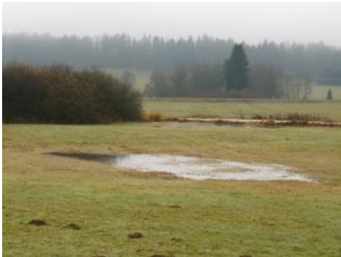
„Ried“ östlich von Neuhausen ob Eck

Auf der Hegaualb im Raum Emmingen-Liptingen und Neuhausen ob Eck finden sich mehrere z. T. breite, durch Grünland genutzte Senken, in denen Staunässeböden vorherrschen (Pseudogley, Gley-Pseudogley, r80 ). Als stauende Schichten über dem verkarsteten Oberjura kommen die Mergel der Unteren Süßwassermolasse bzw. tonige Fließerden aus deren Verwitterungsmaterial in Frage. Ebenso wirken sich die in diesem Bereich verbreiteten Bohnerztone in Mulden- und Flachlagen als Stauhorizont aus. Die wasserdurchlässigen Oberböden sind i. d. R. in geringmächtigen lösslehmhaltigen Deckschichten oder Abschwemmmassen entwickelt.