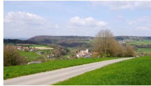
Zeraltete Hochfläche des Kleinen Randens bei Klettgau-Bühl

Im Verbreitungsgebiet von Mergeln der Unteren Süßwassermolasse auf der Hegaualb bei Emmingen-Liptingen dominieren Tonböden, die oft noch eine geringmächtige lehmige Deckschicht besitzen (Decklage). Es handelt sich um zweischichtige Braunerde-Pelosole, die in KE r51 beschrieben werden. Dieselbe Einheit kommt auch kleinflächig auf dem Kleinen Randen vor. Viel häufiger sind dort im Gebiet der Unteren Süßwassermolasse aber Substrate mit mächtigeren lösslehmhaltigen Deckschichten verbreitet (Deck- über Mittellage). Vorherrschende Böden sind dreischichtige Pelosol-Parabraunerden und Parabraunerden ( r54 ). Flächenmäßig keine Bedeutung haben die intensiv rot gefärbten Tonböden (Pelosole, Pararendzinen), die sich in den Mergeln der Helicidenschichten entwickelt haben ( r34 ). Es wurden nur zwei kleinflächige Vorkommen auf der Hegaualb südlich des Aitrachtals verzeichnet.