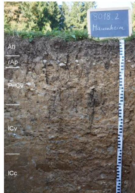
Pararendzina aus geröllarmen Mergeln der Jüngeren Juranagelfluh (r5)

Die hier genannten Kartiereinheiten r77 , r103 , r105 , r22 , r81 und r40 kommen überwiegend in bewaldeten Gebieten mit oft nur geringen Hangneigungen vor und haben im Verbreitungsgebiet der Jüngeren Juranagelfluh insgesamt nur einen geringen Flächenanteil. Viel weiter verbreitet, und v. a. auf landwirtschaftlich genutzten Flächen vorkommend, ist die Kartiereinheit (KE) r5 mit über 16 % der Fläche der gesamten Bodengroßlandschaft. Verbreitete Böden sind Pararendzinen und Rendzinen auf geröllreicherem Ausgangsmaterial. Diese wenig entwickelten Böden sind in der hügeligen Landschaft als Erosionsprofile zu deuten. Die oben beschriebenen weiter entwickelten Böden treten in KE r5 nur noch vereinzelt als Begleitböden auf. Die von Geröllern übersäten Ackerflächen prägen in weiten Bereichen der Hegaualb das Landschaftsbild. Stärker geneigte Bereiche sind bewaldet oder werden durch Grünland genutzt.