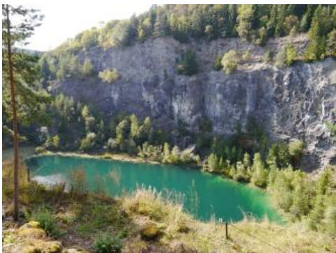
Ehemaliger Basalt-Steinbruch am Höwenegg

Die basaltische Kraterfüllung des Höweneggs südlich von Immendingen ist zum großen Teil durch den früheren Abbau entfernt worden. Basaltgestein (eigentlich Foidit) ist aber als Schutt Komponente überall in den bodenbildenden Deckschichten enthalten. Verbreitetes Ausgangsgestein sind Vulkantuffe wechselnder Zusammensetzung. Neben basischen vulkanischen Komponenten enthalten sie in unterschiedlichem Maße Sedimentgestein aus dem durchschlagenen Gebirge, also auch karbonatisches Material. Der Tuff ist in Oberflächennähe gelockert, verwittert und in der letzten Kaltzeit als Fließerde umgelagert worden. In den oberen 1–4 dm ist meist eine schluffige, äolische Beimengung festzustellen (Decklage). Die am Höwenegg vorkommenden Böden wurden in Kartiereinheit (KE) r75 zusammengefasst. Wegen der dunklen Gesteinsfarbe und eines oft bis in den Unterboden reichenden Humusgehalts ist die Braunfärbung der