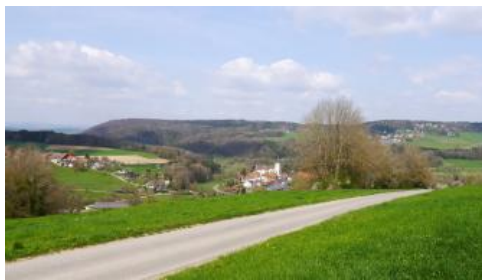
Zerfallene Hochfläche des Kleinen Randens bei Klettgau-Bühl

Auf der östlichen Hochfläche des Kleinen Randens findet sich eine oft nur sehr geringmächtige und lückenhaft vorhandene Decke aus rißzeitlichem Glazialsediment, die großflächig von lösslehmreichen Fließerden überlagert wird (Deck- und Mittellage). Vorherrschende Böden sind Parabraunerden, die wegen des häufig schwer wasserdurchlässigen Untergrunds oft Stauwassermerkmale und damit Übergänge zum Pseudogley aufweisen ( r30 , Pseudogley-Parabraunerde, Parabraunerde-Pseudogley). Bei den Deckschichten am Nordhang des Brackwassermolasse-Höhenzugs Kohlplatz/Wolfshalder/Eck nördlich von Dettighofen bestehen die Unterbodenhorizonte vermutlich nicht aus Resten von Glazialablagerungen, sondern aus Fließerden, die Kies und Geröll aus der Molasse führen (Bausch & Schober, 1997, S. 190). Wegen ihres ähnlichen Aussehens wurden sie aber mit den Böden auf Altmoräne in Kartiereinheit (KE) r30 zusammengefasst. Wo lokal toniges Verwitterungsmaterial der Molasse oder des Oberjuras den Unterboden bildet, können auch Pelosol-Parabraunerden bzw. Terra fusca-Parabraunerden oder Braunerde-Terrae fuscae auftreten. Weitere kleinflächige Vorkommen von KE r30 befinden sich auf der Hegaualb bei Tengen.