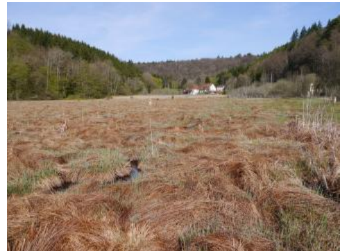
Der „Wüster See“ im Wangental bei Jestetten

Das Wangental, das von Jestetten nach Südwesten verläuft und dann nach Nordwesten zur Schweizer Grenze umbiegt, ist eine mit Schotter verfüllte wärmzeitliche Schmelzwasserrinne. Im Talboden, am Hangfuß, auf Schwemmfächern und in den Seitentälchen sind Kolluvien mit wechselndem, meist geringem Grund- und Stauwassereinfluss verbreitet ( r59 ). Auch ihre Substratzusammensetzung kann stark wechseln, da ihr Herkunftsgebiet sowohl im Jura- und Tertiärgebiet, als auch im Alt- und Jungmoränengebiet liegt. In einer zentralen Rinne südwestlich von Jestetten dominieren Böden mit deutlichem Grundwassereinfluss ( r60 , Gley-Kolluvium, Kolluvium-Gley, Gley). Bei Wangental, an der Grenze zur Schweiz, wurde durch Schuttmassen von den Hängen und aus Seitentälern eine Wasserscheide aufgeschüttet, so dass das Tal heute nicht über den Klettgau, sondern über Jestetten nach Osten zum Rhein bei Rheinau (CH) entwässert wird. Außerdem hat sich dort ein kleiner, durch natürliche Schuttbildungen aufgestauter, in Verlandung begriffener Flachsee gebildet („Wüster See“).