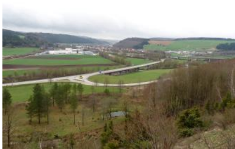
Donautal bei Geisingen-Kirchen-Hausen

Mit KE r20 wurden landwirtschaftlich genutzte Auffüllungsflächen im Donautal im Bereich der Autobahnanschlussstelle Geisingen abgegrenzt. Es handelt sich überwiegend um flächenhaft aufgeschüttetes Aushubmaterial aus dem Siedlungs- und Verkehrswegebau. Die Auftragsböden sind meist kalkhaltig und oft stark steinig. Auftragsböden und starke Veränderungen der Oberfläche finden sich in den ehemaligen Bohnerzabbau-Gebieten. Die dort verbreiteten Böden wurden in KE r55 zusammengefasst. Näheres dazu findet sich in der Beschreibung der Böden im Verbreitungsgebiet von Tertiärsedimenten.