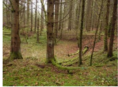
Bohnerzgruben im „Jungholz“ nordöstlich von Liptingen

Wo durch Bohnerzabbau oder andere anthropogene Eingriffe nur ein Teil der ursprünglichen Böden entfernt, überdeckt oder verändert wurde, ist in der Bodenkarte dem Kurzzeichen der dort normalerweise vorkommenden Kartiereinheit der Kleinbuchstabe „a“ nachgestellt (z. B. r7a). Diese Bereiche nehmen etwa 1 % der Gesamtfläche ein. Den mit Abstand größten Flächenanteil haben dabei die Bodenveränderungen auf dem ehemaligen Standortübungsplatz der Deutsch-Französischen Brigade bei Immendingen. Gegenwärtig werden auf dessen Gelände durch die Errichtung einer Teststrecke der Daimler AG weitere erhebliche landschafts- und bodenverändernde Eingriffe durchgeführt. Darüber hinaus gibt es eine Vielzahl an meist kleineren Flächen mit anthropogenen Veränderungen, die bei der Kartierung nicht alle erfasst werden konnten.