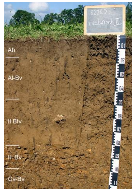
Tief entwickelte lessivierte Braunerde aus spätglazialer Fließerde über würmzeitlichem Hochflutlehm und Schotter der Eschach

Auf den mit Hochflutsedimenten überschütteten Bereichen ist dagegen KE s38 verbreitet. Lessivierte Braunerden, Parabraunerde-Braunerden sowie örtlich Braunerde-Parabraunerden sind auf stellenweise schwach kieshaltigen feinkörnigen Substraten entwickelt, die ab 8 bis über 10 dm u. Fl. den unterlagernden, im oberflächennahen Bereich entkalkten sandig-lehmigen Kiesen aufsitzen. Am Übergang zur Talwasserscheide zwischen Eschach und Unterer Argen werden auf dem eben auslaufenden abzugsträgen Schwemmfächer die Bodenwasserverhältnisse einerseits zunehmend durch Stauwasser bestimmt und gelangen andererseits unter Grundwassereinfluss ( s50 , Gley-Pseudogley aus Hochflutlehm).