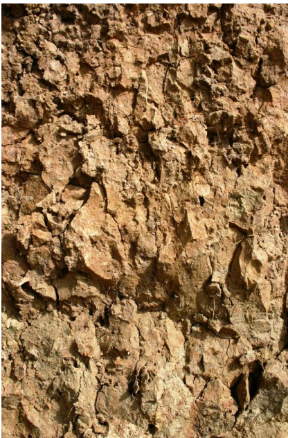
Bodengefüge eines Pelosols aus umgelagertem Verwitterungsmaterial der Unteren Süßwassermolasse

Auf den überwiegend schluffig-tonigen Ablagerungen der Brackwassermolasse und der Unteren Süßwassermolasse sind auf schwach gewölbten Scheitelbereichen sowie den anschließenden Flachhängen verbreitet gering staunasse, mäßig tief und tief entwickelte Pseudogley-Pelosol-Parabraunerden und Pseudogley-Parabraunerden entwickelt ( t28 ). Überwiegend an schwach bis stark geneigten Hängen, häufig im Bereich von Tälern, treten Pelosole und Braunerde-Pelosole auf ( t13 ). Das Ausgangsmaterial stellen hier tonige Fließerden (Basislagen), welche die an den Hängen austreichenden feinkörnigen Molasseschichten aufgearbeitet haben. Die nur teilweise vorhandene Decklage mit Ausbildung einer flachen Braunerde zeigt, dass hier nutzungsbedingte Eingriffe des Menschen zu einer Umgestaltung der Böden geführt haben. Darauf weisen zudem einzelne Vorkommen von Pararendzinen und Regosolen auf gerundeten Scheitelbereichen hin ( t9 ).