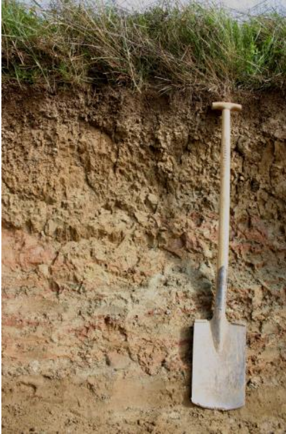
Mäßig tief entwickelter brauner Pelosol aus geringmächtiger lösslehmhaltiger Fließerde über tonreicher Fließerde über Mergelstein der Unteren Süßwassermolasse

Auf den überwiegend schluffig-tonigen Ablagerungen der Brackwassermolasse und der Unteren Süßwassermolasse sind auf schwach gewölbten Scheitelbereichen sowie den anschließenden Flachhängen verbreitet gering staunasse, mäßig tief und tief entwickelte Pseudogley-Pelosol-Parabraunerden und Pseudogley-Parabraunerden entwickelt ( t28 ). Überwiegend an schwach bis stark geneigten Hängen, häufig im Bereich von Tälern, treten Pelosole und Braunerde-Pelosole auf ( t13 ). Das Ausgangsmaterial stellen hier tonige Fließerden (Basislagen), welche die an den Hängen austreichenden feinkörnigen Molasseschichten aufgearbeitet haben. Die nur teilweise vorhandene Decklage mit Ausbildung einer flachen Braunerde zeigt, dass hier nutzungsbedingte Eingriffe des Menschen zu einer Umgestaltung der Böden geführt haben. Darauf weisen zudem einzelne Vorkommen von Pararendzinen und Regosolen auf gerundeten Scheitelbereichen hin ( t9 ).