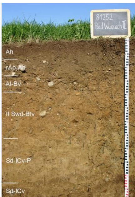
Tief entwickelte Pseudogley-Parabraunerde- Braunerde aus lösslehmhaltiger Fließerde über Fließerde aus Molasse- und Gletschermaterial