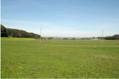
Das Schwarzachtal nördlich von Bad Saulgau

Vor allem in den breiteren Tälern und Talabschnitten hat die randliche Einschwemmung von jüngeren Sedimenten nicht ausgereicht, um größere Talbodenbereiche aufzufüllen und die weitverbreiteten mittel und mäßig tiefen Niedermoore ( t113 ) zu überdecken. Durch anthropogene Grundwasserabsenkung sind diese Moore oberflächennah meist vererdet und ihre Mächtigkeit dürfte vor den Drainagemaßnahmen und den in der Folge stattfindenden Mineralisierungs- und Sackungsvorgängen z. T. deutlich größer gewesen sein. Die Torfhorizonte überlagern verbreitet geringmächtige, sandige und lehmige Hochwasserabsätze auf würmzeitlichen Schmelzwasserkiesen. Ebenfalls durch früher sehr hohe Grundwasserstände wurde Kartiereinheit (KE) t105 mit Humus- und