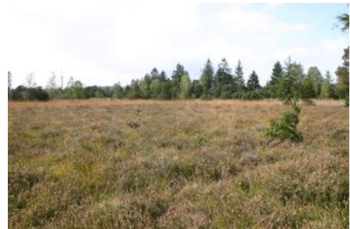
Riedheide im Wurzacher Ried (Ziegelbacher Ried)

Trotz des hohen Grundwasserstands nahe der Oberfläche sind die Niedermoorflächen im Bereich des Wurzacher Rieds typischerweise auf die Randzonen beschränkt. In den zentralen Bereichen setzte auf dem Niedermoorkörper, als dieser die Wasseroberfläche erreicht hatte, das Wachstum von Hochmoortorfen ein. Eine bedeutende Rolle für ihre Bildung spielten dabei die wasserspeichernden Sphagnum -Moose, die im Gebiet des Wurzacher Rieds mit seinem mäßig kalten, regenreichen Klima ideale Voraussetzungen für ihre Ausbreitung vorfanden. Im Ergebnis bildeten sich so in den zentralen Bereichen des Wurzacher Rieds ausgedehnte, z. T. deutlich gewölbte Hochmoorschilde ( t119 , tiefes Hochmoor aus Hochmoortorf).