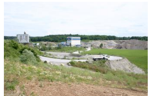
Kiesgrube bei Singen-Steißlingen

Auftragsböden finden sich kleinflächig und verstreut über die gesamte Bodengroßlandschaft, bevorzugt jedoch in den dichter besiedelten Gebieten. Die Böden bestehen überwiegend aus natürlichem Material und sind häufig kalkhaltig ( U163 ). Bei Überlingen, Konstanz und Radolfzell liegen einzelne schmale Aufschüttungen auf ehemals zum Bodensee oder dem Verlandungsbereich am Ufer gehörenden Flächen. Bei den Auftragsböden der Kartiereinheit U164 handelt es sich um kalkhaltige kiesreiche Böden im Bereich von Senken, Verebnungen und Hängen, die durch Kiesabbau und nachfolgende Rekultivierung geschaffen wurden.