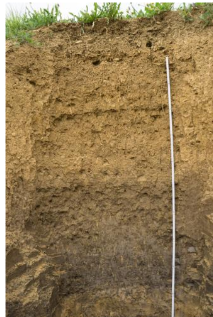
Tiefes kalkreiches Kolluvium aus holozänen Abschwemmmassen über humosem Schwemmsediment