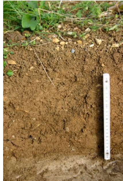
Pararendzina aus miozänem vulkanischem Tuff (v1)

Größere Flächenanteile nehmen die z. T. ebenfalls flachgründigen Pararendzinen aus Deckentuff ein ( v1 ). Die Ackererträge werden in trockenen Jahren durch die geringe nFK begrenzt. Die Pararendzinen aus umgelagertem Tuffmaterial, Juranagelfluh oder Geschiebemergel ( v43 , v7 , v12 , v18 , v13 , v15 ) weisen häufig deutlich günstigere Werte auf. Hohe Skelett- und Tongehalte erschweren die Ackernutzung. Der mittlere langjährige Bodenabtrag ist meist als hoch bis sehr hoch (3 – < 6 bzw. ≥ 6 t/ha und Jahr) eingestuft. Eine Verminderung des weiteren Bodenabtrags auf dem Ackerland kann durch Verfahren der Konservierenden Bodenbearbeitung mit einer weitgehend ganzjährigen Bedeckung des Bodens mit Pflanzenbeständen oder Ernterückständen erfolgen.